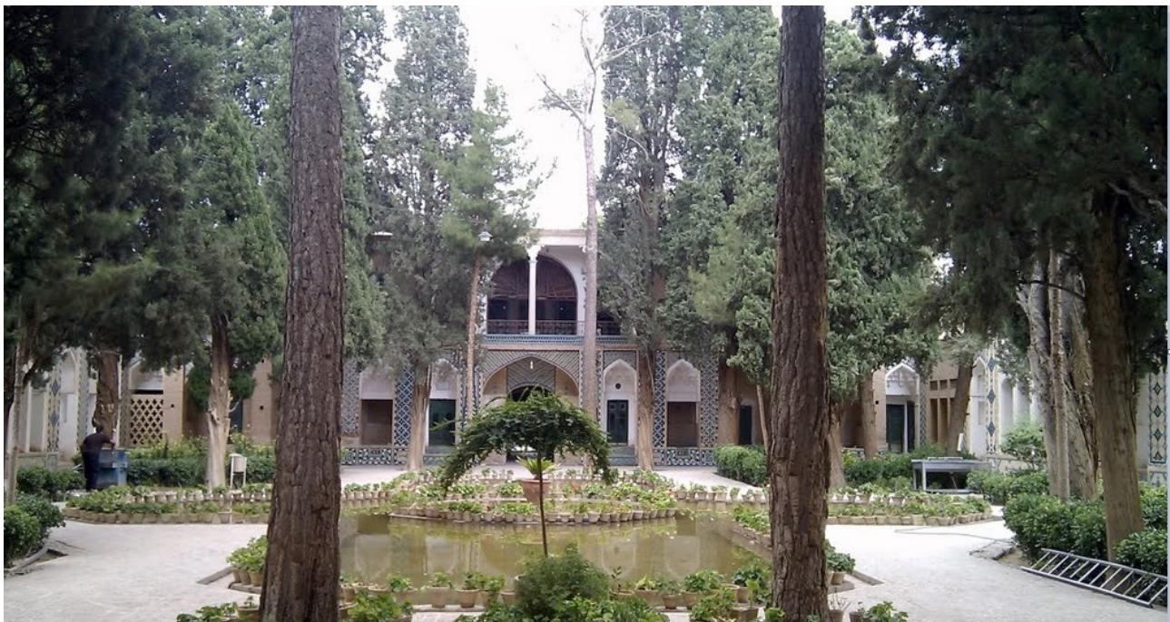
تصویر ۲. حیاط جلوی مزار با عناصر گزینشی و آرایش آن در راستا تأکید بر فضای معنوی، مقبره شاه نعمت‌الله ولی ماهان، مأخذ: http://static.panoramio.com/photos/large/56196221.jpg

کمک حیاطی که در قسمت جلوی مزار و گنبدخانه قرار گرفته است حریم خود را با بقعه حفظ کرده و حرمت این فضای معنوی را به جای می‌آورد. که بنابراین علاوه بر نقش زیبایی‌شناسانه و تلطیف فضا، عملکردی برای خدمت‌رسانی به مردمی که در آنجا اتراق می‌کنند دارد. با گذار از این حیاط و عبور از دروازه‌ای با سقف گنبدی که جهت تفکیک فضای این دو حیاط واقع شده است به حیاط دوم می‌رسیم. حیاط روبه‌روی مزار شاه نعمت‌الله ولی با حوضی که طرح صلیبی دارد، روایتی از یک فضای معنوی را به مخاطب خود ارائه می‌دهد. این حیاط نسبت به حیاط ورودی کوچک‌تر شده و بیشتر حجم آن را حوض و باغچه‌ها اشغال کرده‌اند (تصویر ۲). وسعت این حوض، قرارگیری آن در برابر بنا و انعکاس نقش بنا در آب عملکردی جهت تقدس‌بخشی به بنا دارد و نقش سلسله‌مراتبی جهت ایجاد فضایی معنوی و حضور قلبی برای ورود به مزار این عارف را به خوبی ایفا می‌کنند. همچنین عناصر نمادین قرار گرفته در قسمت‌هایی از حیاط، سرعت حرکت در آن مسیر را کم و درنگ‌هایی ایجاد می‌کنند. عملکرد حیاط ورودی به علت برخورداری از جوهره فضاسازی موردپسند ایرانی‌ها و قرارگیری در کنار مکان مذهبی بستری برای بروز سنت