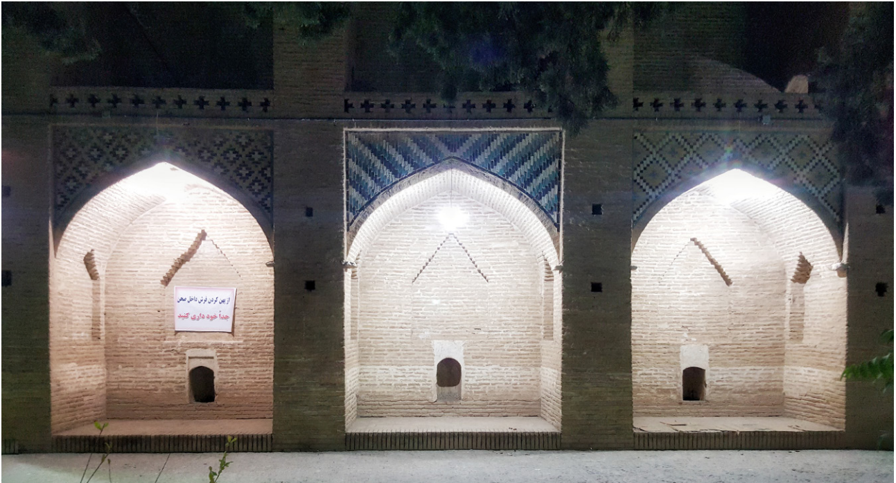
تصویر ۳. محل نشستن مردم دورتادور حیاط و پارچه اخطاردهنده برای جلوگیری از اتراق مردم در راستای سیاست‌های جدید، مقبره شاه نعمت‌الله ولی ماهان، عکس: سیده حسنا حسینی نسب، ۱۳۹۶.

مردمی و تفرجی ممانعت می‌شود. این در حالی است که این اماکن و سنت‌ها و نمادهایی که در آنها جاری است، میراث باارزش این مرزوبوم به شمار می‌روند. خوانش آنها نقش مهمی در شناخت فرهنگ و مردم داشته و تقویت و توسعه آن موجب تقویت فرهنگ غنی ایرانی است. پویایی و حضور فعال مردم در این مکان‌ها و تبدیل آنها به مقاصد تفرجی با دید غرورآمیز نسبت به تداوم یافتن این فرهنگ باارزش برداشت می‌شود (تصویر ۴).