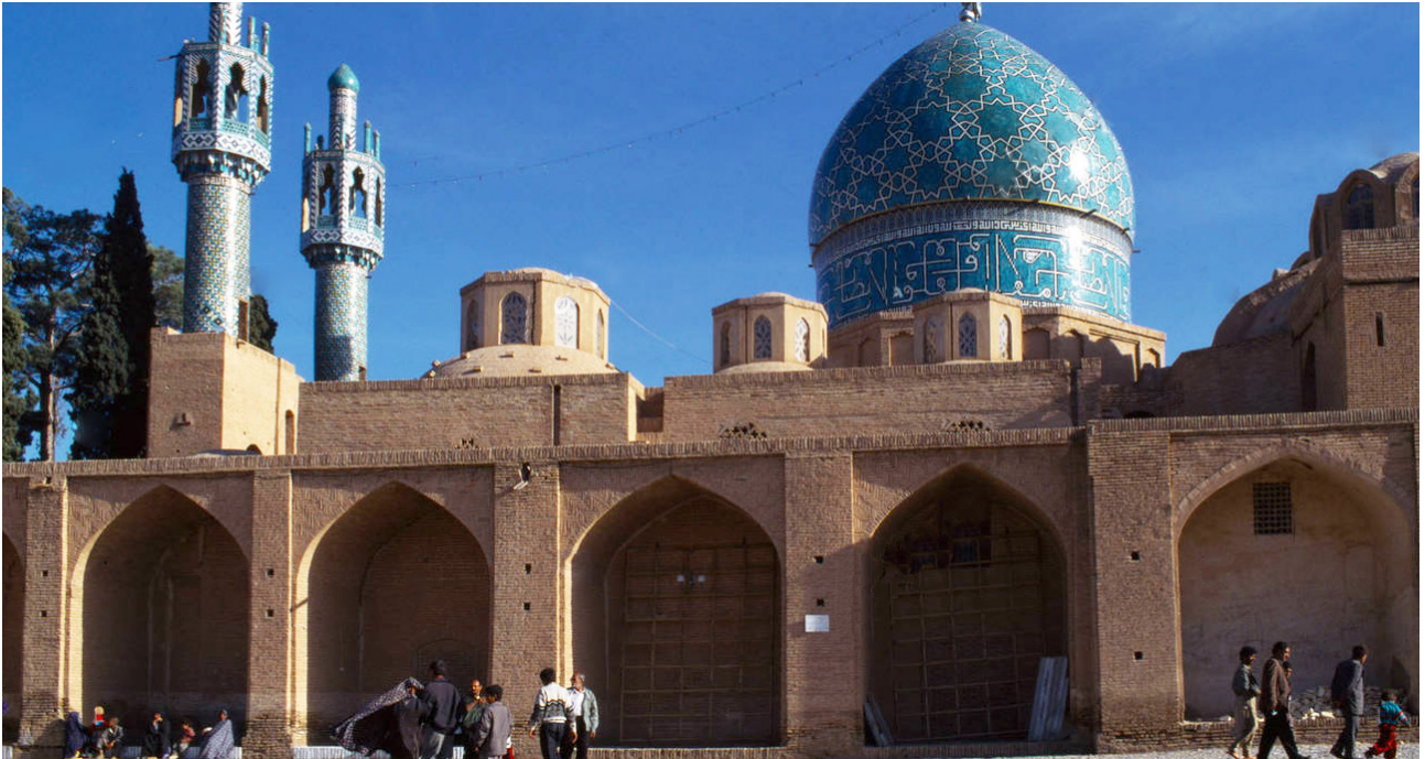
تصویر ۴. نمونه‌ای از انتراق مردم در رواق‌های اطراف مقبره و تفرج در کنار عمل زیارت/ مقبره شاه نعمت‌الله ولی ماهان

مکان مقدس بدانند، بلکه باید آن را نمودی از باورها و اعتقادات برخاسته از فرهنگی بدانند که ریشه در نیازهای مردم این سرزمین و هویت آنان دارد که علاوه بر ایجاد تعلق خاطر، به توسعه ابعاد اجتماعی و مشارکت‌های مردمی می‌انجامد و به جامعه نشاط و سرزندگی می‌بخشد.