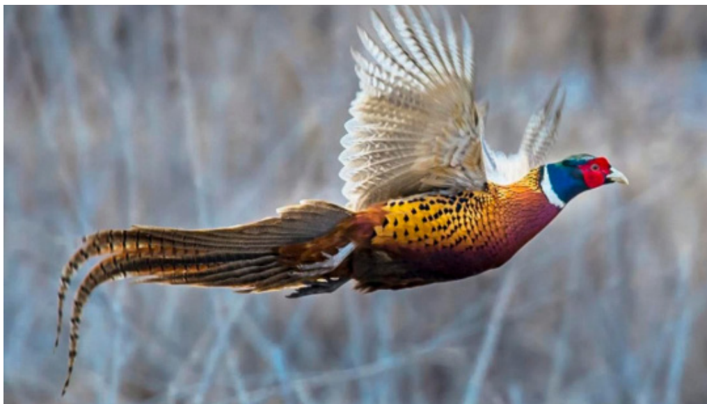
تصویر ۴. قرقاول شاخصی از سلامت اکوسیستم