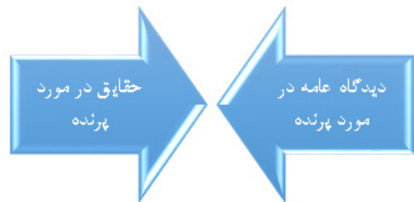
تصویر ۲. خلق تفسیر با استفاده از دیدگاه تقابل بین دیدگاه عامه و حقایق، مأخذ: نگارنده.

عمده غذای این پرنده را مغز استخوان حیوانات مرده تشکیل می‌دهد که به واسطه پرتاب شدن مکرر از ارتفاعات روی تخته سنگ‌ها از درون استخوان خارج شده است. آثار به جای مانده از تخت جمشید، سرستون‌ها و درب‌های ورودی آن که پایتخت هخامنشیان بوده است از جمله آثار به جای مانده از این پرنده اسطوره‌ای است. تأثیر این پرنده در برند هواپیمایی ملی ایران نیز غیرقابل انکار است. نام تجاری هما ایهامی است به این پرنده که در ذهن ایرانیان دارای خصوصیات برجسته است. نقل‌ها و گفته‌های متناقضی در میان عامه وجود دارد. این نقل‌قول‌ها در قالب جدول ۱ به شرح زیر مورد بررسی قرار گرفت.