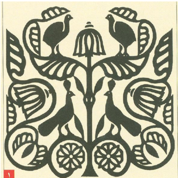
تصویر ۱. نقش طاووس و درخت زندگی در کارهای هنری، مأخذ: موزه متروپلیتن نیویورک.

است. هرچند عموم در مورد پرنده و مضامین مذهبی/محلی در برجسته‌شدن و متمایز شدن برخی از پرندگان نسبت به سایرین بی‌نقش نبوده‌اند.