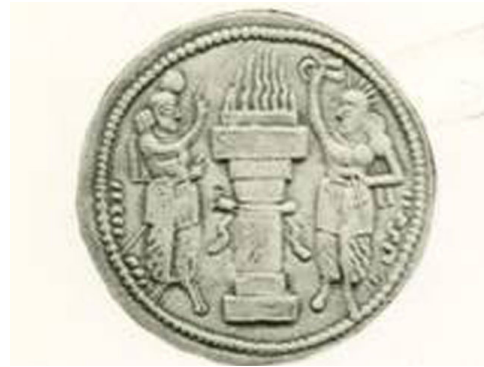
تصویر ۲. هرمز در زمان فرمانروایی ارمنستان، مأخذ: آورزمانی، ۱۳۹۳.

در هنر ساسانی است که در نقش برجسته فیروزآباد در نبرد اردشیر بنیانگذار سلسه ساسانی با اردوان پنجم در زمانی که شاپور ولیعهد او بود در آن نقش به چشم می‌خورد که برگستوان اسب شاپور این نشانه به شکل مبالغه‌آمیزی نقش و تکرار شده است (تصویر ۴).