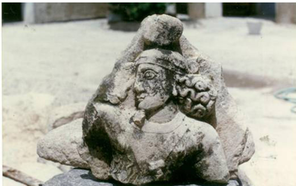
تصویر ۸. نقش برجسته هرمز، مأخذ: جوادی و آوزرمانی، ۱۳۸۸.

آسیب دیده به طوری که تشخیص آن غیرممکن است. اهورامزدا تاج کنگره‌داری بر سر دارد و صورت او به نحوی قابل تشخیص است. پس از بررسی‌های دقیق و طولانی به این نتیجه رسیدیم که این تصویر، نقش تاجگیری هرمز اول پسر شاپور است در حالی که اکثر شرق‌شناسان این تصویر را به شاپور اول نسبت داده‌اند (تصویر ۷).