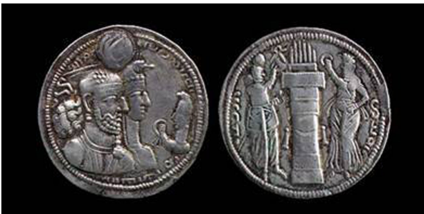
تصویر ۶. سکه در زمان بهرام دوم.

ناقص به شاهی برگزیده نمی‌شدند در یک عمل شجاعانه او را به جانشینی خود تعیین کرد و شاپور در این نقش برجسته جانشینی او را از سوی ایزدبانو آناهیتا به بینندگان و روندگان اعلام کرد. باید توجه داشت که تأیید الهه آناهیتا در آن دوران که مورد ستایش ساسانیان بود و اجداد شاپور افتخار پرستاری و تولیت معبد او را در استخر به عهده داشتند امری مهم و تعیین‌کننده بوده و ارادت شاپور به این الهه به حدی بود که معبد عظیمی مشابه معبد استخر در شهر بیشاپور برای او بنا کرد.