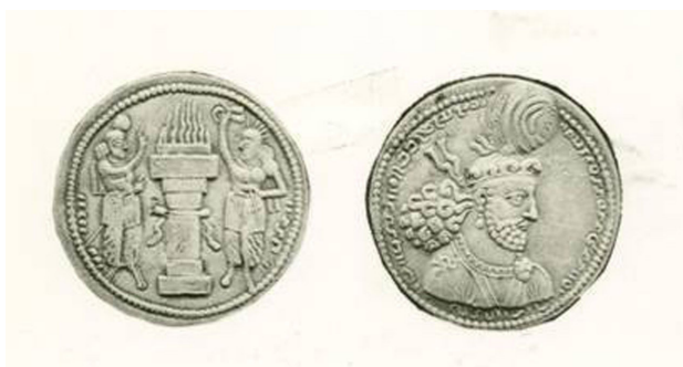
تصویر ۱. هرمز زمان فرمانروایی ارمنستان، مأخذ : فریدون آورزمانی، ۱۳۹۳.

بر پشت سکه‌های هرمز که پیش از سال ۲۷۲ میلادی ضرب شده‌اند و بر تعداد کمی بعد از آن منظره تاج‌گیری دیده می‌شود. سمت چپ آتشدان تصویر هرمز و در سمت راست آن تصویر ایزد مهر ضرب شده که حلقه شهریار و فرایزدی را به سوی هرمز دراز کرده است. این نخستین تصویر شناخته شده «ایزد مهر» در هنر ساسانی است. مهر با پوششی شبیه شاهنشاه تصویر شده و گرد سر او هاله‌ای از نور مشعشع است، این هاله نورانی ممیزه ایزد مهر است (تصویر ۲) در پشت سکه بعدی (روی سکه با عنوان کامل شاهی) تصویر شاهنشاه و ایزدبانو آناهیتا دیده می‌شود که پوششی بلند بر تن و شیئی مقدس (احتمالاً برسم) در دست دارد و بالاخره در پشت آخرین نوع سکه که از لحاظ زمانی پس از دو سکه نام‌برده ضرب شده تصویر اهورامزدا و هرمز در طرفین آتشدان دیده می‌شود. تصویر ایزد مهر، آناهیتا و اهورا مزدا در پشت سکه‌ها بیانگر شکل‌گیری آیین زرتشت و گذار ساسانیان از ناهیدپرستی به سوی مزداپرستی و حفظ جایگاه رفیع مهر و آناهیتا پس از اهورامزدا است. چنان‌که از سکه‌ها پیداست این