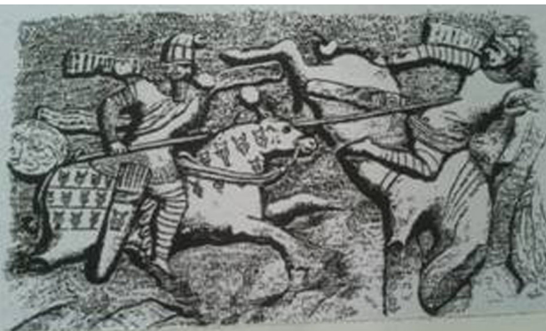
تصویر ۴. نبرد اردشیر با اردوان پنجم.

پشت سر شاپور و هرمز، شاپور شاه میشان فرزند دیگر فرمانروا و سپس نرسی فرزند سوم او و بالاخره چهارمین فرزند او گیلانشاه که از لحاظ مقام فروتر بود دیده می‌شود.