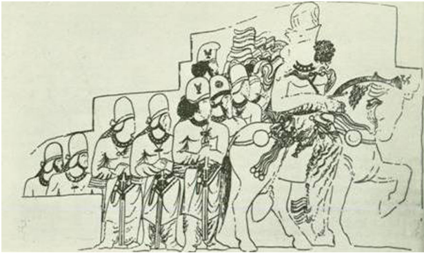
تصویر ۳. نقش رجب - شاپور اول سده سوم میلادی.