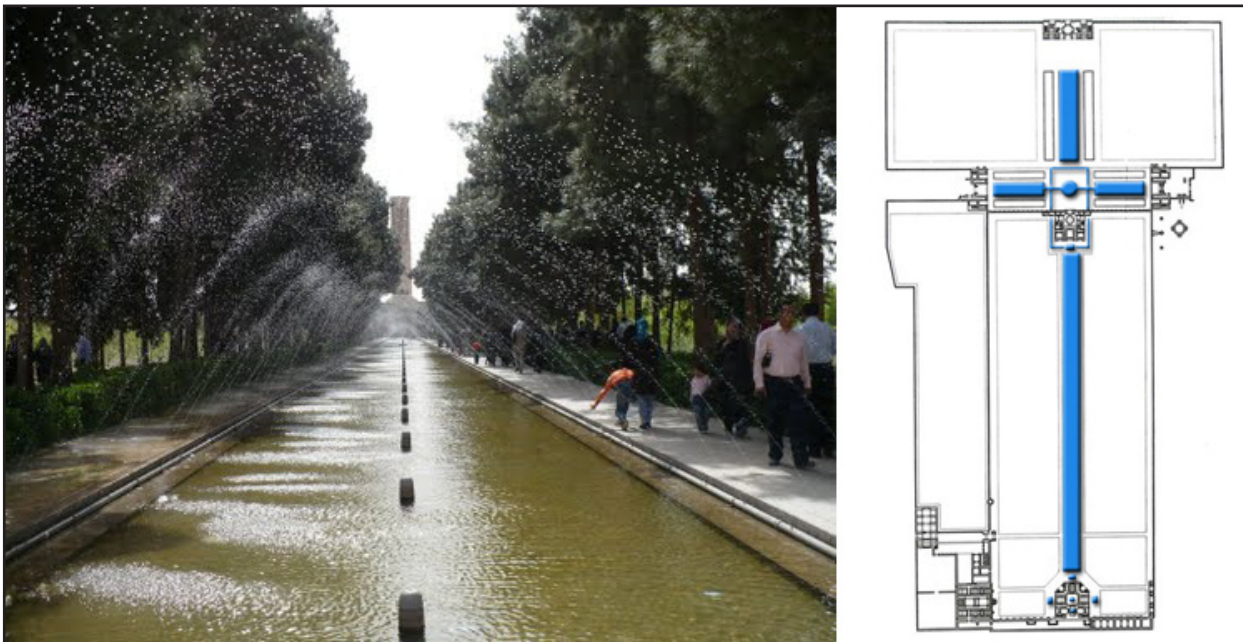
تصویر ۳. حضور پررنگ آب در محور اصلی باغ دولت‌آباد، یزد.

۲. ویژگی‌های معنایی- نمادین : آب نقش مهمی در ایجاد خنکی، انعکاس نور و اصوات دلپذیر دارد. آب در خشک‌بوم ایران، عزیز و کمیاب است و نظر کردن بر آن به ویژه در سپیده‌دم و اول ماه، باشکوه است. ایرانیان آب را با مشقت و مرارت به دست می‌آوردند و با صرفه‌جویی به کار برده و در باغ‌ها با هنرمندی‌های ماهرانه بیشتر از آنچه هست می‌نمایند (همان : ۶۰). به مدد این هنرمندی است که زیبایی، دل‌انگیزی، طراوت و لطافت باغ بیشتر جلوه‌گر می‌شود.