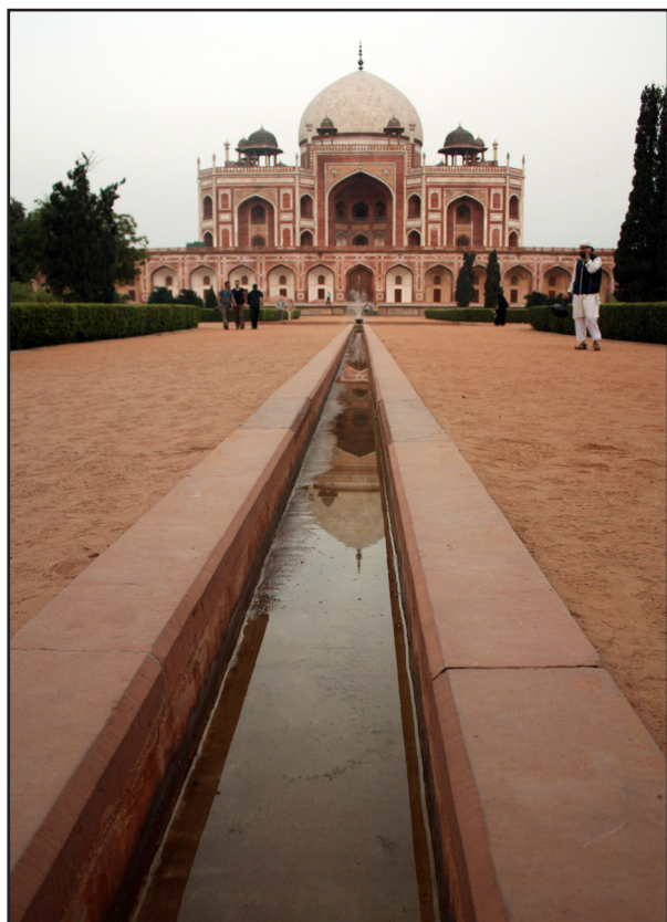
تصویر ۹. حضور کم حجم آب در جوی های باریک باغ هندی، باغ مقبره همایون، دهلی، عکس: آرزو شیردست، ۱۳۹۱.

بنابراین شاهد حضور ظریف و کم رنگ آب در جوی های باریک و با عرض کم نسبت به پیاده رو یا داخل حوض هایی با تزئینات بسیار زیاد و فواره های کوچک و مینیاتوری هستیم (تصویر ۹ و نک. تصویر ۲). در واقع این نهرها تنها حضوری نمادین و تزئینی به خود گرفته اند؛ تا جایی که تزئینات زیاد در حوض ها همراه با فواره های متعدد آب را تبدیل به عنصری تزئینی کرده و سبب شده در مواردی حوض با تزئینات زیاد و بسیار ظریف به عنوان بستر حضور آب حتی از خود عنصر آب هم مهم تر جلوه کند (تصویر ۱۰).