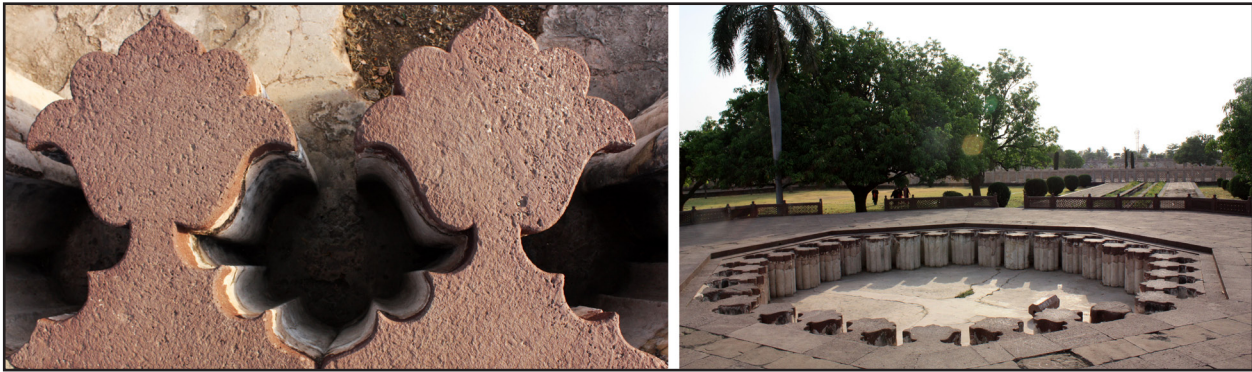
تصویر ۱۰. تزئینات زیاد بستر حضور آب در باغ‌های هند، باغ مقبره بی‌بی‌کا، اورنگ‌آباد. عکس: آرزو شیردست، ۱۳۹۱.