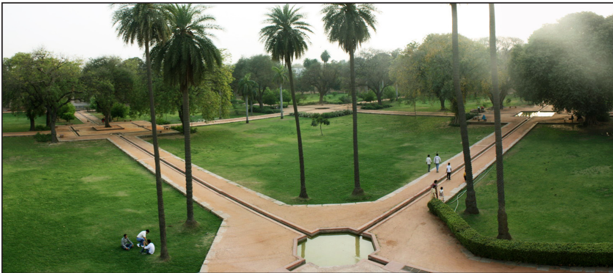
تصویر کشیده‌شدن جوی‌های ظرف و کم‌حجم آب در تمامی محورهای فرعی، باغ‌مقبره همایون، دهلی.

احداث می‌کردند. جریان ملایم آب با ایجاد پلکان در مسیر آن، تند و پرسروصدا می‌شد. در کف آب‌نماها و بیشتر جاهایی که آب در جریان بود، اغلب تخته سنگی با تراش سفید رنگ یا با طرح‌های مختلف کار می‌گذاشتند که به موج آب، جلوه زیبایی دهد. در حالی که کشور هندوستان دارای زمین‌های مسطح بوده و به شدت با کمبود آب‌های جاری مواجه بود. این امر منجر به بروز رویکردهای متفاوتی در رابطه با منظره‌پردازی شده است. به همین دلیل با حفر چاه، امکان احداث باغ را در زمین‌های پست و فاقد آب جاری هندوستان فراهم می‌آوردند (مسعودی، ۱۳۸۴) و در اغلب موارد آب در زمین‌های پست هندوستان به صورت ساکن به کار گرفته شده است (تصاویر ۷ و ۸).