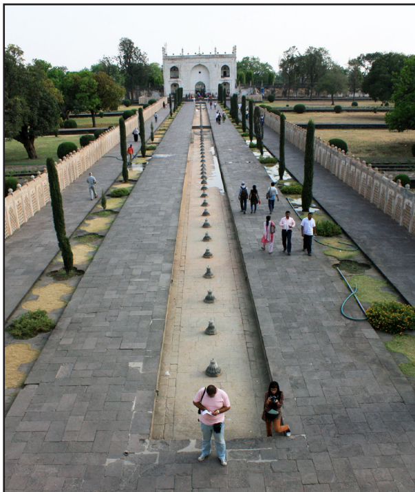
تصویر ۸. استفاده از حوض با آب ساکن در محور باغ هندی، باغ مقبره بی بی کا، اورنگ آباد، ۱۳۹۱.