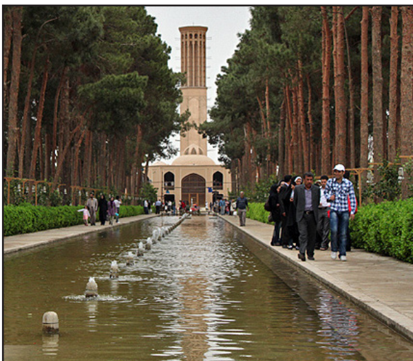
تصویر ۴. تناسب ابعاد آب‌نما با ارتفاع بادگیر در باغ دولت‌آباد، یزد.

بنابراین در باغ‌های ایرانی همواره شاهد حضور پررنگ آب در محور اصلی آن هستیم. به عنوان نمونه در باغ دولت‌آباد، قسمتی که همچون خیابان، رسمی‌ترین بخش از محور اصلی باغ را تشکیل داده، به دلیل بلندی، بر دیگر بخش‌های خیابان مسلط است و با داشتن جوی در میان خود به استخر باغ و کوشک اصلی متصل می‌شود. این محور در طول مسیر خود با رسیدن به کوشک و خلوت باغ، چهره و مقیاسی جدید را ارایه می‌دهد