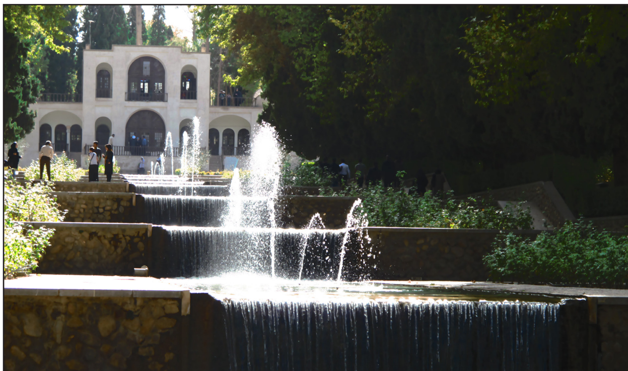
تصویر ۲. تکرار آبشارها براساس شیب طبیعی زمین و حضور پررنگ آب در محور اصلی باغ شاهزاده ماهان، کرمان.