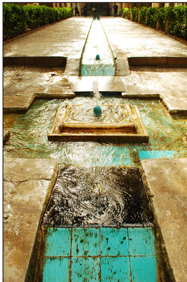
تصویر ۷. استفاده از آب جاری در محورهای باغ فین، کاشان.