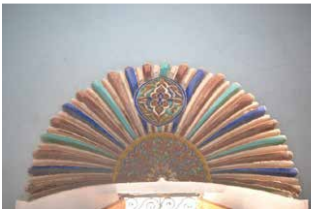
تصویر ۱۱. طرح صدفی قوس پنجره، اورزازات ۱ عکس: مژگان مختاری، ۱۳۹۵.