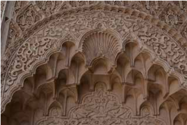
تصویر ۷. مقرنس صدفی، مدرسه بوعلیانیه. عکس: مژگان مختاری، ۱۳۹۵.