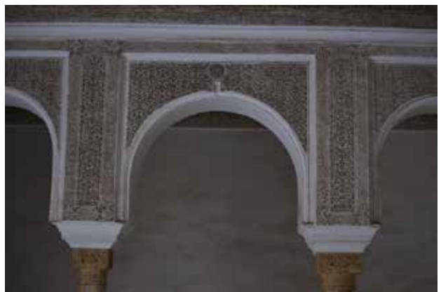
تصویر ۶. تطور نقش ریسمانی بر تارک قوس، عمارت مسکونی در اورزازات، مدرسه بوغانیه در مکناس، زاویه در مدینه طنجه، شبستان در مقبره مولا ادريس.