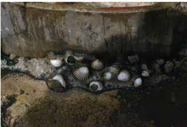
تصویر ۸. تزئینات صدفی سقابه مجاور خانقاه در مدینه تطوان. عکس: مژگان مختاری، ۱۳۹۵.