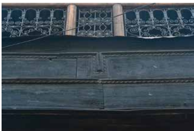
تصویر ۲. نقش ریسمانی برگرفته از چوب بست‌های طنابی، سراهای بازار در شهر مراکش. عکس: مژگان مختاری، ۱۳۹۵.

کرده و نظام شکل‌گیری الگوها را تبیین می‌کنیم. در این تحقیق با طرح فرضیه اصلی که مبتنی بر مطالعات کتابخانه‌ای شکل گرفت، به پیمایش میدانی نمونه‌های برجسته معماری مراکش پرداخته می‌شود، که با شناسایی سه الگوی التقاطی پر اهمیت در تزئینات مراکشی، سه فرضیه فرعی تحقیق تعیین یافت و پس از آن با ادامه بررسی‌های میدانی و بعد مطالعات کتابخانه‌ای اسنادی، ریشه‌های مجزای این الگوهای سه‌گانه تبیین شد.