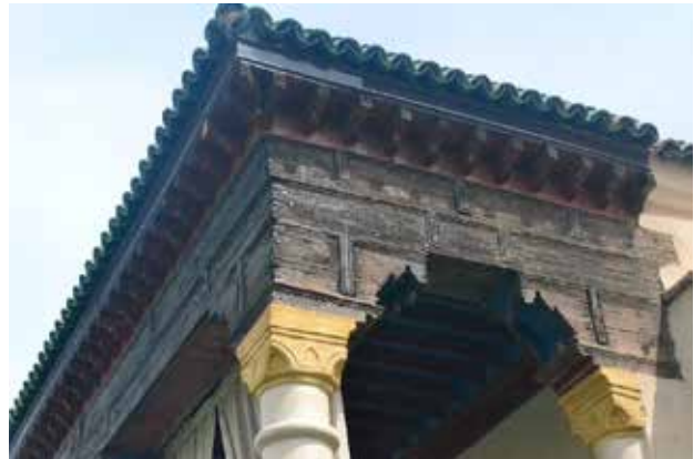
تصویر ۳. کاربست‌های نقوش ریسمانی در وضعیت‌های مختلف، عمارات مسکونی در شهر تطوان. عکس: مؤگان مختاری، ۱۳۹۵.