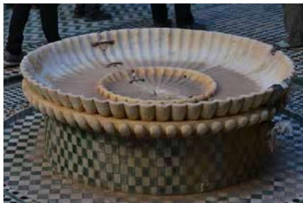
تصویر ۱۰. حوض مبتنی نقوش صدفی، مکناس.