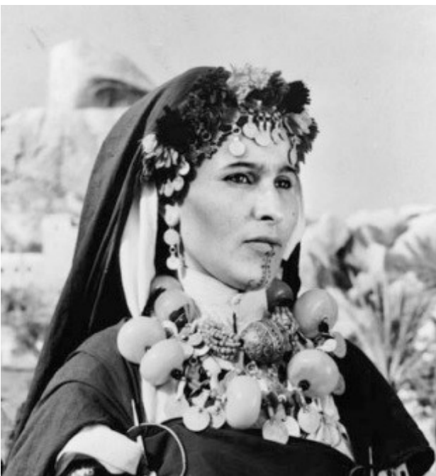
تصویر ۹. استفاده از صدف‌های حلزونی در تزئینات زنانه.