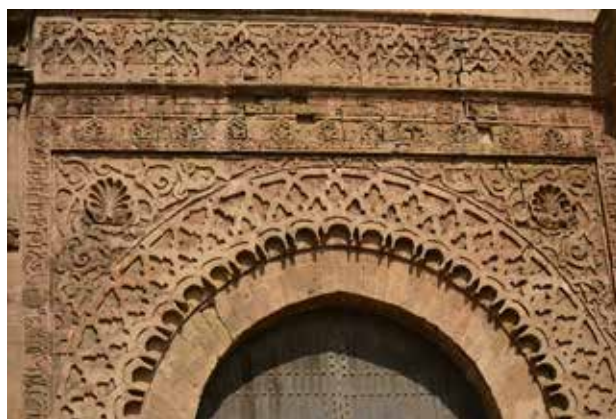
تصویر ۱۲. سردر قلعه رباط و پنجره مدرسه بوحنانیه، مکناس. عکس: مژگان مختاری، ۱۳۹۵.

نقوش هندسی گچین به کار گرفته شده در تزئینات اسلامی، تلاشی در جهت انتزاعی کردن تزئینات و رعایت حدود شرعی است. نظر به همین رویکرد نیز، هر چه از اسلیمی‌های گیاهی در هنر اسلامی به سمت نقوش صرفاً هندسی حرکت شود، کارکرد رنگی کمتر شده و این نقوش معمولاً به صورت تک‌رنگ با رنگ طبیعی مصالح به کار می‌رود که در نتیجه خاکی یا سپید است. اما در مراکش با توجه به اینکه این نقوش نه در واکنش به یک نیاز طراحی، بلکه به صورت آورده‌ای بصری استفاده شده‌است، در همان دستگاه نظری هنر افریقایی و بربری (ایزدی جیران، ۱۳۹۵: ۱)، با پوشاندن بخشی از قطاع‌های نقوش، رنگ‌هایی را پذیرفته که از آن به عنوان پالت رنگی هنر بربر نام برده می‌شود (Montague, 2012, 4). رنگ‌های قرمز، آبی و سبز در این میان فراوانی بیشتری دارند. همچنین در همین مسیر انتزاع‌زدایی، طرحواره‌هایی که این رنگ‌ها را پذیرفته‌اند، خود به صورت تجسمی گیاهی، از گل صورت‌بندی شده که این رویکرد التقاطی را بهتر نمایش می‌دهد (تصویر ۱۳).