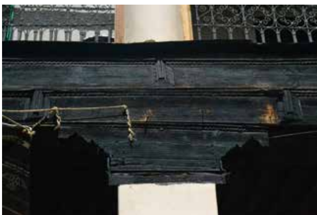
تصویر ۱. تاخوردگی در نقوش ریسمانی، سراهای بازار در شهر مراکش. عکس: مژگان مختاری، ۱۳۹۵.