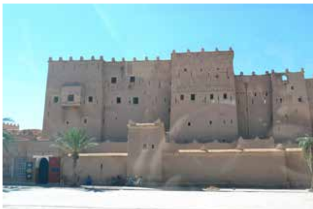
تصویر ۵. درز عمودی بر سر قوس‌های تزئینی معماری بربری، عمارت قصبه در اورزازات.