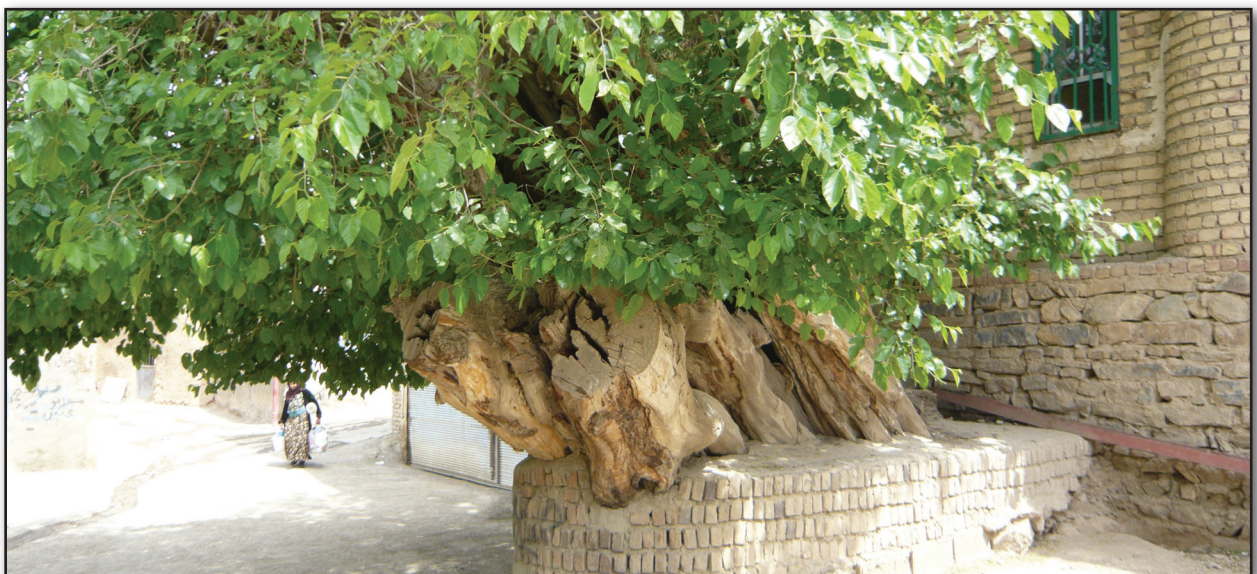
تصویر ۳: زیارتگاه نایسر (ناهیدسر) سنندج، درخت کهنسال، عکس: شهره جوادی، ۱۳۹۰.

تاریخ و در ادیان و باورهای مختلف بر آن تأکید شده است. از جمله رسوم مربوط به بزرگداشت آب و گیاه که با زندگی و سلامتی انسان‌ها پیوند داشته است. تقدس و احترام به طبیعت و مظاهر آن که در دین