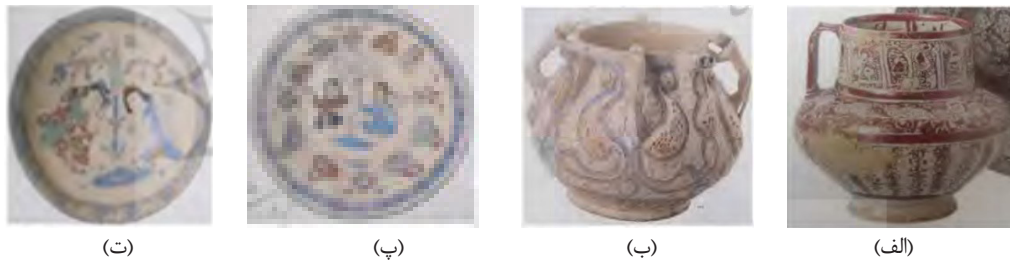
تصویر ۳. نمونه‌هایی از نقوش نمادین در سفالینه‌های ایران در قرون نخست اسلامی.

«من فرزند اعقاب شریف جمشیدم و امروز قرعه و میراث پادشاهان ایران به نام من آمده است... من شکوه آن‌ها را که به مرور زمان گم شده و به فراموشی رفته بود دوباره زنده می‌کنم، پس به اعراب بگو به کشور خود باز گردند، سوسمار بخورند و گوسفندانشان را بچرانند، چراکه من به کمک تیغ و پیکان قلم خود بر تخت پادشاهان ایران می‌نشینم» (اشرف، ۱۳۹۲، ۸۸). اشرف (همان، ۸۸-۸۹) در تحلیل این پدیده، جنبش شعوبیه را جلوه‌ای از احیای غرور قومی و باززایی هویت فرهنگی ایرانیان می‌داند و آن را گونه‌ای از «ناسیونالیسم اولیه پیشامدرن» در بافت جوامع اسلامی تفسیر می‌کند. در جمع‌بندی می‌توان گفت که پایداری فرهنگ و زبان ایرانی، حاصل یک فرایند تدریجی و چندوجهی بود که از مقاومت‌های مذهبی و فرهنگی زرتشتیان در سده‌های نخستین اسلامی آغاز شد و با احیای ادبی و سیاسی در دوران حکومت‌های محلی، به‌ویژه سامانیان، به اوج رسید. این روند نه صرفاً تلاشی برای حفظ زبان یا سنت‌های گذشته، بلکه بازتعریفی آگاهانه از هویت ایرانی در بستر تمدن اسلامی بود. از سوی دیگر، جنبش شعوبیه به‌عنوان بازتاب روشن خودآگاهی فرهنگی ایرانیان، نقش مؤثری در شکل‌گیری این هویت ایفا کرد؛ زیرا با تکیه بر میراث اسطوره‌ای، تاریخی و دینی ایران، زمینه‌پیدایش نوعی «ملی‌گرایی فرهنگی» پیشامدرن را فراهم ساخت. بدین ترتیب، تداوم زبان و اندیشه ایرانی در قالب شعر، ادب و اندیشه، نه تنها ابزار بقا، بلکه صورت‌بندی تازه‌ای از خودآگاهی ملی بود که در تقابل با سلطه عربی، شالوده فرهنگ ایرانی پس از اسلام را شکل داد.