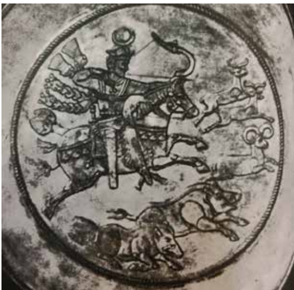
تصویر ۸. جام شکار یک پادشاه ساسانی، سده ۶-۵ میلادی، مجموعه شخصی.