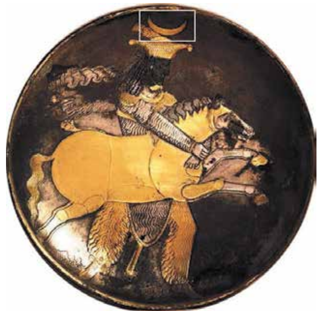
تصویر ۱. بشقاب شکار، قرن چهارم و پنجم میلادی، موزه میهو- ژاپن.