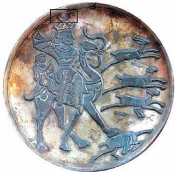
تصویر ۶. بشقاب نقره سبک ساسانی، قطر ۲۱/۷ سانتی متر.

ساسانی داده که از این قرار است: بهرام پسر بهرام، پیراهن وی سرخ، شلوارش سبز رنگ، تاج او به رنگ آسمان که میان دو رده طلا قرار گرفته و هلال طلایی نشسته بر تخت، در دست راست کمانی با زه کشیده و در دست چپ سه تیر بوده است. روی سکه‌های بهرام پنجم و پیروز، تصویر ماه بالای سر ایشان قرار دارد. همچنین در سکه‌های خسرو روی تاج بال‌دار او گویی است که در