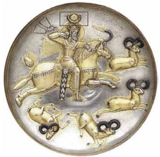
تصویر ۲. شاه خسرو پرویز در حالت شکار بز، قرن پنجم و ششم میلادی،

قطر ۲۲ سانتی‌متر، موزه متروپولیتن، نیویورک. مأخذ: Harper, 1981, 218