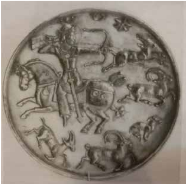
تصویر ۷. بشقاب سیمین زرانود با تصویر اردشیر سوم در حال شکار، قرن هفتم میلادی، موزه دولتی آرمیتاژ، لنینگراد.