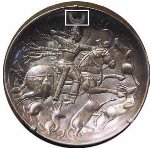
تصویر ۹. بشقاب، قرن پنجم میلادی، موزه لس‌آنجلس کانتی.

ماه و ستاره روی کلاه پادشاه از جمله عناصری است که نشانی از قدرت پادشاه ساسانی است که در کلاه سوارکار بافته ژاپنی نیز دیده می‌شود. همان‌طور که گفته شد، ماه در مذهب ایران خدای باروری و زیبایی است. از سوی دیگر، در مذهب زرتشتی هلال ماه دارای جایگاه ویژه دیگری نیز هست. از این جهت که هلال ماه