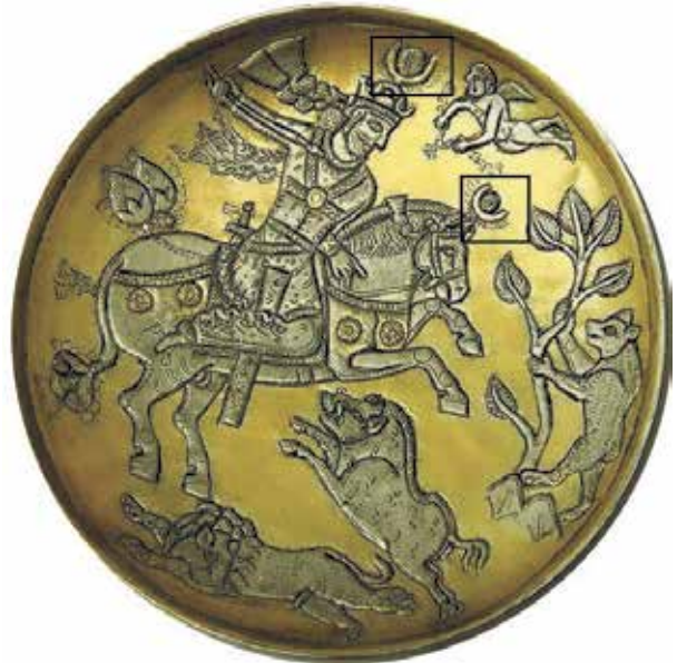
تصویر ۵. بشقاب شکار، قرن هفتم میلادی، موزه برلین، سده هفتم هجری، موزه متروپولیتن.