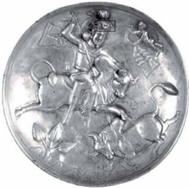
تصویر ۳. بشقاب، قرن پنجم میلادی، سبیری.

از قرن سوم تا هفتم میلادی نشان‌دهنده استمرار هنر فلزکاری و توانمندی هنرمندان ساسانی در خلق آثار فاخر و با کیفیت بالا است (Ettinghausen, 1990, 118) (تصاویر ۱ تا ۹).