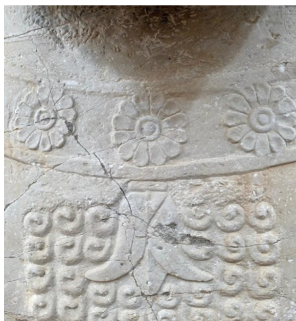
تصویر ۷. گل انار در پایه ستون کاخ آپادانا شوش.

گل انار به‌عنوان یکی از نمادهای غنی و کهن فرهنگ ایرانی، نقشی ماندگار در هنر، آیین و باورهای مردم این سرزمین ایفا نموده است. حضور آن در متون ادبی، تزئینات معماری- گچ‌بری، کاشی کاری و سایر تزئینات از دوران باستان تا عصر اسلامی، بیانگر جایگاه ویژه این نماد در انتقال مفاهیم معنوی، اجتماعی و فرهنگی است. در باورهای آیینی، گل انار به‌عنوان نمادی از باروری، جاودانگی و صلح شناخته می‌شود که ارتباطی عمیق با ایزدان آناهیتا و مهر- نمادهای مرتبط با طبیعت، دارد. در ادبیات فارسی، این گل نمادی