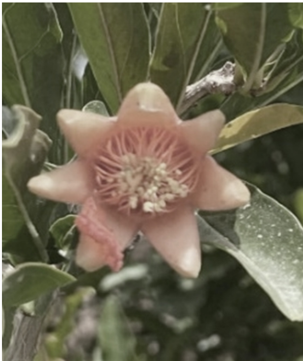
تصویر ۱. کلاله یا تاج گل انار.

در دوران هخامنشی و ساسانی، انار به‌عنوان نمادی از سلطنت و قدرت همچنین فراوانی و برکت تلقی می‌شد. در بسیاری از آثار هنری این دوره، زینت الاتی مانند: آویز و گشواره از طلا و همچنین پادشاه با تاجی مزین به طرح انار به تصویر کشیده