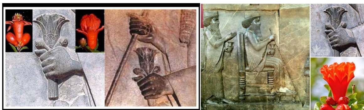
تصویر ۶. نقش برجسته داریوش که در دست گل انار دارد.

اسلام فرهنگ و هنر ایران در تداوم هنر و فرهنگ غنی دوران ساسانی با پالایش (حذف آنچه با دین جدید مغایرت داشت و حفظ موارد موافق با تفکر جدید) هنر و فرهنگی نوین افزید. هنر در دوران اسلامی در دو بخش هنر درباری در کاخ‌ها و هنر در بناهای اسلامی شکل گرفت. تزئینات معماری در بناهایی مانند: مسجد و... شامل نقوش هندسی و گیاهی بود و در کاخ‌ها از نقوش انسان و حیوان نیز استفاده شده است.