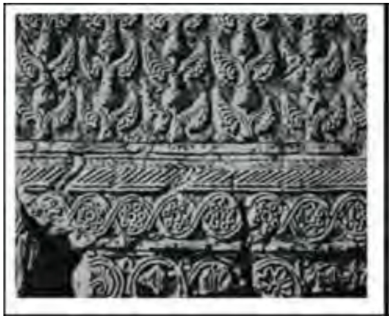
تصویر ۴. چال ترخان، لوح گچی با نقش انار.

جهت محبوبیت این نوع انار در میان خانم‌ها چنین نام گذاری شده است ۴ (انار در ایران، ۱۳۷۷، ۱۸۴ به نقل از عادل زاده و پاشایی فخری، ۱۳۹۴، ۳۶۸). نوع دیگر به «پنجه عروس» شهرت دارد که به جهت شباهت رنگ قرمز حنایی آن با انگشتان خضاب شده نوعروسان چنین نام گرفته است. از انواع دیگر انار که رابطه خاصی با ادبیات تغزلی دارد، می‌توان به انار «لیلی» یا «دختر حمومی» ۵ و همچنین انار فرهاد و رمان العابدین اشاره کرد. در بیستون درخت اناری روئیده بود که آن را «انار فرهاد» می‌نامیدند (عادل زاده و پاشایی فخری، ۱۳۸۷). و نوعی انار درشت بی‌دانه (انار کیوانی) نیز بوده که امروز اثری از آن نیست (آورزمانی، مصاحبه شخصی، ۲۰ مهرماه ۱۴۰۳).