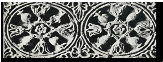
تصویر ۲. نقش میوه و گل انار یکی در میان، در گچ‌بری دیواری کاخ تیسفون، قرن ششم میلادی. مأخذ: Panjehbashi & Doolab, 2018, 26.

عشق با دستان خود و از خون دیو، درخت انار را در جزیره قبرس کاشت. این نوع رویش گیاه در اساطیر یونان یادآور گیاه «پرسیاوشان» یا «خون سیاوشان»، در اساطیر ایرانی است که فردوسی می‌گوید از خون سیاوش بر زمین پدید آمده است. به نقل از هال: «دانه‌های انار، در میان اقوام مدیترانه‌ای، خاور نزدیک، هندوستان و نقاط دورتر، به صورت یک نماد گسترده باروری و فراوانی درآمده است. انار نشانه الهه‌های یونانی، دمتر، پرسفونه و هرا بوده است. به پرسفونه قبل از عزیمت از سرزمین هادس (جهان فرودین)، یک دانه انار داده شد. انار به‌عنوان یک نمادی مسیحی موجب رستاخیز و جاودانگی بوده و از این رو عیسی در کودکی اناری در دست داشت. انار نزد عیسویان نماد عفاف هم بشمار می‌رفت» (Hall, 2001, 171). برخی نیز شکل کلاله یا تاج انار و رنگ سرخ آن را به دلیل شباهت به آتشدان همواره مورد تقدس قرار می‌دهند (تصویر ۱). همچنین سرخی انار به سرخی خورشید و تاج آن شعاع‌های خورشید را تداعی می‌کند و از این رو انار و گل سرخ انار به میترا-مهر نیز نسبت داده شده است.