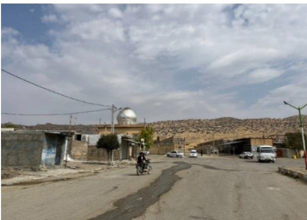
تصویر ۴. محور اصلی تعریض شده ورودی روستا ابوالوفا منتهی به امامزاده.