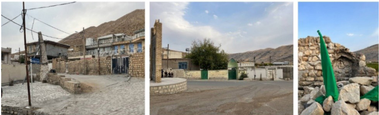
تصویر ۶. عناصر هویتی و اجتماعی روستای خسروآباد (راست به چپ: آتشکده باباسلام، مرکز محله، میل).