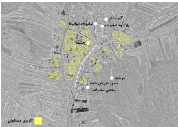
تصویر ۳. نقشه هوایی روستای ابوالوفا و نشانه‌های هویتی و اجتماعی موجود.