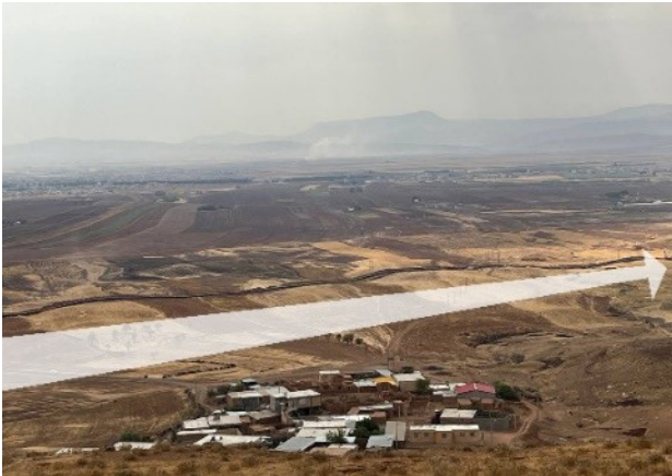
تصویر ۲. عبور خطوط لوله گاز از میان زمین‌های کشاورزی در روستا سرخ‌دم موجب از هم گسیختگی زمین‌ها و آسیب به نحوه معیشت روستاییان شده است.