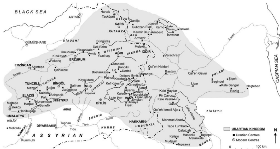
تصویر ۱. پادشاهی اورارتویی و حوزه نفوذ و گسترش آن‌ها. مأخذ: Gökce et al., 2012, 107.

این پژوهش در چارچوب مطالعات تاریخی انجام گرفته است و هدف آن مشخص کردن تبعات کوچ اجباری در دولت اورارتو