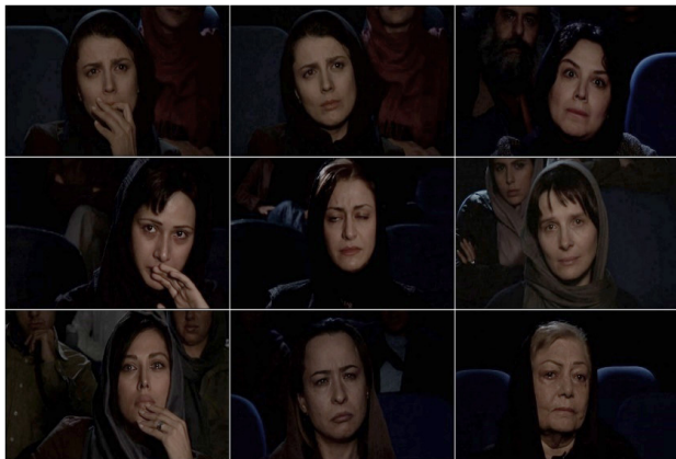
تصویر ۴. شیرین به‌مثابه موزه‌ای از چهره‌های ستارگان زن سینمای ایران.

بررسی فیلم شیرین در نسبت با توانایی سینما در ارائه چهره همچون یک منظر در انتظار اکتشاف و امکانات چهره‌شناسانه این رسانه که مخصوصاً در دوران اولیه و پیشاکلاسیک آن به کار گرفته می‌شد، نشانگر این است که کیارستمی، عامدانه این توانایی سینمایی را در اثر غیرروایی خود به خدمت می‌گیرد تا بازی بچیند که در آن، روابط مفروض بین مخاطب و ستاره سینمایی در فیلم‌های روایی، جایگاه ستاره سینمایی همچون یک مخاطب عادی و به‌خصوص رابطه پرفراز و نشیب ستاره زن و مخاطب در تاریخ سینمای ایران را به چالش بکشد. فیلم، ستاره‌های زن مؤثر در حافظه سینمایی ایرانیان را در جایگاه مخاطبان می‌نشانند و واکنش‌شان را همچون مخاطبی عادی، در نمای نزدیک ارائه می‌کند. با این کار، فیلم همچون موزه‌ای می‌شود که این افراد را از زمینه خاصی که ستاره‌شان کرده یعنی تصویر سینمایی‌شان، جدا می‌کند و با نفوذ و پرده‌داری خاص نمای نزدیک در عواطف و احساسات، از جایگاه دسترس‌ناپذیر و افسانه‌ای این ستارگان، افسانه‌زدایی می‌کند و با کیفیت لامسه‌ای، فضای تصویری ایشان را به فضای بدنی