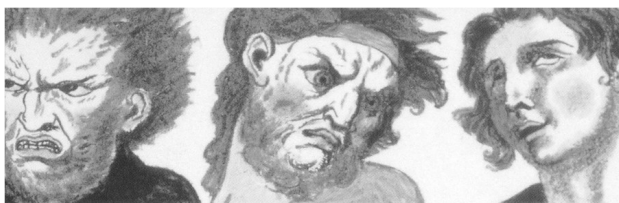
تصویر ۱. تحلیل‌های چهره‌شناسانه دلا پورتا. مأخذ: Bruno, 2002.

«چهره یک نقشه است» (Deleuze, 1987)، و «از یک زندگی درونی، از سوژکتیویته» رازهایی را آشکار می‌کند (Steimatsky, 2017). آنچنان که مایکل تاسیگ بحث می‌کند، لغت یونانی برای چهره prosopon یا mask است. اتیمولوژی این واژه از یک ابهام معنایی برخوردار است، توامان به مفهوم نمایش‌دهنده و ماسک دلالت می‌کند. چهره به مثابه چیزی درک می‌شود که همچنان که واقعیت نهفته در درون را بر ملا و آشکار می‌سازد، در عین حال به طور توامان آن را مخفی می‌سازد (Davis, 2003). از این رو چهره به مثابه نوار موبیوس عمل می‌کند (Steimatsky, 2017) و از مشخصه سمپتوم برخوردار است (Hake, 1997). در کنار آنچه آشکار می‌کند، توجه را به آنچه مخفی می‌شود نیز جلب می‌کند. ریشه اصطلاح چهره‌شناسی، به متون کلاسیک یونان باستان و خصوصاً نوشته‌های ارسطو و فیثاغورث باز می‌گردد که رابطه میان ظاهر بیرونی چهره و سرشت و شخصیت درونی را بررسی می‌کند (Gunning, 2004; Davis, 2003). سپس در سده شانزدهم، یکی از مهم‌ترین و تأثیرگذارترین مباحث مرتبط با چهره‌شناسی توسط جوانی باتیستا دلا پورتا ارائه شد (تصویر ۱) (Gunning, 2004; Bruno, 2002). در قرن هفدهم، شارل لو برن، اصول چهره‌شناسی را به مثابه راهکاری