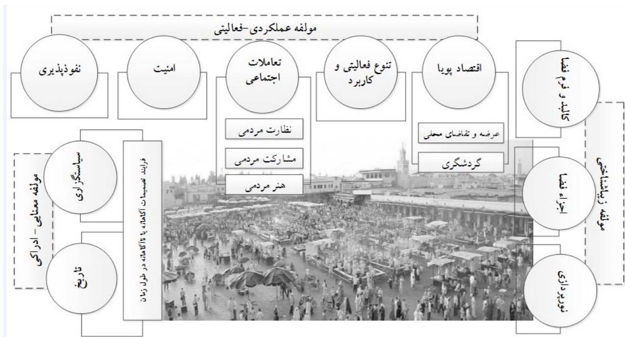
تصویر ۱. معیارها و زیرمعیارهای مؤثر بر فضای جمعی، مأخذ: نگارندگان.

«جماع‌الفنا»، اولویت‌بندی زیرمعیارها با استفاده از روش AHP انجام شده و مقایسه تجربه‌ها و امتیازدهی به آنها از نظر اهمیت در خلق فضای جمعی صورت گرفته است. پس از تحلیل مقایسه‌ای کیفی ذکر شده، تلفیق تحلیل نتایج به روش AHP در ارتباط با گزینه‌ها صورت می‌پذیرد و با شناخت تحلیلی سایت جماع‌الفنا، اولویت‌های برنامه‌ریزی برای مدیریت فضای جمعی مشخص خواهد شد.