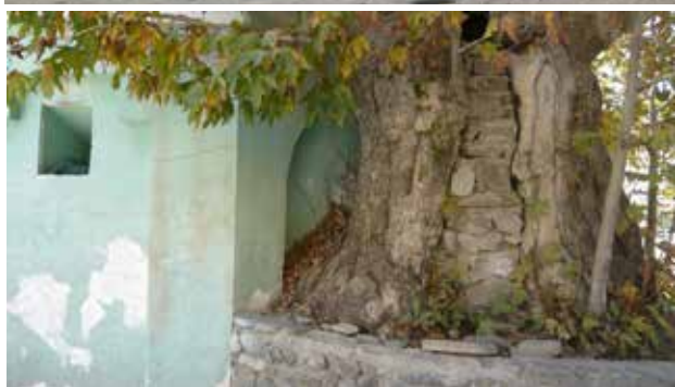
تصویر ۶. امامزاده حمزه، جاده ابلعی. عکس: شهره جوادی، ۱۳۹۱.

هنوز برای انجمن درویشان و برگزاری آیین‌های دینی به کار می‌رود (مقدم، ۱۳۴۳: ۵۰).