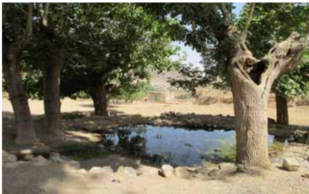
تصویر ۷. روستای نسلج، نیاسر کاشان. عکس: شهرزاد خادمی، ۱۳۹۰.

شده برخی از رمزهای آنها شبیه و گاه یکی شوند زیرا بسیاری از کارهای ویژه آنها به هم شباهت دارد و یا مکمل یکدیگرند؛ مهر خویشکاری باران‌زایی و افزون دهنده آب‌ها را دارد و آن‌ها آب پاک نیالوده همه جا گستر و نیرومند و برکت‌بخش است؛ گرمی‌داشت آب و آفتاب یا ماه و خورشید که نمادهای آن‌هاست و مهر هستند از دو جهت در معاش وابسته به کشاورزی اهمیت داشتند: اول برای شکرگزاری از بودن این عناصر یا ایزدان مقدس و دوم به جهت شرایط جوی و خشکسالی‌ها و نگرانی از دست دادن آنها (بهار، ۱۳۷۷: ۳۶). معابد مهر در کنار یا نزدیک آب جاری یا بر روی آب‌انبار می‌ساختند؛ در کنار معابد مهر آبدانی وجود داشته است که پیش از ورود به معبد تن و روان را می‌پالودند (همان: ۹۸-۹۷).