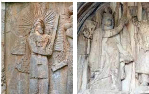
تصویر ۴. محوطه و غارهای تاق بستان (غارمعبد)، کرمانشاه، چشمه، درختان کهنسال و نقش‌برجسته‌های مهر و آناهیتا. عکس: سیدامیر منصوری، ۱۳۹۴.