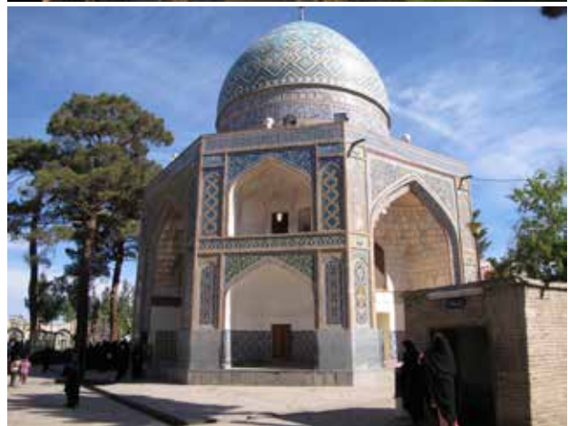
تصویر ۲. قدمگاه نیشابور.