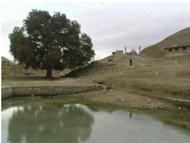
تصویر ۱. امامزاده زبیده خاتون، نراق، عکس: سیدامیر منصوری، ۱۳۸۷.

در آیین مهری، مهر پدیدآورنده جهان و خداوند این جهان است (جنیدی، ۱۳۸۵: ۱۱). بغ‌مهر، ایزد فروغ، ایزد روشنی، شاه‌چراغ، نگهبان پیمان، پشتیبان جنگلیان و راستگویان و درستکاران، پیشوای آیاران (عیاران)، علی‌الاهیان، داوود کوود (کبود) سوار، یار غار، زورخانه، پهلوان و لوتی را بازشناسید و از بزرگترین سرافرازی نخستین دوران سروری مردم آریایی ایران زمین آگاه شوید (حامی، ۱۳۳۵: ۱).