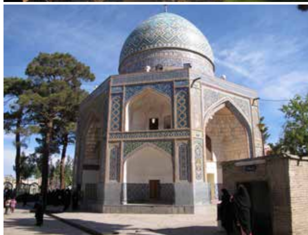
تصویر ۲. قدمگاه نیشابور. عکس: سیدامیر منصوری، ۱۳۸۷.