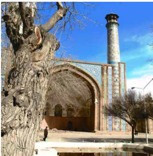
تصویر ۵. سرداب یا زیرزمین مسجد، قزوین شبستان جنوبی-قبله که به آتشکده موسوم است. شبستان شمالی مشرف به حوض و درخت کهنسال از نشانه‌های معبد مهر و آناهیتا. عکس: سیدامیر منصوری، ۱۳۹۳.