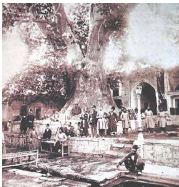
تصویر ۳. امامزاده صالح. تجریش، شمیرانات.