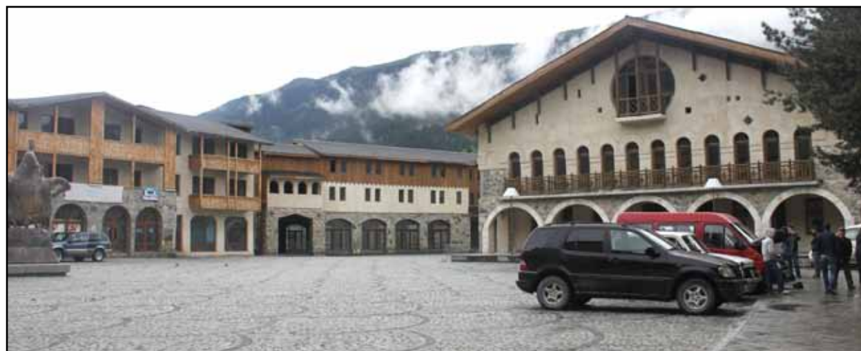
تصویر ۹. مرکز شهر مستیا تنها تقلیدی صوری از نمونه‌های غربی بوده و در آن فعالیت‌های مناسب برای ایجاد تعامل میان مردم شهر در نظر گرفته نشده است، مستیا، گرجستان، عکس: ریحانه حجتی، آرشیو مرکز پژوهشی نظر، ۱۳۹۲.

مدیریت شهری دوران استقلال تنها با رویکرد تقلیدی به دنبال ایجاد لایه‌ای تزیینی برای فضاهای شهری خود است. از این رو در جانمایی این فضاها همان رویه حکومت کمونیستی را دنبال می‌کند.