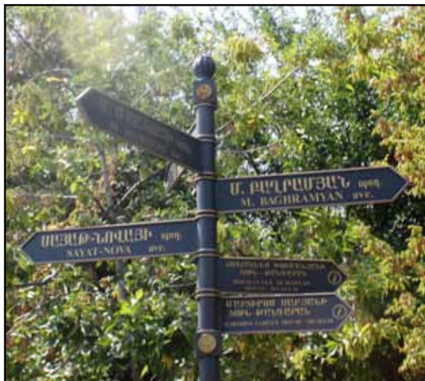
تصویر ۸. استفاده از میلان شهری با تقلید از میلان شهری پاریس نمونه‌ای از رویکرد غرب‌گرای مدیریت شهری ایروان است، ارمنستان، عکس: ریحانه حجتی، آرشیو مرکز پژوهشی نظر، ۱۳۹۲.

آن باشد، فضایی بی‌رونق است که تنها رهگذران آن گردشگرانی هستند که می‌گذرند بدون آنکه از زندگی و معیشت مردم این شهر اطلاعی پیدا کنند.