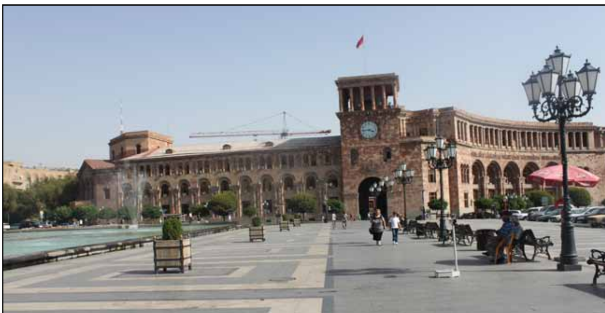
تصاویر ۶ و ۷. طراحی نامناسب فضای جمعی در میدان جمهوری ایروان موجب شده این فضا در طول روز فضایی خالی از جمعیت و محل گذر باشد، ارمنستان، عکس: ریحانه حجتی، آرشیو مرکز پژوهشی نظر، ۱۳۹۲.

می‌کرده، با مرمت‌های اخیر به کلی ویژگی‌های سنتی خود را در ساختار و عملکرد از دست داده است. احداث کاربری‌های تجاری با دهنه‌های بزرگ که غالب آنها خالی و بی‌رونق بوده و استفاده از میلمان با الگوهای اروپایی محصول رویکرد کالبدمحور غربی است نه برآمده از نیازهای مردم شهر. مردم این شهر نه توانایی مالی برای تملک این فضاهای تجاری را دارند و نه مقیاس فعالیتی آنها با فضاهای جدید ایجاد شده همخوانی دارد (تصویر ۹). نتیجه آنکه این فضای مرکزی که می‌توانست محلی برای عرضه صنایع دستی مردم شهر، برگزاری کارناوال‌های محلی و گفتگوی اهالی