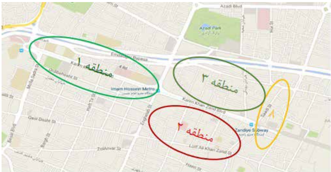
تصویر ۲. نقشه خیابان زند شیراز- خیابانی به طول تقریبی ۲۳۰۰ متر که زیر نظر چهار منطقه شهرداری شیراز می باشد.