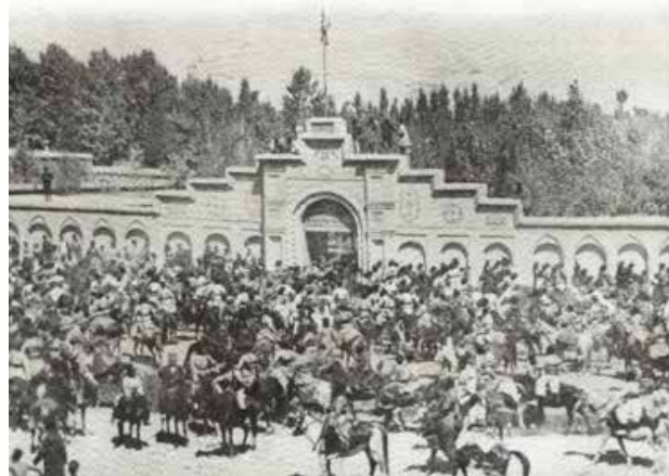
تصویر ۱. تجمع در مقابل قنصلگری انگلیس در خیابان زند دوره قاجار (۱۲۷۷ خورشیدی) - ماخذ: منصور صانع، ۱۳۹۰.

میدان توپخانه در سال ۱۲۷۹-۱۲۸۱ هجری شمسی توسط علا الدوله تعمیر و تزیین شد و چراغ‌های حباب داری اطراف آن نصب شد. هر روز عصر در میدان توپخانه، آب پاشی کرده، موزیک زده می‌شود و تمام صاحب منسبان با لباس نیمه رسمی در آن جا جمع می‌شوند و در این میدان مراسم‌های مختلف مذهبی و فرهنگی برگزار می‌شود (وقایع اتفاقیه، ۱۳۸۳: ۷۰۲-۷۰۸). عمده فعالیت‌های اعمال شده در خیابان در این دوره، فعالیت‌های فرهنگی، اجتماعی و سیاسی بود در نتیجه کاربری‌هایی که زیر نظر اداره بلدیہ و حاکم ایجاد می‌شد شامل: میدان توپخانه، بنای کنسولگری بریتانیا و ... از طرفی همجواری بازار وکیل در کنار ارگ کریمخانی، سبب تعاملات مردم و دستگاه‌های حکومتی گشت و در واقع خیابان زند پتانسیل تبدیل شدن به خیابانی