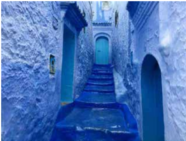
تصویر ۹. تسلط رنگ بر فضا سبب ثبت تجربه‌ی فضا با خصوصیت رنگی بودنش می‌شود.