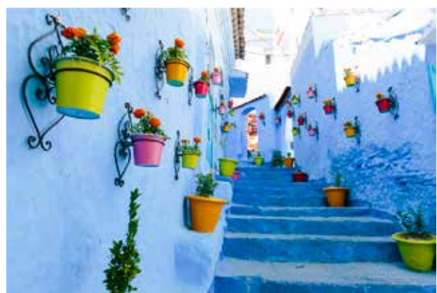
تصویر ۷. ایجاد تصویر منحصر به فرد با استفاده از کاربرد رنگ‌ها.