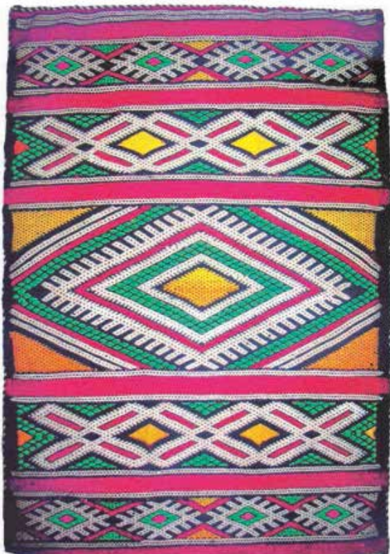
تصویر ۱۰. رنگ‌های اصلی در هنر بافندگی آمازیغ، زیرانداز آمازیغی مأخذ: Becker, 2006

اگرچه رنگ آبی (Indigo) در هنر و صنایع دستی بربرها نقش اصلی ایفا نمی‌کند، اما استفاده آن به صورت تک رنگ در حجاب و لباس مردان دسته‌ای از بربرها، ساکن در شمال غرب آفریقا، توجه به این رنگ را برمی‌انگیزد. به سبب استفاده از این رنگ و لکه‌ای