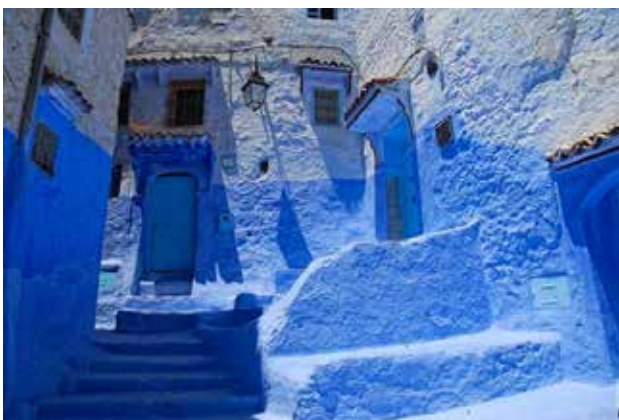
تصویر ۸. جذابیت در تنوع حاصل از سایه-روشن رنگ آبی.

رنگ در کوچه‌های مراکشی دربرگیرنده و محاط‌کننده است. در واقع کوچه‌های رنگی، تنگ و باریک با پیچ و خم‌های پی‌درپی، موجب می‌شوند ناظر خود را در متن رنگ کوچه می‌بیند. این احساس محاط شدن در فضایی از رنگ برای ناظر، دارای بداعت است. گاه تک رنگ فضا زمینه‌ای می‌شود برای حضور عناصر دیگر، که این ترکیب تکرار نشدنی بر جذابیت و بداعت کوچه می‌افزاید و در ذهن گردشگر پرنرنگ‌تر ثبت می‌شود. مانند کوچه‌ای در شفشاون که تک رنگ آبی جداره‌ها زمینه‌ی مناسبی برای حضور