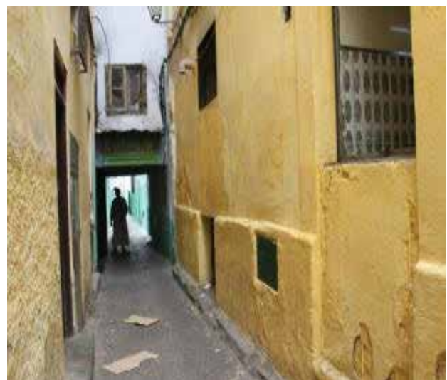
تصویر ۶. مدینه شهر تطوان. عکس: ریحانه حجتی، ۱۳۹۵.

(تصویر ۵). شاید بتوان گفت که در کوچه‌هایی که زندگی روزمره و مردمی جریان دارد، جداره‌ها با رنگ‌های مردمی که ریشه در فرهنگ و اعتقادات سنتی آن‌ها دارد، مانند زرد، سبز، قرمز و طوسی (در جایگزینی سیاه) رنگ شده‌اند (تصویر ۶). در کوچه‌هایی که به لحاظ نقش گردشگری پررنگ‌تر هستند، مدیریت شهری در پی برگزینی رنگ به‌عنوان سیاست تقویت گردشگری، رنگ آبی را که در فرهنگ و باور بومیان آفریقایی دارای اهمیت ویژه‌ای است، و نیز در میان مردم دنیا به رنگ آفریقا شهرت دارد، به‌عنوان رنگ اصلی در برندسازی انتخاب کرده است. علاوه بر این وحدت در تیرگی و روشنی رنگ آبی و یکنواختی در اعمال آن می‌تواند دلیلی بر این باشد که رنگ و کاربرد آن یک اقدام مدیریتی است، زیرا اگر مردمی بود از لحاظ شدت و کنتراست رنگ آبی با تنوع بیشتری مواجه بودیم. با توجه به آنچه که از جدول ۱ دریافت می‌شود، حضور رنگ آبی در مقایسه با دیگر رنگ‌ها فراوان‌تر است، در شهرهای شفشاون، اصیله و رباط رنگ اصلی است و در بخش‌هایی از تانژه و تطوان نیز دیده می‌شود. به نظر می‌رسد مدیریت شهری رنگ آبی را به‌عنوان رنگ اصلی برندسازی کوچه‌های مراکشی انتخاب کرده است، و برای متمایز بودن و در عین حال وحدت کوچه‌های مراکشی آن را با تفاوت‌هایی به‌کار برده است. چنانچه در رباط و اصیله رنگ آبی در ازاره در کنار سفید دیوارها به‌کار برده شده است. و این با آنچه در شفشاون اتفاق افتاده است متفاوت است، رنگ آبی در طیفی لطیف‌تر تمام سطح دیوار را پوشانده است، و این در ایجاد شخصیت متفاوت و شاخص کوچه‌های شفشاون بسیار