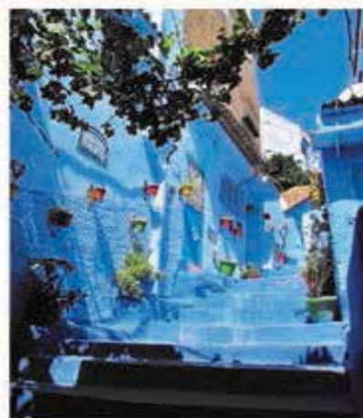
تصویر ۵. آبی، برند کوچه‌های شهر شفشاون. عکس: مولود شهسوارگر، ۱۳۹۵.