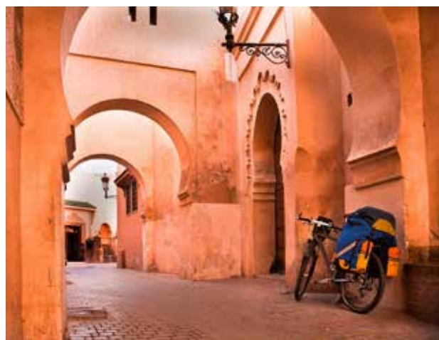
تصویر ۴. بداعت و جذابیت رنگ مصالح طبیعی در کوچه‌های تاریخی مراکش، شهر سرخ.