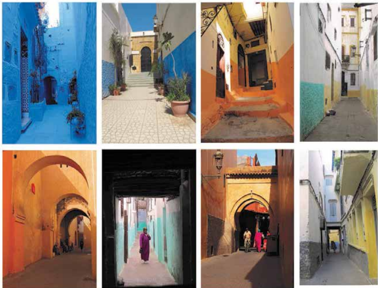
تصویر ۱. کوچه‌های مراکشی به سبب بداعت حاصل از رنگ، مورد بازدید قرار می‌گیرند و در خاطر می‌مانند. عکس: مولود شهسوارگر، ۱۳۹۵.

در شکل‌دهی به آن ایفا می‌کند (Singh, 2006). رنگ به سبب معانی و مفاهیم عمیق و متفاوتی که در فرهنگ‌های مختلف داشته است، همواره در هنر مردمان این فرهنگ‌ها جایگاه پراهمیتی داشته است و همچنین رنگ به واسطه‌ی نقش پررنگی که در زیباسازی و خلق جذابیت بصری فضا دارد، و همچنین تأثیر عمیقی که به لحاظ عاطفی و احساسی در فرد به جا می‌گذارد، می‌تواند انتخاب شایسته‌ای به‌عنوان برند گردشگری یک کشور باشد. کاربرد رنگ در فضاهای شهری می‌تواند به شهر شخصیت و ظاهری منحصربه‌فرد بدهد. سوئیترنوف در تحقیقات خود به این امر اشاره می‌کند، که رنگ ویژگی قابل توجهی است، که می‌تواند در طراحی محیطی به کار گرفته شود و در ارتقاء حس زیبایی‌شناسانه محیط انسان-ساخت دخیل باشد (Swirnoff, 2000).