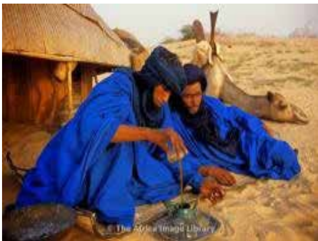
تصویر ۱۱. رنگ آبی پوشش گروهی از بربرها بر اساس اعتقاد به نیروی باراکای نهفته در این رنگ، که نیروهای شیطانی را دور می‌راند.

که لباس بر روی پوست آن‌ها به جا می‌گذاشت، به «مردمان آبی آفریقا» (Africa's Blue People) شهرت یافتند (تصویر ۱۱). این نوع پوشش و حجاب مردان ریشه در این باور آنان داشت که این رنگ به واسطه نیروی باراکا نهفته در آن، نیروهای شیطانی را خارج می‌کند (Lafforgue, 2015).