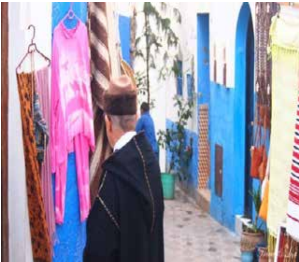
تصویر ۱۰. استقرار واحدهای فروش صنایع دستی در بافت. عکس: سهیل اسکندرزاده، ۱۳۹۵.