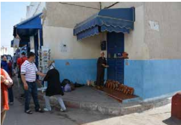
تصویر ۱۲. ایجاد کسب و کارهای مرتبط با صنعت گردشگری. عکس: سهیل اسکندرزاده، ۱۳۹۵.

از دیگر موارد که منجر به ایجاد تأثیرات مثبت بر بافت تاریخی شهر اصلیه شده است می توان به بهبود شبکه دسترسی اضطراری، ساخت و تدارک پارکینگ عمومی و ایجاد پیاده راه ها و فضاهای فراغتی اشاره نمود (Ibid). علاوه بر آن برگزاری مهم ترین فستیوال هنری مراکش در فصل تابستان در این شهر به تقویت جلوه های فرهنگی آن کمک نموده است و تأثیری مثبت در احیای فعالیت های مربوط به صنایع دستی و حفظ هویت فرهنگی منطقه داشته است. اگرچه برگزاری همین فستیوال که اصلیه را به مهم ترین مقصد هنرمندان عرب در سال تبدیل کرده است، خود نوعی اعتراض مردمی را در عدم بهره گیری از نیروها و منابع بومی به همراه داشته است (Eunice, Nd). از طرفی دیگر برگزاری این فستیوال تأثیرات مثبتی در بهبود وضعیت اقتصادی ساکنین و رونق پایه های اقتصادی مدینه از طریق ایجاد کسب و کارهای مرتبط با صنعت گردشگری داشته است. ایجاد کاربری های جدید نظیر هتل ها، رستوران ها، کافه ها، عملکردهای تجاری مربوط به فروش صنایع دستی، سازمان دهی تورهای گردشگری و ... همگی از عواملی هستند که منجر به ایجاد اشتغال و کسب درآمد برای ساکنین شده و به رونق اقتصادی شهر کمک می کند.