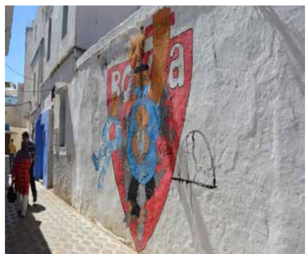
تصویر ۶. نقاشی های دیواری که در جداره های شهری خودنمایی می کند.

به عنوان شهری موزه ای و مقصد گردشگران و ساکنین غیربومی که برای گذران اوقات فراغت به شهر مراجعه می کنند، مطرح است. در جریان باز زنده سازی مدینه اصیله، المان های تاریخی و ابنیه مدینه مورد باز سازی قرار گرفت، علاوه بر آن توسعه زیرساخت ها و تجهیزات شهری از دیگر مواردی است که در شهر به چشم می خورد. در سطح مدینه دسترسی ها اصلاح و پارکینگ های عمومی پیش بینی شده است (Ibid). با حرکت در گذرهای خلوت شهر، نقاشی های دیواری بر روی جداره های سفید شهر به وضوح خودنمایی می کند و حاکی از تأثیرات فستیوال هنری کشور مراکش و توسعه فعالیت های اجتماعی - اقتصادی است. از دیگر مواردی که در بافت مدینه می توان به آن اشاره کرد توسعه گردشگری و فرهنگ است به گونه ای که فعالیت های مرتبط با صنعت گردشگری نظیر احداث هتل ها، کافه ها و رستوران ها و غرفه های فروش صنایع دستی و ... از موارد قابل ذکر می باشند.