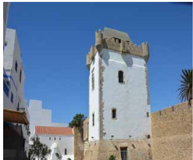
تصویر ۳. قصر ریسونی. عکس: سهیل اسکندر زاده، ۱۳۹۵.

پروژه باز زنده سازی بافت تاریخی اصیله در سال ۱۹۷۸ آغاز شد. در این پروژه سایت های تاریخی مانند حصار پرتغالی ها، برج الکمر ۴ و قصر ریسونی ۵ به صورت کامل باز سازی و بسیاری از فضاهای عمومی جهت عملکردهای تجاری باز زنده سازی شدند. کف سازی خیابان ها اصلاح شد و خانه های تاریخی مطابق الگوهای سنتی باز سازی شدند. در سال ۱۹۸۹ طرح احیاء و باز سازی اصیله موفق به کسب جایزه آقاخان شد و توجه به هماهنگی ساختمان ها با بافت مسکونی و ایجاد رابطه متقابل بین مهارت های محلی و بیرونی از دلایل کسب این جایزه اعلام شد (El Harrouni, 2010). امروز در نتیجه این برنامه احیاء و باز سازی، مدینه شهر بیشتر