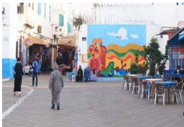
تصویر ۷. توجه به ایجاد فضاهای جمعی در بافت.

از دیگر موارد مثبت قابل ذکر، بهبود سیمای شهری و بهبود وضعیت