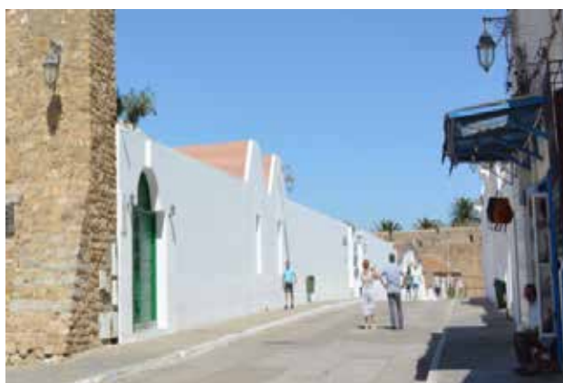
تصویر ۱۴. نمایش شدن بافت تاریخی. عکس: سپهیل اسکندرزاده، ۱۳۹۵.