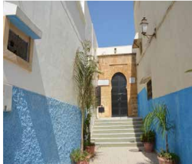
تصویر ۹. تنوع معماری در بافت تاریخی. عکس: سهیل اسکندرزاده، ۱۳۹۵.