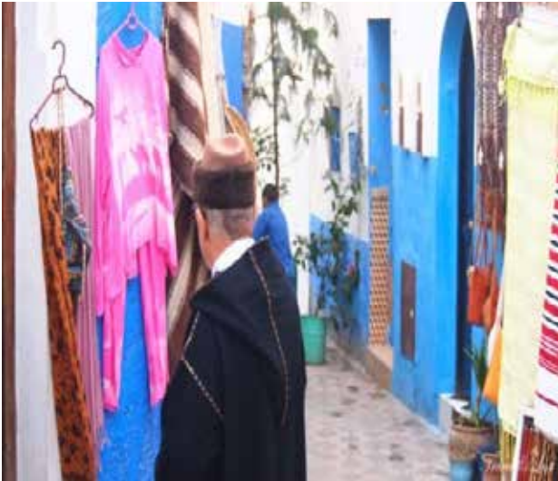
تصویر ۱۰. استقرار واحد های فروش صنایع دستی در بافت.