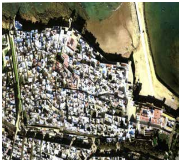
تصویر شماره ۲. عکس هوایی از بافت تاریخی شهر اصیله