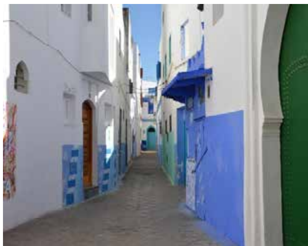
تصویر ۱۵. کم‌رنگ شدن ماهیت محله و عدم پویایی آن. عکس: سپهیل اسکندرزاده، ۱۳۹۵.

کسب حرفه صنایع دستی درون بافت تاریخی پیش‌بینی شده است. علی‌رغم وجود تمامی موارد مثبتی که در بالا ذکر شد و علناً در راستای حفظ و احیا منظر بومی شهر اصیله گام برمی‌دارد، بازدید از مدینه اصیله ویژگی‌های منفی‌ای را نیز در ذهن بازدیدکننده تداعی می‌کند. به عبارت دیگر اولویت به صنعت گردشگری در باز زنده سازی بافت تاریخی با وجود تأثیرات مثبت زیاد، تأثیرات منفی را به همراه داشته که به چند نمونه از آن اشاره می‌کنیم: مهم‌ترین تأثیر منفی برنامه احیا بر هم خوردن منظر مردمی بومی شهر است. مدینه اصیله امروزه به محلی برای گذران اوقات فراغت اهالی غیربومی تبدیل شده است، در اینجا خانه‌های افراد بومی توسط افراد خارجی و غیربومی خریداری شده و با ایجاد تغییراتی به ویلاهایی که تنها در برخی از اوقات سال مورد استفاده قرار می‌گیرند، تبدیل شده است. در نتیجه چنین اقدامی بافت تاریخی به اثری نمایشی برای گردشگران تبدیل شده و ماهیت حقیقی محله دستخوش تغییر شده است. در این شهر دیگر اثری از حیات جمعی و زندگی فعال شهری به چشم نمی‌خورد، امروز گذرهای خلوت از ویژگی‌های شاخص بافت به شمار می‌رود. علاوه بر آن به دلیل اتخاذ رویکرد قوی فرهنگی در طرح باز زنده سازی، کارخانه‌های صنعتی یا فرصت‌های کاری که به بهبود وضعیت اشتغال جمعیت بیکار منطقه کمک نماید پیش‌بینی نشده است. (Ibid)