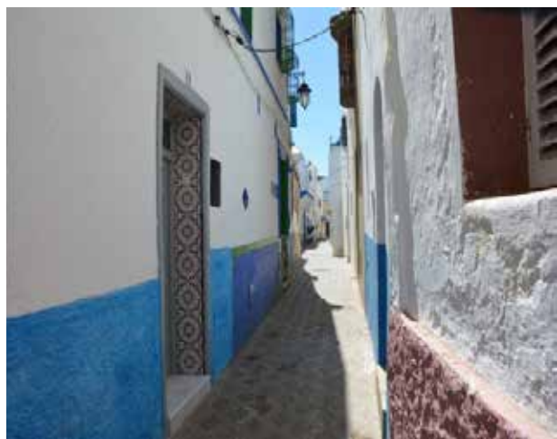
تصویر ۴ و ۵. گذرهای خلوت مدینه اصیله.