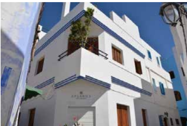
تصویر ۱۱. اختصاص کاربری های متناسب با صنعت گردشگری در بافت.