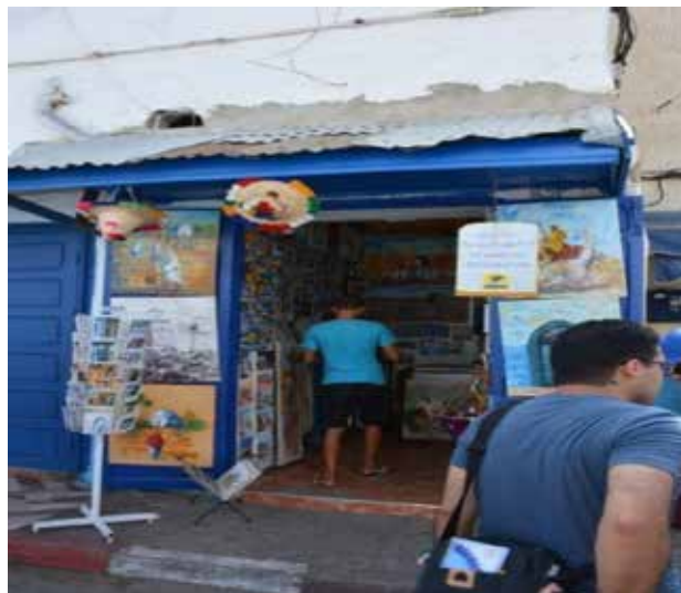
تصویر ۱۳. ایجاد اشتغال برای ساکنین. عکس: سپهیل اسکندرزاده، ۱۳۹۵.

قابل اشاره است. (The Aga Khan Award for Architecture, 1989) از دیگر تأثیرات منفی که باز زنده سازی مدینه اصیله به بار آورده می‌توان به کم‌رنگ شدن عرصه زندگی خصوصی ساکنین، ایجاد الگوهای نامناسب رفتاری به‌ویژه در میان جوانان، تغییر الگوی جمعیتی (افزایش مهاجر و کاهش جمعیت بومی) و نمایشی شدن زندگی مردم و آداب و رسوم سنتی اشاره نمود. علاوه بر آن، این پروژه در بعد اقتصادی نیز تأثیرات منفی را به بافت تحمیل کرده است که از جمله می‌توان به افزایش هزینه زندگی، افزایش قیمت زمین، نوسان درآمد، ورود افراد سودجو و ایجاد مشاغل کاذب و ... اشاره کرد (The Aga Khan Award for Architecture, 1989).