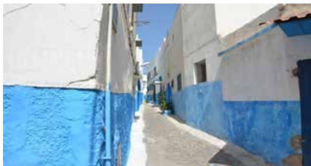
تصویر ۸. اصلاح کفسازی معابر.

از دیگر موارد مثبت قابل ذکر، بهبود سیمای شهری و بهبود وضعیت مناطق مسکونی از طریق بازسازی خانه‌های در معرض تخریب است. ساخت و سازهای مجدد صرفاً در محدوده‌های محصور با دیوارها امکان‌پذیر است. ابنیه جدید به همان سبک و سیاق بناهای تاریخی اسپانیایی و پرتغالی ساخته شده‌اند. تیرها و ستون‌ها از جنس بتن مسلح و در بعضی قسمت‌ها از دیوارهای باربر آجری بهره گرفته شده و سقف‌ها به وسیله تیرهای آهنی و آجرهای توخالی اجرا شده است. رایج‌ترین نوع مصالح برای دیوارها بتن و آجر توخالی است. نمای بیرونی از جنس سیمان با روکش نهایی آهک پوشیده شده است. عموماً از کاشی‌های با طرح سنتی و قطعات چوبی از درخت سدر برای بازسازی استفاده شده است. شایان‌ذکر است در بناهای موجود و قابل استفاده عملیات بازسازی و احیاء بناها با روش‌ها و مصالح سنتی صورت پذیرفته است (El Harrouni, 2000 & Eunice, Nd)