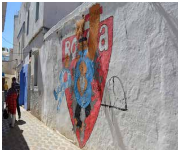
تصویر ۶. نقاشی‌های دیواری که در جداره‌های شهری خودنمایی می‌کند.

به‌عنوان شهری موزه‌ای و مقصدگردشگران و ساکنین غیربومی که برای گذران اوقات فراغت به شهر مراجعه می‌کنند، مطرح است. در جریان باز زنده سازی مدینه اصیله، المان‌های تاریخی و ابنیه مدینه مورد بازسازی قرار گرفت، علاوه بر آن توسعه زیرساخت‌ها و تجهیزات شهری از دیگر مواردی است که در شهر به چشم می‌خورد. در سطح مدینه دسترسی‌ها اصلاح و پارکینگ‌های عمومی پیش‌بینی شده است (Ibid). با حرکت در گذرهای خلوت شهر، نقاشی‌های دیواری بر روی جداره‌های سفید شهر به وضوح خودنمایی می‌کند و حاکی از تأثیرات فستیوال هنری کشور مراکش و توسعه فعالیت‌های اجتماعی - اقتصادی است. از دیگر مواردی که در بافت مدینه می‌توان به آن اشاره کرد توسعه گردشگری و فرهنگ است به گونه‌ای که فعالیت‌های مرتبط با صنعت گردشگری نظیر احداث هتل‌ها، کافه‌ها و رستوران‌ها و غرفه‌های فروش صنایع‌دستی و ... از موارد قابل ذکر می‌باشند.