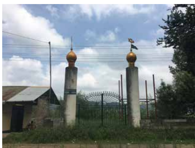
تصویر ۹. ورودی گورستان. شیرگاه، مازندران. عکس: شهره جوادی، ۱۳۹۵.

واقعیتی که چهره زیست و نازیبای آن در کشورهای جهان سوم متأسفانه آشکارتر است. البته هم در کشورهای جهان سوم هم جهان ما بعد صنعتی و ویرانی درونی انسان امروزی همه جا آشکار و محسوس است (شایگان، ۱۳۹۲: ۸۷).