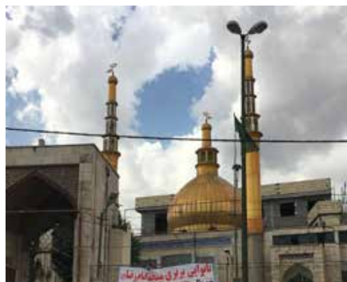
تصویر ۵. مسجدی در مسیر جاده فیروزکوه - شیرگاه عکس: شهره جوادی، ۱۳۹۵.