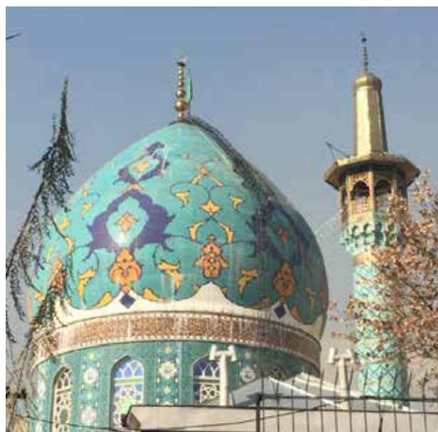
تصویر ۸. امامزاده صالح. تجریش، تهران. عکس: شهره جوادی، ۱۳۹۵.