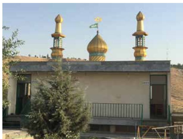
تصویر ۶. مسجدی در استان مازندران. عکس: شهره جوادی، ۱۳۹۵.