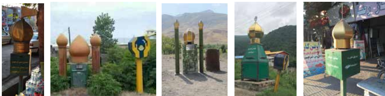
تصویر ۱۰. صندوق صدقات. عکس: شهره جوادی، ۱۳۹۵.

باید اذعان کرد که در موقعیتی دشوار، شرایطی فوق‌العاده پیچیده و نگران‌کننده قرار گرفته‌ایم. دولتیان، مجلسیان، قضائیان، نظامیان، معماران، مهندسان و در یک کلام طراحان و برنامه‌ریزان توسعه جامعه معاصر بعد انقلابی ما هنوز توجه چندان عمیق و جدی به پیچیدگی‌ها و دشواری‌ها و مخاطرات سخت و چالش‌های سنگینی که پیش‌روی جامعه معاصر ماست ندارند. طراحان و مهندسان معماری و فضاهای جامعه شهری ما آزاد و بی‌مهار هرچه می‌خواهند می‌سازند و هر آنچه را بتوانند ویران می‌کنند. شیوه عملی و عملکرد طراحان و مهندسان و معماران جامعه معاصر ما به‌هیچ وجه قابل قبول نیست. مبانی نظری آن‌ها، از بنیاد سست و غیر قابل قبول و تعریف نشده و غیر قابل توجیه است. به مقیاس جهانی نیز اساس کار چنین معمارانی بر فرم‌ها و باورهای رایجی استوار است که بر عموم مردم هر دم ناخوشایندتر می‌شود (آلسوپ، ۱۳۷۱: ۱۶). این نگرانی‌ها نسبت به هنر مدرن و امروزی است که از هنر با هویت و کاربردی گذشته فاصله گرفته و در نتیجه ارتباطش با مردم قطع شده است. غم‌انگیزتر و فاجعه‌بارتر از همه این است که معماری گذشته و به‌خصوص اماکن و بناهای