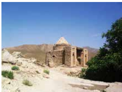
تصویر ۳. امامزاده علی. فاروج، خراسان شمالی