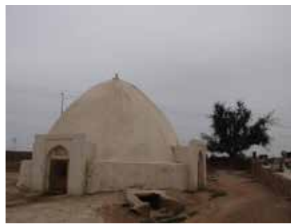
تصویر ۱. زیارتگاه صالح پیامبر. ابرکوه، یزد