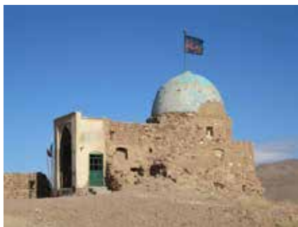
تصویر ۲. زیارتگاه شیخ اندرآبی، کیش