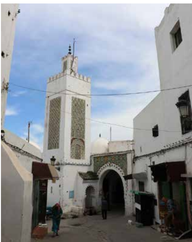
تصویر ۴. مسجد و بازار از عناصر اصلی تشکیل‌دهنده مدینه‌ها هستند. مسجد نیز علاوه بر کارکرد مذهبی، در ارتباط با بازار، مفصلی کالبدی است برای اجتماعات مردمی. مدینه تطوان. عکس: میثم خلیل‌پور، ۱۳۹۵.

شهرهای اسلامی و رومن هستند و در میان بافت عروقی و پیچیده شهر عناصر اسلامی معنا یافته و شهری چند مرکزی به وجود آمده است که در قلمرو خود در بافت اطراف نقش ایفا می‌کند. بر این اساس کالبد شهر برگرفته از نیاز به برقراری امنیت و غلبه فرهنگ رومن شکل یافته و مفهوم آن بر اساس اندیشه اسلامی و با هم‌نشینی بعد مادی و معنوی شکل گرفته است.