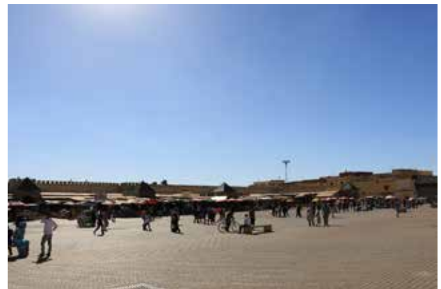
تصویر ۳. شکل‌گیری مرکز شهر در مدینه‌های مراکش در لبه شهر و خارج از حصار. سمت راست: میدان الهدیم در مکناس و سمت چپ: میدان جامع الفنا در مراکش. عکس: میثم خلیل پور، ۱۳۹۵.