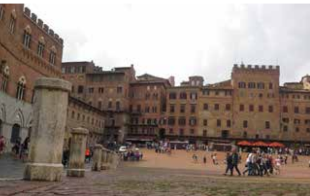
تصویر ۵ و ۶. فضای باز میدان دلکامپو سیه نا. عکس: سیده فاطمه مردانی، ۱۳۹۴.

میدانگاه‌ها و فضاهای گسترده و جمعی، هیچگاه نتوانسته است جای این فضا را بگیرد و جمعیت استفاده‌کننده از آن فضا را از آن خود کند (تصویر ۷ و ۸).