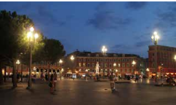
تصاویر ۳ و ۴: میدان ماسنا و فضاهای باز اطراف آن. عکس: هانی ارجمندی، ۱۳۹۴.