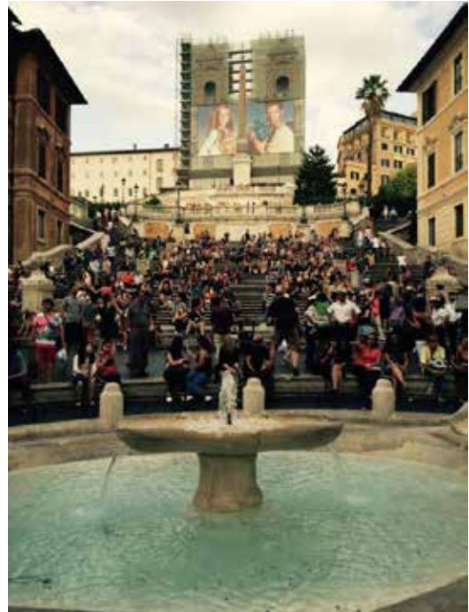
تصاویر ۸ و ۷. پله های اسپانیا شهر روم. عکس: هانی ارجمندی، ۱۳۹۴.