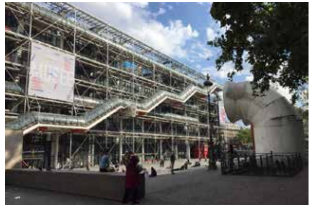
تصاویر ۷ و ۸: موزه ژورژ پمپیدو و فضای باز مقابل آن.