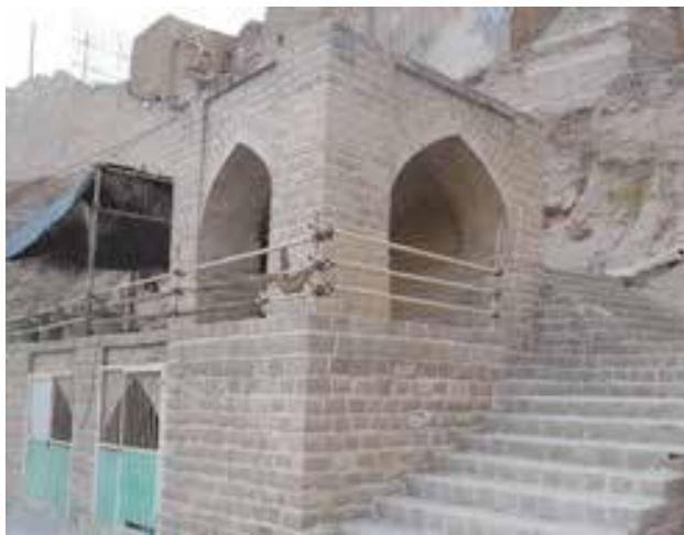
تصویر ۲. نمایی از چارطاقی. عکس: زهرا نادعلیپور، ۱۳۹۳.

بدون شک در شکل‌گیری این مجموعه منحصر به فرد علاوه بر تفکر و آراء تعدادی از صاحب نظران، آداب و رسوم مردمانی که در این خطه زندگی می‌کرده‌اند بی‌تأثیر نبوده‌است، چنانکه علاوه بر فنون آبیاری سیار پیشرفته در این مجموعه، با نمونه‌هایی از مسایل فرهنگی نیز روبرو هستیم که از جمله می‌توان به چارطاقی‌های موجود اشاره نمود. مسئله دیگری که قابل ذکر است، معماری برون‌گرای برخی منازل مشرف به مجموعه است که با فرهنگ ایرانیان سنخیت نداشته، چرا که ایرانیان به حفظ حریم معماری درون‌گرا را داراست. بدون شک این نوع معماری صرفاً جهت استفاده از چشم‌انداز طبیعی مجموعه، پیاده شده‌است. همچنین «کرزن» در کتاب خویش تحت عنوان «ایران و قضیه ایرانیان»، آبشارهای شوشتر را تا حدودی مشابه با آبشارهای هوراتی در تیرولی (ایتالیا) می‌داند (تصویر ۲).