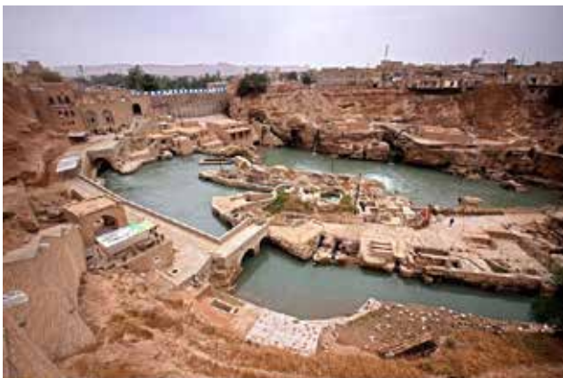
تصویر ۱. نمایی از مجموعه آسیاب‌های آبی شوشتر. عکس: میلاد معصومی، ۱۳۹۲.

دیدگاهی گردشگری را به عنوان مصرف‌کننده می‌بیند، در حالی که امروزه گردشگری می‌بایست وسیله‌ای باشد برای حفظ و نگه‌داشت میراث‌های طبیعی و فرهنگی در جهت نیل به اهداف توسعه پایدار.