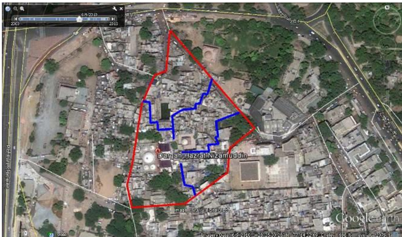
تصویر ۲. فضاهای هم‌جوار (مقبره‌ها و مسجد - بافت مسکونی - مسیر دسترسی و بازار) مأخذ: هدا کاملی.

منطقه نظام‌الدین یکی از مناطق قدیمی شهر دهلی است که امروزه به وسیله خیابان متوراً به دو قسمت شرقی و غربی تقسیم شده است. قسمت شرقی محل مقبره همایون، ایستگاه قطار و منطقه سطح بالای شهر قرار دارد. قسمت غربی، محل قرارگیری مقبره نظام‌الدین و دیگر فضاهای همراه آن است. در نقشه زیر محوطه و بافت قدیمی بازار و مجموعه مقبره‌ها که مشخصاً به وسیله خیابان‌های جدید احاطه شده‌اند نمایان است (تصویر ۲). اجتماع مردم در مراسم قوالی مانند یک کنسرت حول اجرای موسیقی و خواندن شعر توسط گروه صوفیان صورت می‌گیرد. این گروه، بر روی زمین خارج از ساختمان مقبره‌ها رو به جهت مقبره می‌نشینند. در حین انجام مراسم، جمعیت زیادی برای دیدن و