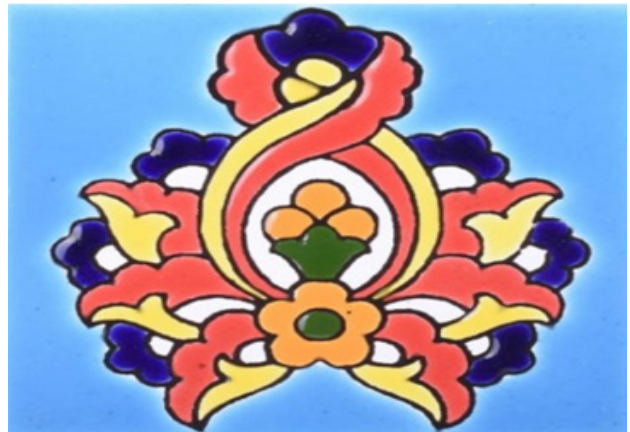
تصویر ۲. نماد گل انار در تزیینات معماری و کاشی کاری ایران.

کاشی کاری که در هنر سنتی ترکیه از اهمیت زیادی برخوردار است، طی چندین قرن توسعه یافته و به طور گسترده در تزیین معماری بسیاری از آثار ترکی، بناهای تاریخی و همچنین سایر ایالت‌های آسیا استفاده می‌شود (تصویر ۵).