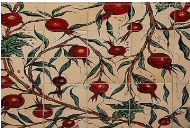
تصویر ۱. انار نمادی آشنا و مقدس.

در فرهنگ ایرانی، انار را از جنس مؤنث می‌دانستند که رمز و نشانه جاودانگی و باروری و به‌آنهایتا ایزدانوی آب‌های پاک و مطهر، زایش و فراوانی منسوب بوده است. گل انار از نمادهای تزیینی در معماری ایران باستان بوده، که بیشتر در کاخ‌های هخامنشی برای آراستن دیوارها و