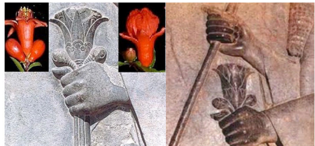
تصویر ۳. گل و غنچه انار، سنگ نگاره‌های تخت جمشید.

دیوارهای اتاق تا گنبد با چینی کاشی پوشیده شده است. روی زمین سفید، گل‌های انار به شکل دایره و همچنین ابرهای چینی به رنگ سبز و قرمز دیده می‌شود. در نیمه دوم قرن ۱۶ م. چینی طرح‌هایی بسیار رایج بود. ترکیبات شامل گل‌های بهاری و شکوفه‌ها بر شاخه‌های روی دیواره‌های اتاقک است (تصویر ۹). جلوی اتاق ختنه کاخ که مربوط به سال ۱۰۱۸ است نیز با کاشی‌های مشابه تزیین شده است. نگارگران دربار در آن زمان ابتدا طرح را بر کاشی پیاده کرده سپس با