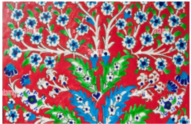
تصویر ۹. نمونه گل‌های بهاری و شکوفه‌ها در کاشی کاری.

همانگی با سایر ویژگی‌های معماری و نورپردازی، طرح‌ها را با توجه به مکانی که اثر در آن قرار می‌گیرد انتخاب می‌کردند (تصویر ۱۰). در منابع به گل لاله وحشی بومی ترکیه اشاره شده است، ولی این گل‌های درشت آبی شبیه گل انار و گل برگ چناری ایرانی است، که هیچ شباهت و نسبتی با لاله ندارد و به احتمال زیاد برگرفته از نقوش ایرانی باشد (تصویر ۱۱).