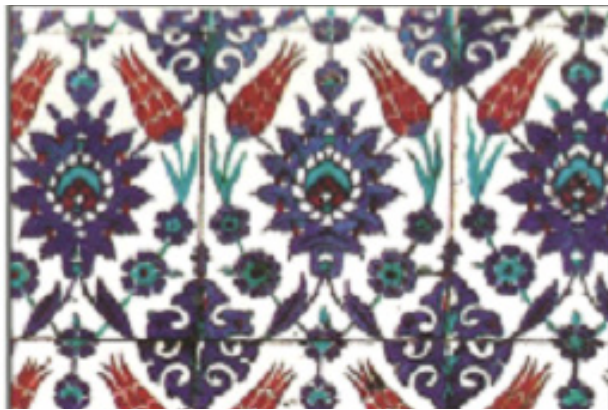
تصویر ۱۱. لاله‌های قرمز، گل‌های اناری و گل چندپر آبی بر زمینه سفید ترکیه عثمانی.