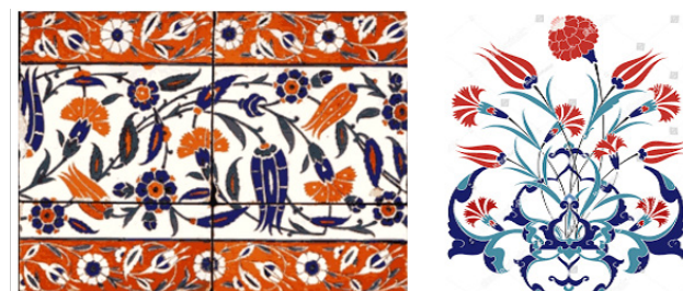
تصویر ۵. گل‌های لاله و میخک بر کاشی کاری عثمانی. مأخذ: فریه، ۱۳۷۴.

در دوره بعد از عثمانی، به ویژه زمانی که امپراتوری در مرحله توسعه خود بود، هنر کاشی به طور مداوم با استفاده از بسیاری از تکنیک‌های بدیع معرفی شده در آن زمان بهبود یافت و این هنر پس از زوال کیفیت هنر و زوال امپراتوری عثمانی سال‌ها بعد نیز تداوم یافت.