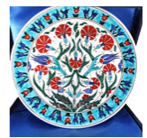
تصویر ۷. نقش لاله، گل‌های پُرپر سرخ و شکوفه‌های سفید بر بشقاب‌های سرامیک ترکیه عثمانی.