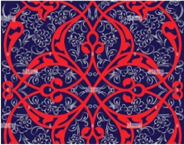
تصویر ۸. اسلیمی‌های قرمز رنگ، گل چهارپر، گل‌های انار سفید رنگ روی زمینه لاجوردی. مأخذ: Watson, 1998, 453.