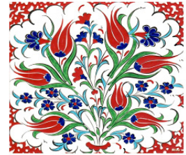
تصویر ۶. ترکیب گل‌های سنبل، لاله در ترکیه عثمانی.