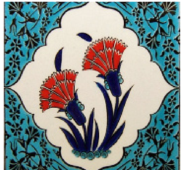
تصویر ۱۰. نمونه گل میخک در کاشی کاری. مأخذ: قاسمی و شیرازی، ۱۳۹۱، ۵۳.

این پژوهش به بررسی انار که از قدیمی‌ترین میوه‌های شناخته شده برای بشر بوده است می‌پردازد، که این میوه در آغاز عصر کشاورزی به صورت وحشی می‌روید و بعدها از اولین میوه‌های کشت شده به دست بشر به شمار می‌آید. شواهد باستان‌شناسی حاکی از وجود نقش انار بر روی سفالینه‌های هزاره‌های چهارم و سوم پیش از میلاد است. انار از مقدس‌ترین درختان است که تقدس خود را تا امروز در