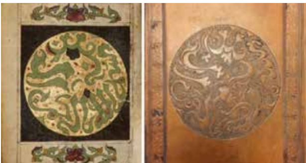
تصویر ۱۴. جلد چرمی و صفحه اول قرآن شماره دوازده.