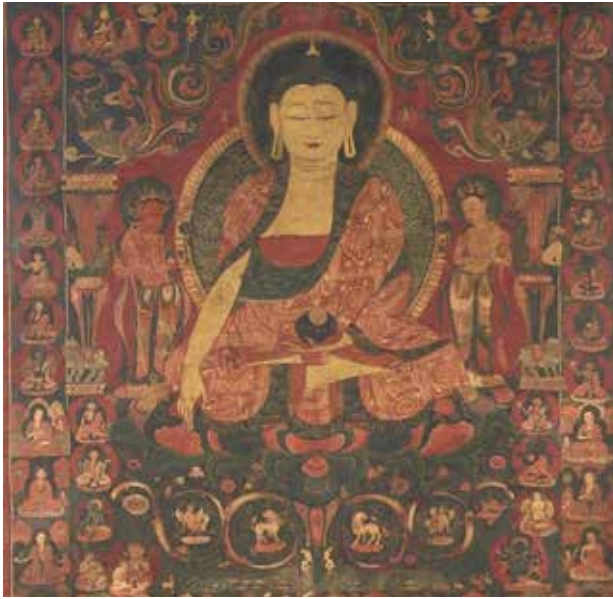
تصویر ۱۳. تصویر بودا در میان شعله آتش، نقاشی روی پارچه، قرن پانزدهم میلادی.