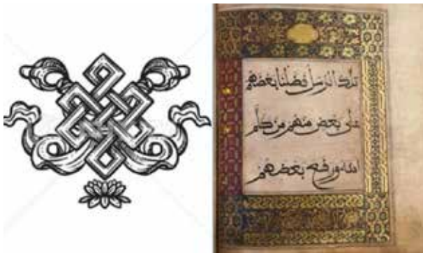
الف: الف: قرآن شماره شش. مأخذ: www.bl.uk . ب: گره جاودانی، مأخذ: www.symbolsarchive.com .