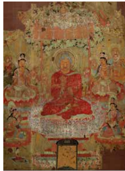
تصویر ۹. بودا آیین را فرا می‌آموزد، آب‌مربک و رنگ روی حریر، اوایل قرن هشتم.