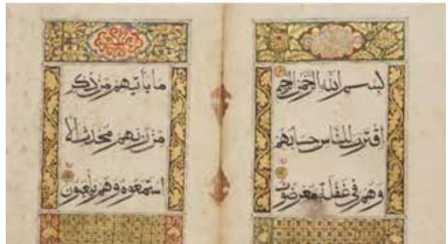
تصویر ۵. سه جزء مختلف از یک قرآن، قرن هجدهم میلادی.