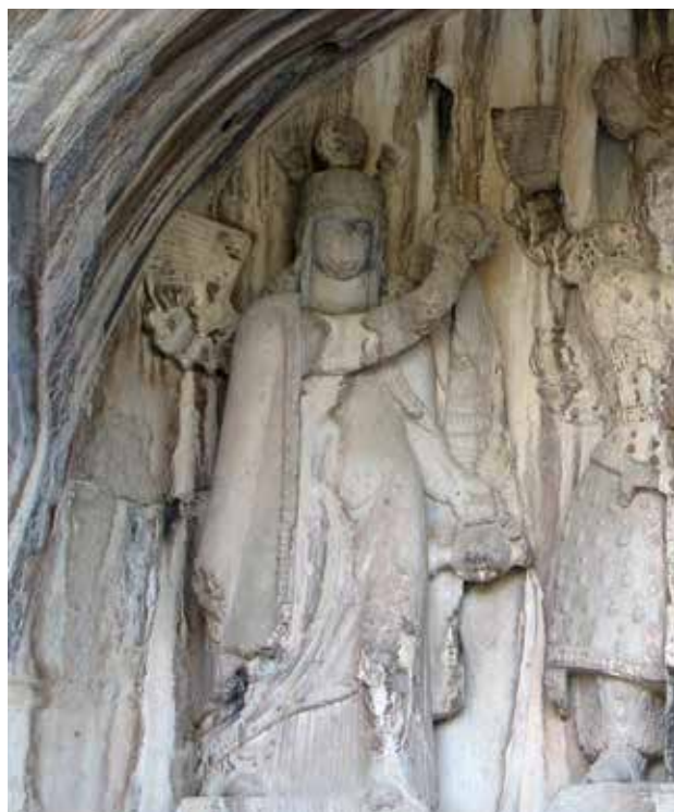
تصویر ۹. اناهیتا، ایزدبانوی باروری و نگهبان آب‌های روان با کوزه آب، تاجی از مروارید و هلال ماه، عکس: سید امیر منصوری، آرشیو پژوهشکده نظر، ۱۳۹۲.

نیایشگاه اناهیتا در بیشاپور و در جوار مجموعه کاخ‌های ساسانی، نمونه‌ای عظیم و پرابهت از معابد آب است (تصویر ۱۵). این معبد با نمادهای حوض، آب و مجسمه‌های نیم‌تنه گاو که تصویر آن بر آب نمایان است؛ یکی از زیباترین جلوه‌های آیینی و نمادین معبد اناهیتا را به نمایش می‌گذارد. شاهان ساسانی موظف بودند سالانه در زمان برداشت محصول، برای الهه باروری طی مراسمی رسمی و باشکوه پیشکش و قربانی عرضه دارند؛ تا سال پربرکت را برای مردم کشاورز و مملکت رقم زنند. هنگامی که خشکسالی به‌وجود می‌آمد، مردم به دادخواهی نزد شاه می‌آمدند و تقاضای قربانی بیشتر می‌کردند و شاه را مسئول دانسته که شاید به‌قدر کافی به معبد و الهه احترام و تکریم نشده است. مردم نیز به نوبه خود در مکان‌های خاص در ارتباط با آب، درخت و گاه معابد کوچک محلی به نیایش پرداخته و متوسل به ایزدبانوی آب‌ها، باروری و برکت می‌شدند. بسیاری از این مکان‌ها و عناصر طبیعی چون آب و درخت امروز برجاست که یادگارهایی از نیایش اناهیتا بوده و به‌گونه‌ای با آیین و باور جدید آمیخته و با بزرگان و مقدسین در فرهنگ و تفکر اسلامی گره خورده است. هم‌چنان مردم به این اماکن روی می‌آوردند.