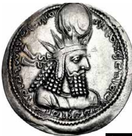
تصویر ۵ ب

تصاویر ۵. الف: شعاع نور از نمادهای مهر، نقش برجسته میترا، تاق بستان. ب: سکه ساسانی (خسرو دوم)، پ: بهرام اول. مأخذ: امینی، ۱۳۸۵: ۳۶۳، ۲۵۴.