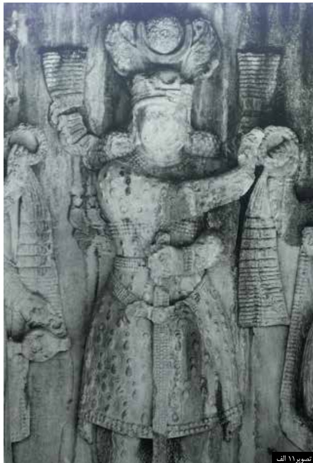
تصویر ۱۱ الف

تصویر ۱۱. الف: لباس خسرو پرویز، با مرواریدهایی به شکل قطره آب، عکس: سید امیر منصوری، آرشیو پژوهشکده نظر، ۱۳۹۲. ب: تاج اناهیتا مزین به شکوفه‌های گل و مروارید. عکس: سید امیر منصوری، آرشیو پژوهشکده نظر، ۱۳۹۲.