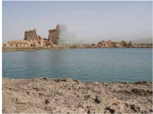
تصویر ۶. چارتاقی، آتشکده شیز، تخت سلیمان، عکس سید امیر منصوری، آرشیو پژوهشکده نظر، ۱۳۹۲.

اردشیر در فیروزآباد، روی تپه و مشرف به چشمه‌ای جوشان، اثری منحصر به فرد است که ترکیبی از معماری پارت و ساسانی را نشان می‌دهد (تصویر ۷). بقایای سه تالار با گنبد، متعلق به دوره ساسانی بوده و ایوان و حیاط، به شیوه معماری اشکانی است که در دشت وسیعی قرار دارد و همچون دیگر بناهای این عصر در ارتباط با چشمه و آب بوده؛ به گونه‌ای که تصویر بنا که آتشکده، کاخ یا اقامتگاه موقت شکارگاه بوده در آب منعکس می‌شود. تصویر غار معبد ۱ تاق‌بستان (تصویر ۸) با سنگ‌نگاره‌های باشکوه در دل صخره‌های عظیم، بر نهر جاری از چشمه منعکس شده است. این مکان یکی از مشهورترین پردیس‌های ساسانی است که به شکارگاه خسرو پرویز مشهور است. سنگ‌نگاره‌های موجود در این مکان اشاراتی به دین و باورهای این عصر دارد. نقش تاجگذاری خسرو پرویز، حضور اهورامزدا و اناهیتا و تاج‌گیری اردشیر دوم از اهورامزدا، حضور میترا نشانه‌های آشکاری را در ارتباط با عناصر استوره‌ای طبیعت نشان می‌دهند.