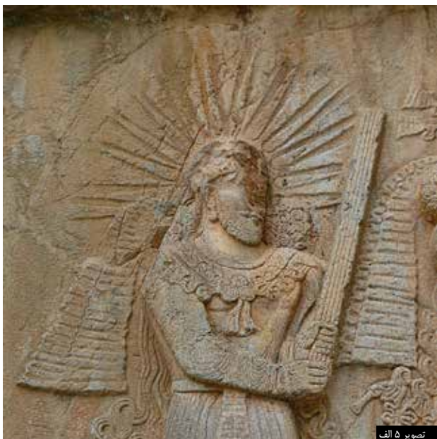
تصویر ۵ الف

در ارتباط با آب و ایزد بانو اناهیتاست. پارچه‌های ابریشمی و زربفت این دوره نیز به انواع نقش‌های برگرفته از طبیعت و باورهای طبیعت‌گرا مزین است (تصویر ۴).