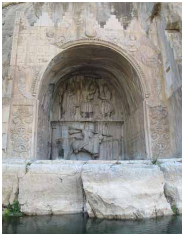
تصویر ۸. تاق بستان، شکارگاه خسرو پرویز، غار معبد احتمالاً در ارتباط با مهر و اناهیتا، عکس: سید امیر منصوری، آرشیو پژوهشکده نظر، ۱۳۹۲.

نزدیکی این مکان وجود دارد که نشان می‌دهد از گذشته تاکنون مکانی محترم بوده و مجاورت آن با آب ارتباط با اناهیتا، الهه باروری و نگهبان آب‌ها را آشکار می‌سازد. از این مکان با تعلق به دوران اشکانی - ساسانی به‌عنوان شکارگاه نیز یاد شده است. البته مغایرتی بین شکارگاه و نیایشگاه نیست؛ زیرا در زمان ساسانی هردو در کنار هم وجود داشته‌اند. چنان‌که تاق بستان، شکارگاه خسرو پرویز در کرمانشاه از پردیس‌های ساسانی بوده و آثاری بارز از غارهای مزین به نقش اناهیتا و هم‌چنین نقش برجسته مهر یا میترا در آن دیده می‌شود.