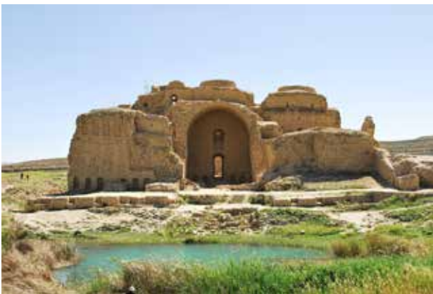
تصویر ۷. کاخ اردشیر، فارس، عکس: فرنوش پورصفوی، آرشیو پژوهشکده نظر، ۱۳۸۸.

اناهیتا ایزدانوی باروری، برکت و حافظ آب‌های روان با نمادهای منظرین طبیعی مانند مروارید، کوزه آب و هلال ماه (تصویر ۹) و ایزد مهر (میترا) با نماد تاج خورشید و نیلوفر آبی دیده می‌شود (تصویر ۱۰). بر تاج و لباس شاهان و ایزدان نیز نقش مروارید، غنچه و شکوفه‌های گل، ماه و خورشید و ستارگان دیده می‌شود (تصویر ۱۱). نقش برجسته‌های تنگ‌چوگان بر سینه صخره‌های عظیم و مشرف بر رودخانه شاپور (تصویر ۱۲)، شامل پنج ردیف نقش در سمت چپ رودخانه است که پیروزی‌های شاپور بر امپراتوران روم را نشان می‌دهد و سمت راست رودخانه، نقشی دیگر از صحنه‌های پیروزی شاه بر رومیان است که به شیوه دیگر سنگ‌نگاره‌های ساسانی بر بلندای صخره‌های عظیم و در جوار آب برپا شده است. صفة