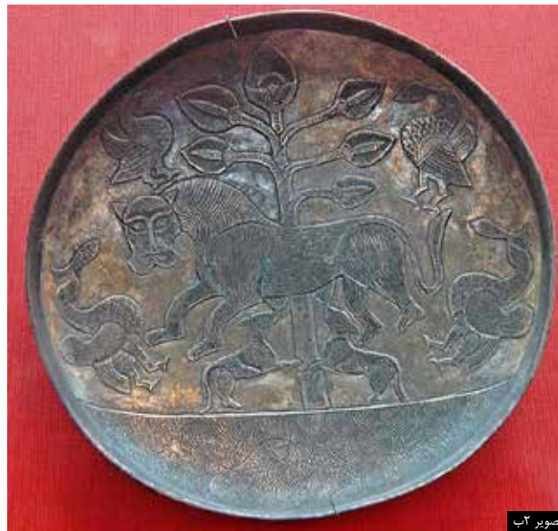
تصویر ۲ ب