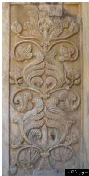
تصویر ۲ الف