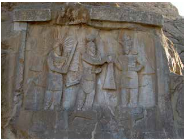
تصویر ۱۰. مهر با تاج خورشید بر نیلوفر آبی، عکس: سید امیر منصوری، آرشیو پژوهشکده نظر، ۱۳۹۲.