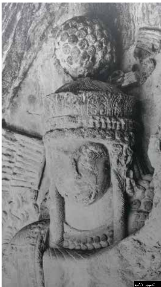
تصویر ۱۱ ب