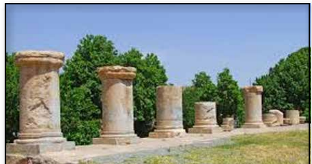
تصویر ۱۴. معبد اناهیتا، کنگاور، عکس : سید امیر منصوری، آرشیو پژوهشکده نظر، ۱۳۹۲.