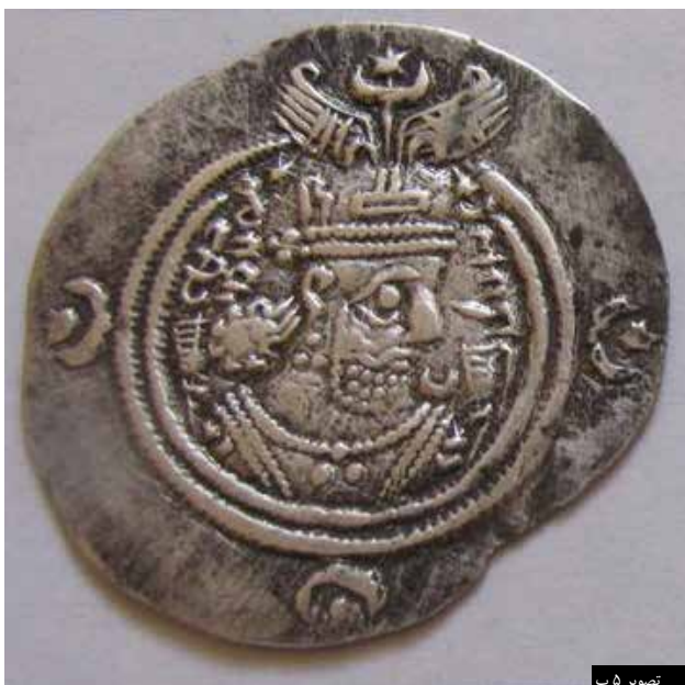
تصویر ۵ ب