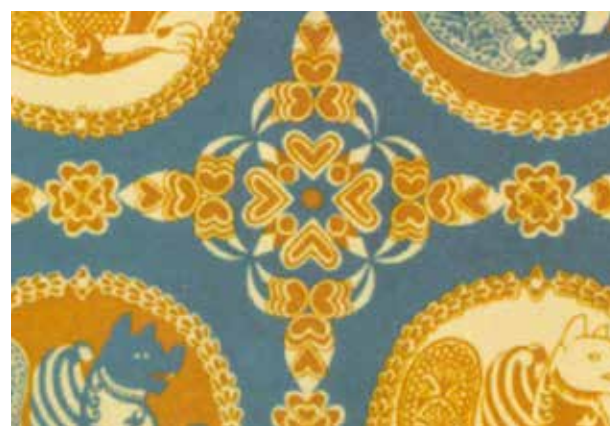
تصویر ۴. انواع نقش‌های گل و بوته برگرفته از طبیعت در هنر ساسانی، مأخذ: ریاضی، ۱۳۸۲.

تصاویر ۵. الف: شعاع نور از نمادهای مهر، نقش برجسته میترا، تاق بستان. ب: سکه ساسانی (خسرو دوم)، پ: بهرام اول. مأخذ: امینی، ۱۳۸۵: ۳۶۳، ۲۵۴.