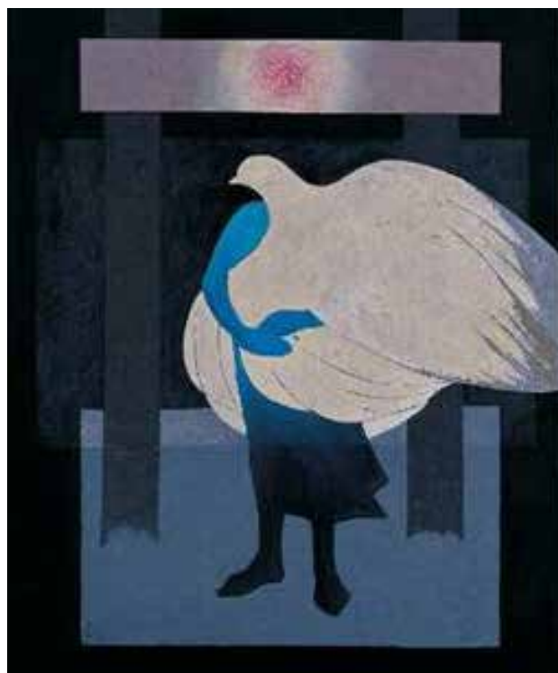
تصویر ۹. رهایی، ۱۳۷۹.