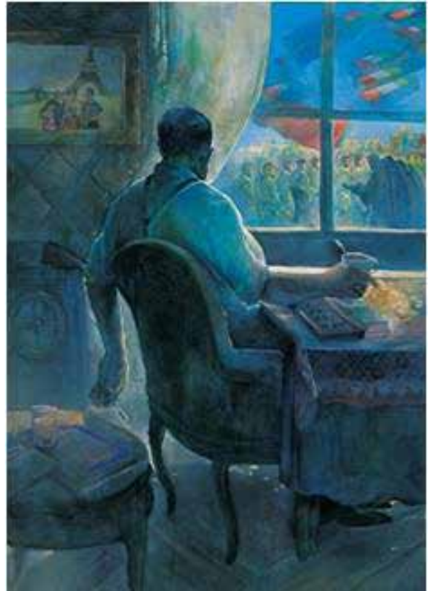
تصویر ۷. غریبه، ۱۳۷۶.

از نمونه نقاشی دهه سوم می‌توان به تابلوی «خرمشهر» اشاره کرد (تصویر ۱۴). تابلوی خرمشهر به جز اندک کرشمه‌هایی از