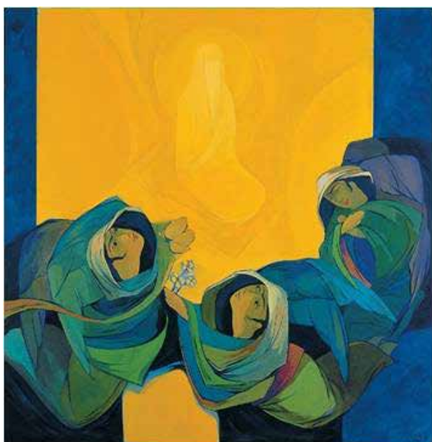
تصویر ۱۲. مادر مهربان، ۱۳۸۹.