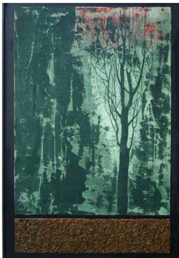
تصویر ۱۰. بدون عنوان، ۱۳۸۸.