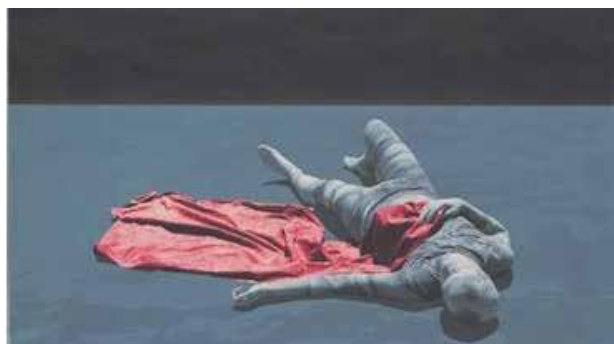
تصویر ۶. ماتادور، ۱۳۸۳.

و انقلابیون، مرد و زن، پشت سر رهبر و پیر و مرادشان و در سوی دیگر، شکست و ویرانی ظلمت و سیاهی و واژگونی کاخ ستم را شاهد هستیم.