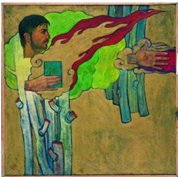
تصویر ۱۱. انقلاب اسلامی، ۱۳۷۷.

سرخ‌چی که نشان از شهادت رزمنده دارد، اثری از رنگ در این اثر نیست و گویا هنرمند خواسته رویایی را به تصویر بکشد از فرمانده‌ای بزرگ (با توجه به قامت و تجهیزات) که به مسجد خرمشهر (نماد ایستادگی و آزادی) می‌نگرد و یادآور سرود جاودانه‌ای که در رثای فرمانده‌ای جاودان زمزمه لب‌های بسیاری از قهرمانان دفاع مقدس بوده است: «ممد نبودی ببینی...» و اینجا هنرمند نقاش نشان می‌دهد که «ممد» بوده و دیده