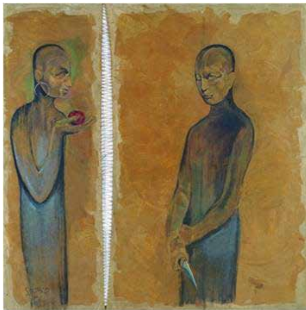
تصویر ۵. فاصله، ۱۳۷۲.

گودرزی از نسل دوم نقاشان انقلاب که با بهره‌گیری از نقاشی سنتی ایران و حال و هوای نقاشی مدرن اروپایی، آثاری متفاوت خلق کرده است. این شیوه متأثر از تجربیات دوران دانشجویی