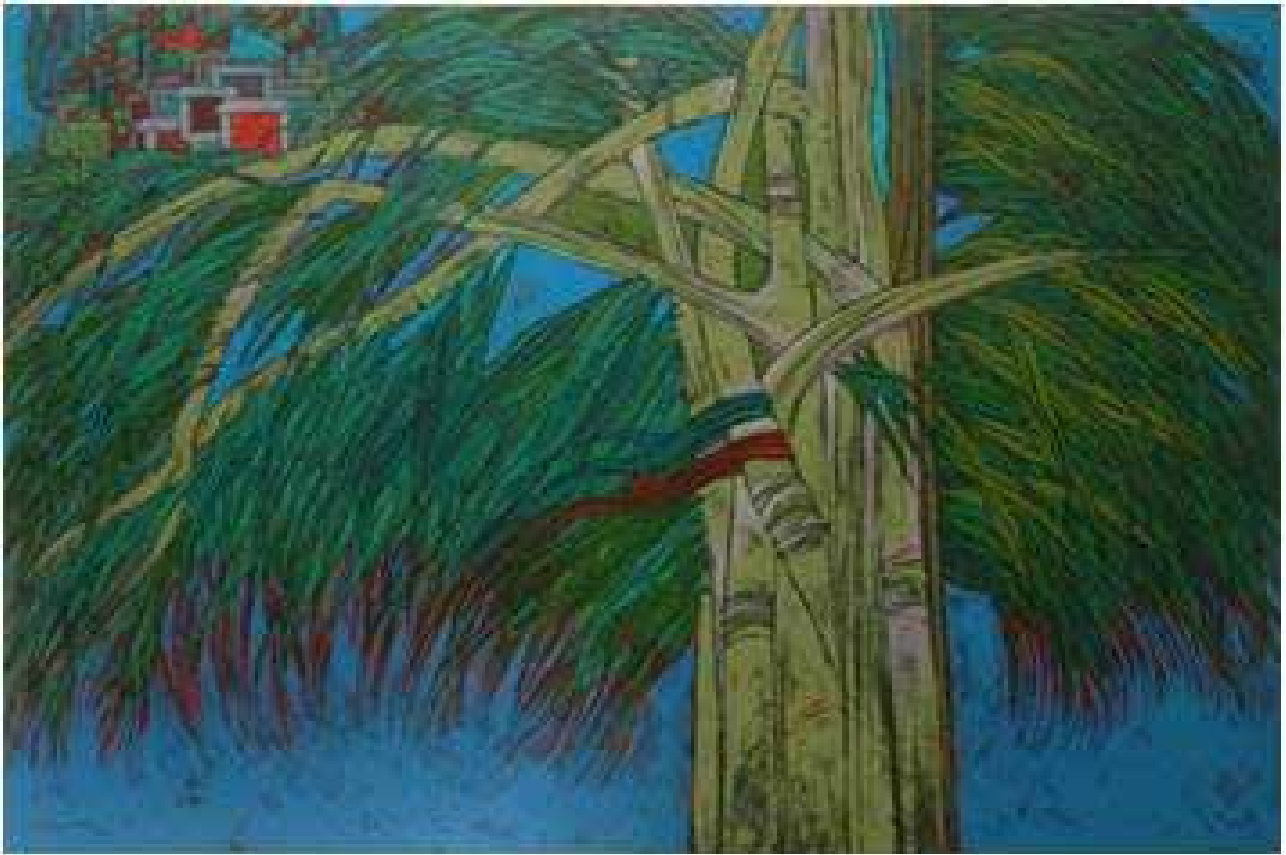
تصویر ۱۳. در آسمان، ۱۳۷۶.

دهه‌های دوم و سوم، مانند سایر نقاشان بیانی تمثیلی و گاه به نوعی انتزاع رسیده است. الهام از اندام‌های کشیده‌ال گرکو و پیچ و تاب در فرم و رنگ و تأثیرات هنر مذهبی بیزانس، از ویژگی‌های آثار او است.