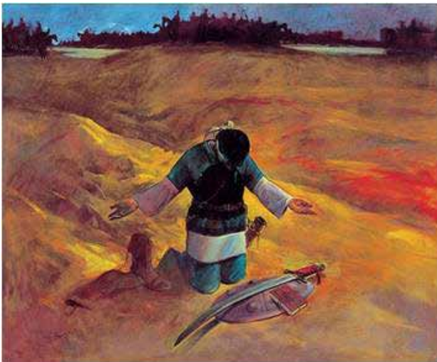
تصویر ۳. توبه حر، ۱۳۷۵.

برای ادای دین و تکلیف رهسپار جبهه‌های حق علیه باطل است که خانواده‌ها به استقبالشان آمده و تابوت‌ها، زورق‌هایی از جنس بال فرشتگان که از زمین به سوی آسمان به پرواز در آمده‌اند. از نمونه نقاشی دهه سوم می‌توان به تصویر ۸ اشاره کرد. آنچه در این اثر بیش از هر چیز جلب نظر می‌کند، آرامش و خرسندی در چهره حضرت امام است که گویا نقاش همه هنر خویش را معطوف جلوه‌گرساختن این امر با عبارت مشهور در وصیت‌نامه قائد اعظم: «با دلی آرام و قلبی مطمئن ...» نموده است. در اثر مذکور، چونان دیگر کارهای صادقی، نبرد خیر و شر نیز به چشم می‌آید؛ یک سوی تصویر، رزمندگان