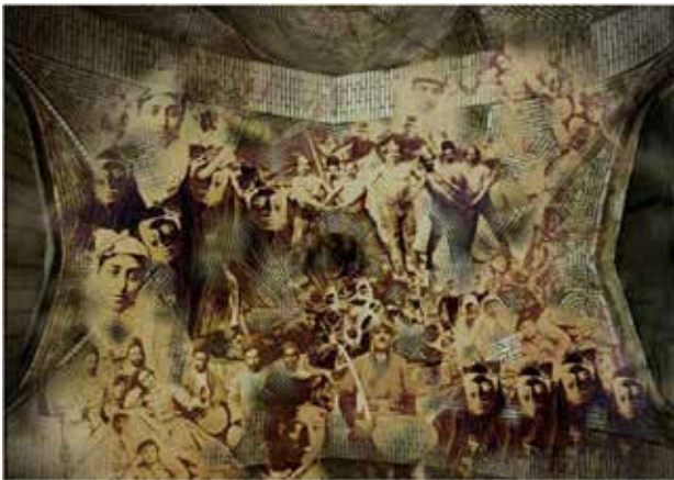
تصویر ۲. بدون عنوان، ۱۳۸۸.

اربعین درباره این اثر گفت: نام تابلو توبه حرّ است که در آثار مذهبی و یا خیالی‌نگاری قهوه‌خانه‌ای، موضوع توبه حرّ از جایگاه ویژه‌ای برخوردار است. این اثر لحظه‌ای را به نمایش می‌گذارد که حرّ پس از صحبتی که سیدالشهدا با وی دارد و انقلابی درونی را در او رقم می‌زند، حالا نزد امام حسین (ع) بازگشته تا توبه کند. در این اثر مخاطب در کنار امام ایستاده و حر را نگاه می‌کند و به نوعی شاهد تاریخ پر ماجرای حق و حقیقت است.