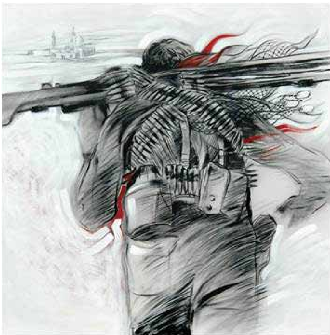
تصویر ۱۴. خرمشهر، ۱۳۸۷.

نیست. اما می‌توان به جرأت ادعا نمود که دستاورد هنرهای تجسمی در گذر سال‌های انقلاب و دفاع مقدس، گرچه سبک و مکتب ویژه‌ای نداشته اما علی‌رغم تأثیرپذیری و گاه تقلید بیانگر هنری با حال و هوای ایرانی و انقلابی است که ارزش‌های اسلامی را نیز در خود دارد.