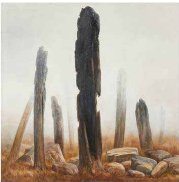
تصویر ۴. باغ سوخته، ۱۳۸۷.

ایشان جلب نظر می‌کند، عدم حضور انسان در بسیاری از آنهاست. به‌ویژه برخلاف دهه نخست، دیگر خبری از انبوه مردم در این آثار مشاهده نمی‌شود ( تصویر ۴ ).