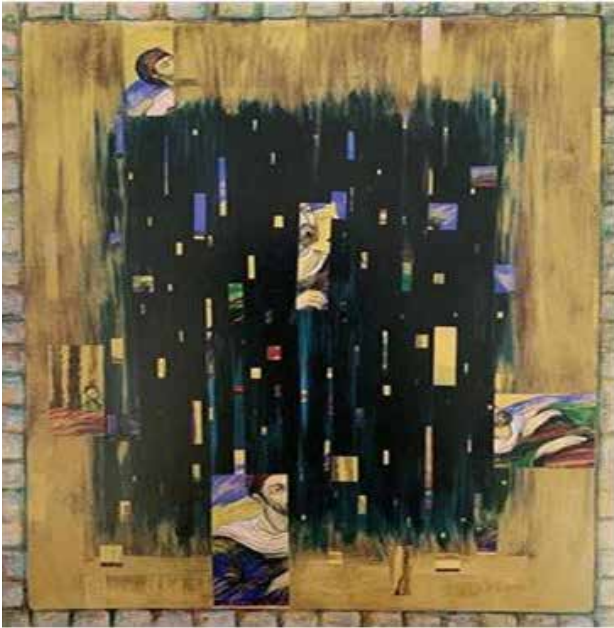
تصویر ۱. برادرانم، ۱۳۷۴.