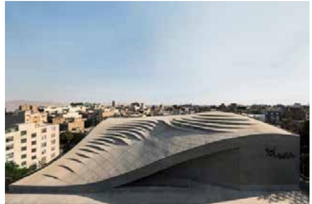
تصویر ۵. مسجد ولیعصر، ایران. مأخذ: Archline.ir

جدول ۱. مقایسه و تحلیل پنج مسجد معاصر مورد مطالعه. مأخذ: نگارنده.