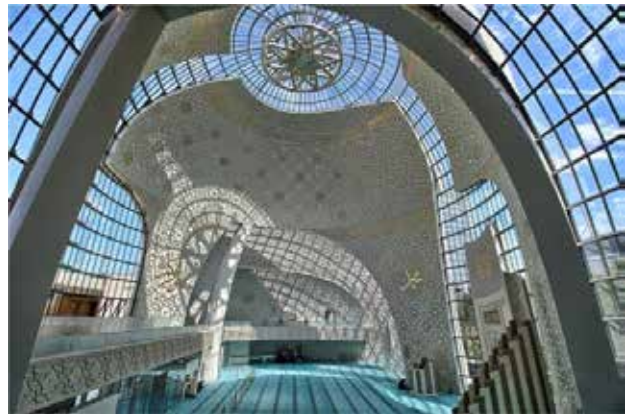
تصویر ۴. مسجد جامع کلن، آلمان.