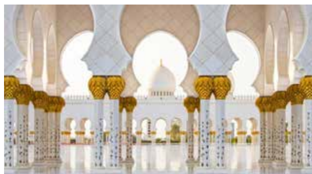
تصویر ۳. مسجد شیخ زاید بن سلطان، امارات.