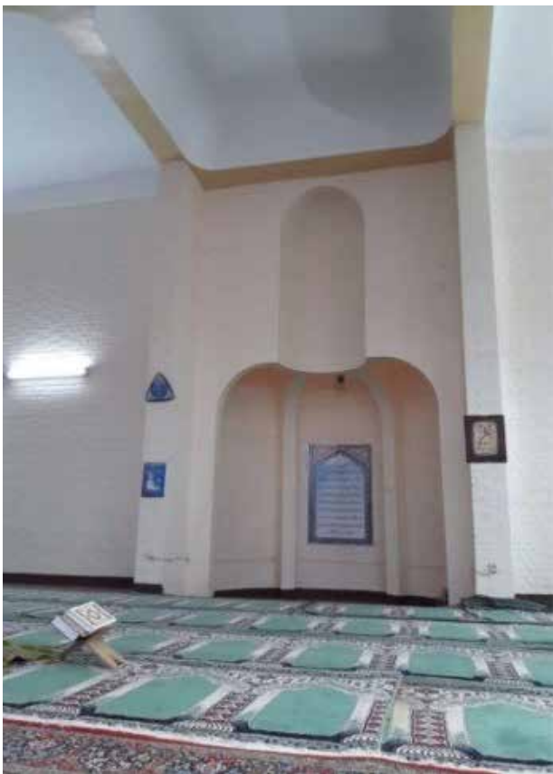
تصویر ۱. مسجد دانشگاه جندی شاپور، ایران.

سنتی معماری مساجد دارند و از دستاوردهای غنی معماری تاریخی در طراحی خویش استفاده می‌کنند. یکی از اهداف اصلی رویکرد سنت‌گرا احیاء و همچنین حفظ دستاوردهای معماری سنتی است (همان).