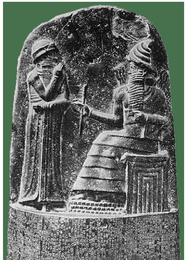
تصویر ۱۳. ایزد خورشید شمش، بین‌النهرین.

مهر پس از پایان رسالت خویش که آگاهی و تبلیغ دین خویش است سوار بر اریه چهار اسبه به آسمان می‌رود و روز واپسین برای شفاعت پیروان به این جهان باز می‌گردد. همان گونه که مسیح (ع) پس از شام آخر با یاران خویش، عروج کرد و روز قیامت جهت شفاعت یاران باز می‌گردد. در یونان و ایتالیا کیش مهر گاه با عرفان گنوسی شرقی آمیخته است.