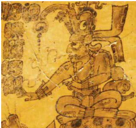
تصویر ۱۲. ج) کینچ آهانو خدای خورشید در اساطیر قوم مایا.