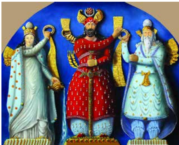
تصویر ۱۴. انتصاب اردشیر دوم به پادشاهی؛ از چپ به راست: میترا، شاپور دوم، اهورا مزدا. پایین: زولیان امپراطور روم، طاق بستان. مأخذ: جوادی و آوزرمانی، ۱۳۹۵، ۷۳.