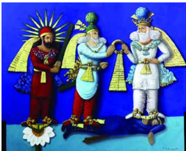
تصویر ۱۵. تاج‌گیری اردشیر دوم از اهورا مزدا با حضور میترا، طاق بستان.

از روستایی به روستای دیگر می‌روند تا باروری و حاصل‌خیزی زمین را در سال آینده تأمین کنند. در اروپا نیز مراسم چون غلطاندن چرخ‌های مشتعل به مناسبت انقلاب شمسی و مراسم مشابه دیگر همچون بازسازی جادویی قوای خورشیدی وجود دارد. مکزیکیان با قربانی کردن اسرا برای خورشید پایندگی را تأمین می‌کردند چون می‌پنداشتند که خودشان ضامن تجدید و نوشدن انرژی پایان‌یافته اختر روز خواهند شد. این قهرمانان خورشیدی را نزد شبانان آفریقایی، اقوام ترک، مغول و یهود شمشون (samson) و در میان ملل هند و اروپایی مشاهده می‌کنیم (همان، ۱۵۳)؛ (تصویر ۱۶).