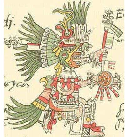
تصویر ۱۲. الف) خدای خورشید از تک-خورشید عقاب (یا مرغ مگس خوار) - اویتسیلوپوچتلی، طرحی در مستندات تلریانو-رمنسیس.

و غرب عالم شاهد هستیم. به نظر می‌رسد دلیل برتری مهر - میترا اسطوره خورشید آریایی، در ایران ایزد ایزدان، دارای تمامی صفات خیر و نماد نور و فروغ خورشید بوده است، از این رو با سایر خورشید خداه‌ها و خدایان پرستی دیگر اقوام متفاوت است. مهر ایرانی یار و یاور جنگجویان راستین است که از وطن دفاع می‌کند، خدای عهد و پیمان و مظهر نور ایزدی است.