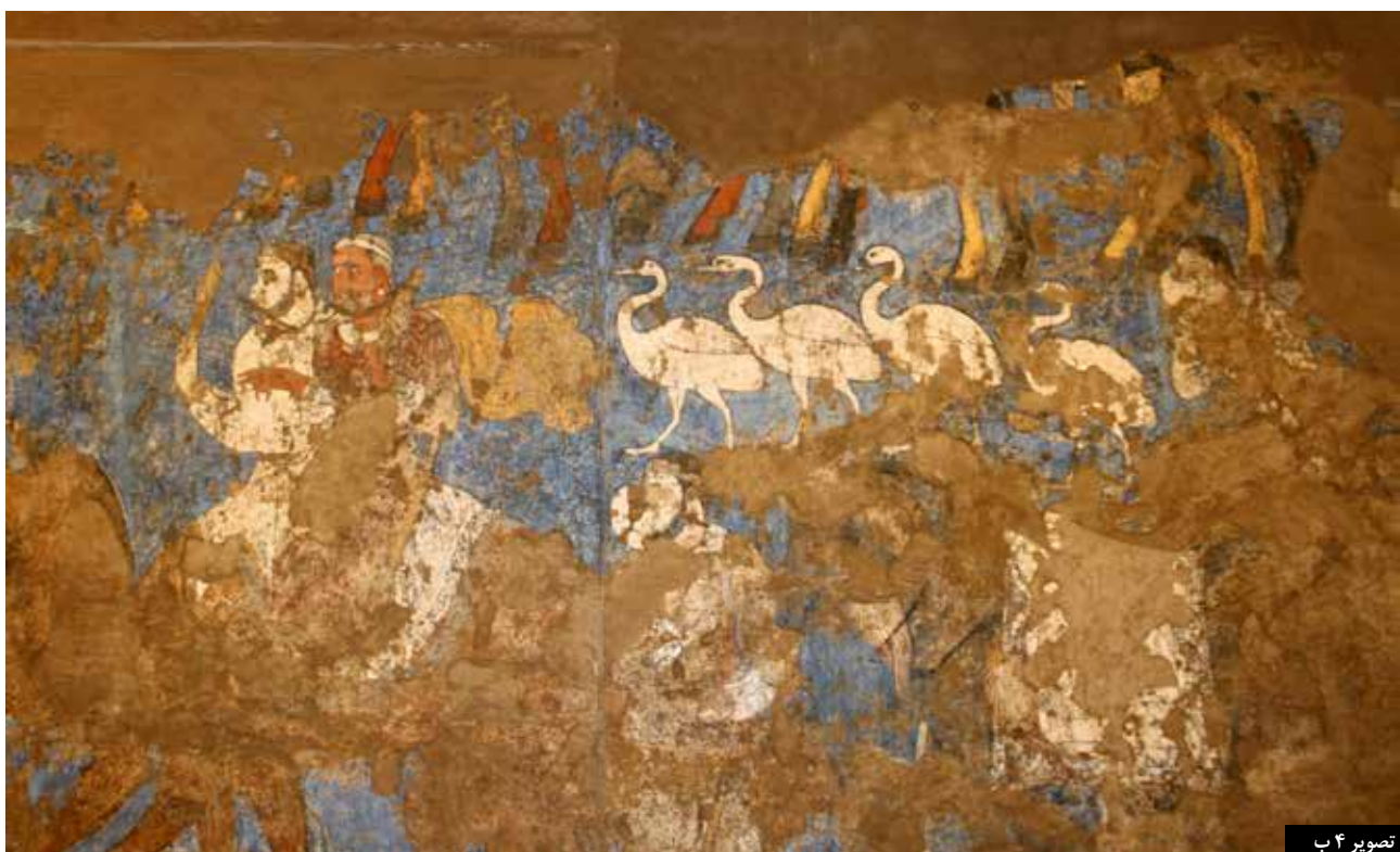
تصویر ۴. نقاشی‌های دیواری شهر افراسیاب، سمرقند.