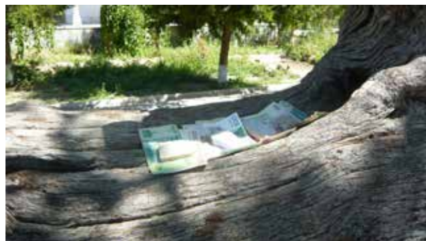
تصویر ۱. درخت مقدس زیارتگاه نقشبند، بخارا، ازبکستان، عکس: شهره جوادی، سفر اکتشافی آسیای میانه، تابستان ۱۳۸۹.