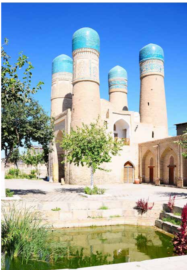
تصویر ۲. مدرسه چهار منار، بخارا، ازبکستان، عکس: محمد عسکرزاده، سفر اکتشافی آسیای میانه، تابستان ۱۳۸۹.

این تغییرات، سبک تزیینی پاگرفته، و در قرن پنجم رفته رفته هنر و فرهنگ در آسیای مرکزی با توجه به وجود اقوام مختلف ساکن منطقه و تأثیرپذیری آنان از کشورهای همسایه، ویژگی‌های خاصی پیدا می‌کند. همجواری بناهای مذهبی مانند مسجد، مدرسه، خانقاه، صومعه یا استراحتگاه درواش و مسافران، بناهای غیرمذهبی همچون منازل مسکونی، کاخ، کاروانسرا، بازار و بناهایی با کاربرد بینابین مجموعه‌های مذهبی و غیرمذهبی مانند آرامگاه، منظر بی‌همتا به شهرهای قرون میانه در آسیای مرکزی بخشیده است. چشمگیرترین این مجتمع‌ها در خیوه و بخارا واقع شده‌اند (پوگاخپکو و خاکیموف، ۱۳۷۲: ۳). شهر باستانی خیوه با بناهای خشتی و آجری و تزیینات کاشی، محصور در قلعه باستانی، شکوه گذشته را حفظ کرده و نشان‌دهنده سنت و شهر درونگرایی کهن ایرانی - اسلامی است (تصویر ۳).