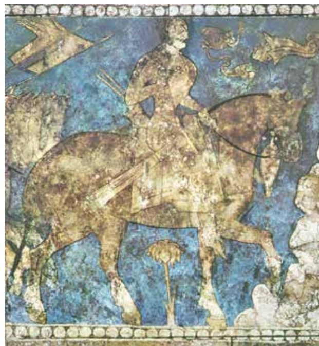
تصویر ۶. رستم به جنگ دیو می‌رود، بخشی از نقاشی دیواری پنجکنت، قرن هفتم میلادی، موزه ارمیتاژ، لنینگراد.