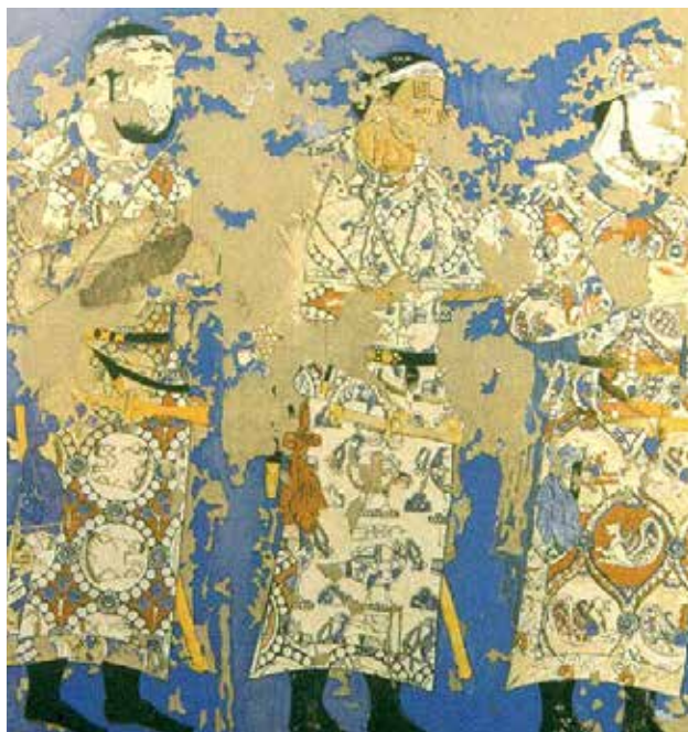
تصویر ۷. بخشی از نقاشی دیواری، جشن بهار یا نوروز، پنجکنت، تاجیکستان.

به احتمال زیاد در معابدی که وقف همین آیین بوده به دست آمده‌اند. از موضوعات دیوارنگاری به سوگ سیاوش و تولد او در بهار، نوروز نمادین، رستم و اژدها، بازی شطرنج