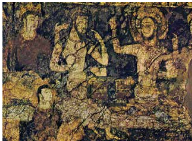
تصویر ۵. بخشی از نقاشی دیواری افرادی در حال بازی تخته نرد، پنجکنت، تاجیکستان.

چند قطعه از این دیوارنگاری‌ها در موزه ملی دوشنبه موجود است که شباهت بسیار به نقاشی‌های کوه خواجه سیستان و دیوارنگاری‌های بودایی در غارمعددهای آجاتا در هند دارد. رنگ‌های بکار رفته در تمامی آثار مذکور شامل طلایی، آبی لاجوردی، قرمز، سفید، سیاه و بعضاً سبز است که از مواد معدنی و گیاهی تهیه می‌شدند.