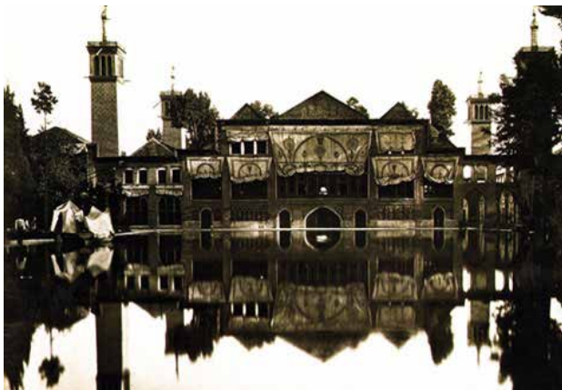
تصویر ۱. عمارت بادگیر و آب‌نمای آن.

باغ ایرانی نه فقط در اشعار شاعران، بلکه در هنر مینیاتور (نگارگری) نفوذ کرده است. مینیاتور شاخه‌ای از هنر طبیعت‌گرای ایرانیان است، صحنه‌های آن در دل طبیعت روی داده است و شخصیت‌های داستان معمولاً در میان باغ و بوستان هستند (جوادی، ۱۳۹۰ : ۱۲ و ۱۹). باغ ایرانی در نوشته‌های بازرگانان و افرادی که در دوران صفویه از باغ‌های ایران دیدن کرده‌اند نیز نفوذ یافته، چنانکه «شاردن» از خیابان چهارباغ به عنوان زیباترین خیابانی که تاکنون دیده و یا وصفش را شنیده است، می‌نویسد (ویلبر، ۱۳۹۰ : ۱۱۲). این برقراری ارتباط قوی بین باغ ایرانی و سایر هنرها و مخاطبین (ایرانی و غیر ایرانی) در بستری از عوامل ارتباط‌ساز بین هنرمند باغ‌ساز ایرانی و مخاطب رخ می‌دهد. چنان‌که «هنر یک کنش ارتباطی است»، و برای درک اثر هنری عواملی وجود دارد. طبق تصویر ۱، زمینه، اثر هنری، رمزگان و تماس، حلقه‌های واسط ارتباط مخاطب با هنرمند است. اگر