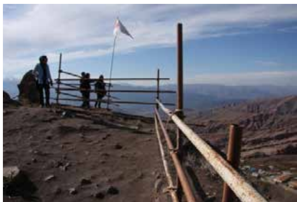
تصویر ۱۴. دست‌انداز با داربست در قلعه الموت. عکس: بتول صحراکاران، ۱۳۸۸.