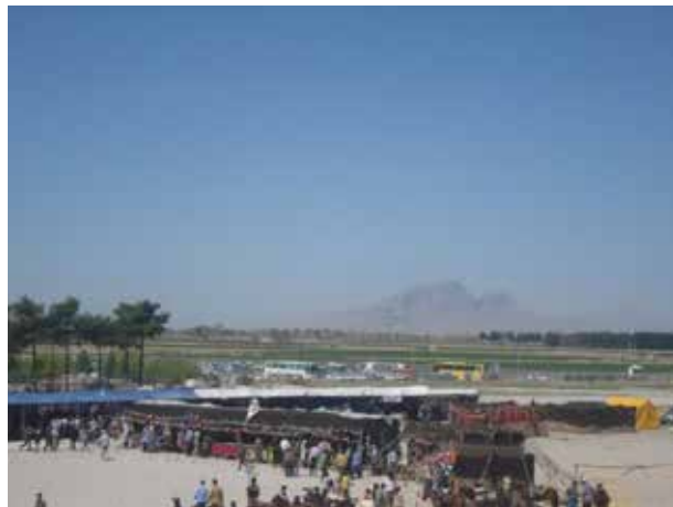
تصویر ۶. نمایشگاه موقت در سیاه‌چادر عشایر. عکس: پریسا گنج‌آبادی، ۱۳۹۰.