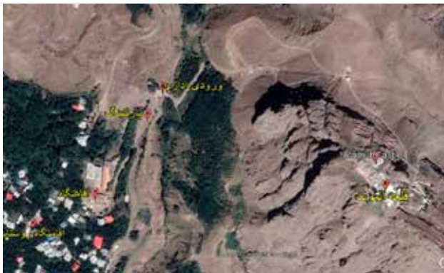
تصویر ۱. تجزیه و تحلیل موقعیت زیرساخت‌ها در چهار محوطه میراث در ایران: تخت جمشید (بالا، چپ)، بیستون (بالا، راست)، پاسارگاد (پایین، سمت چپ)، قلعه الموت (پایین، سمت راست)