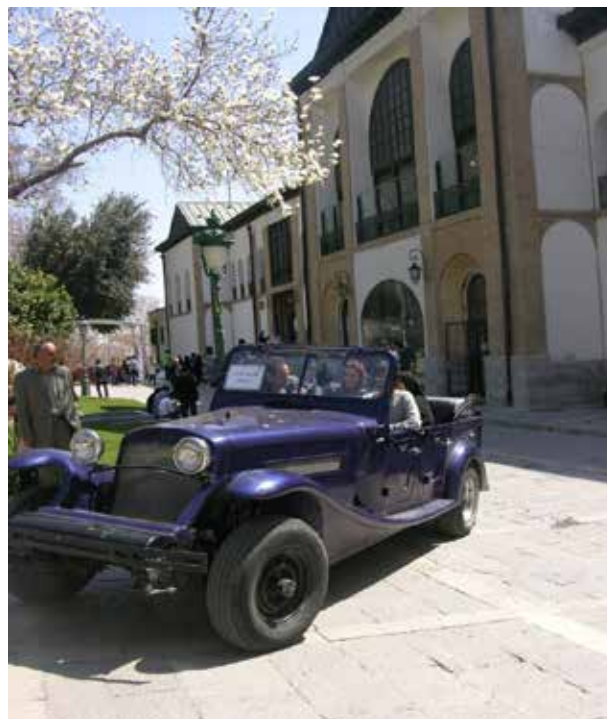
تصویر ۷. نمایشگاه اتومبیل‌های قدیمی در کاخ نیاوران. عکس: نسیم زند، ۱۳۹۰.

- تجهیزات مدیریت صف، پلکان موقت، دست‌انداز گاردریل حفظ ایمنی گردشگر و استفاده از مصالح با دوام ضروری است. استفاده از داربست برای پاسخ به کلیه این نیازها مناسب نیست؛ همانند قلعه الموت (تصویر ۱۴). - آبخوری، نیمکت، صندلی، سطل زباله، گلجای این مبلمان اغلب توسط بهره‌برداران به شکل آماده از بازار تهیه می‌شوند. عدم وجود طرح‌های مناسب با بستر تاریخی از کمبودهای مبلمان موجود در بازار