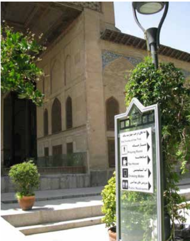
تصویر ۱۲. تابلوهای راهنمای محوطه کاخ چهلستون.