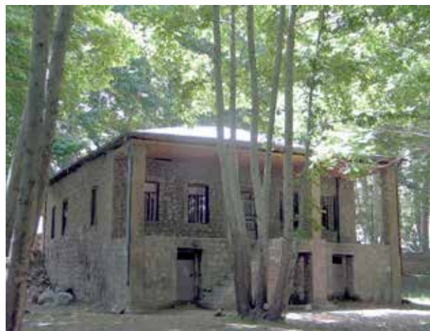
تصویر ۴. خانه پژوهشگران. عکس: مونا ابراهیمی، ۱۳۸۸.

کنار ورودی خانه عامری‌های کاشان (تصویر ۹). کودکان نیازمند فضاهای بازی هستند که می‌تواند پشت بام جذاب یک حمام تاریخی باشد همانند خانه عامری‌های کاشان.