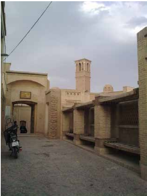
تصویر ۸. فضای نشستن عمومی در ورودی خانه‌های کاشان. عکس: الهام اندرودی، ۱۳۹۷.