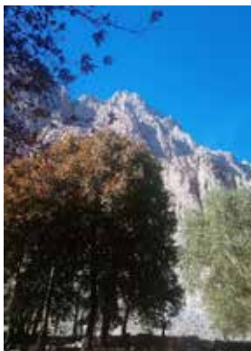
تصویر ۹. منظر طبیعی اطراف محوطه میراث جهانی بیستون و درختان چنار کهنسال.