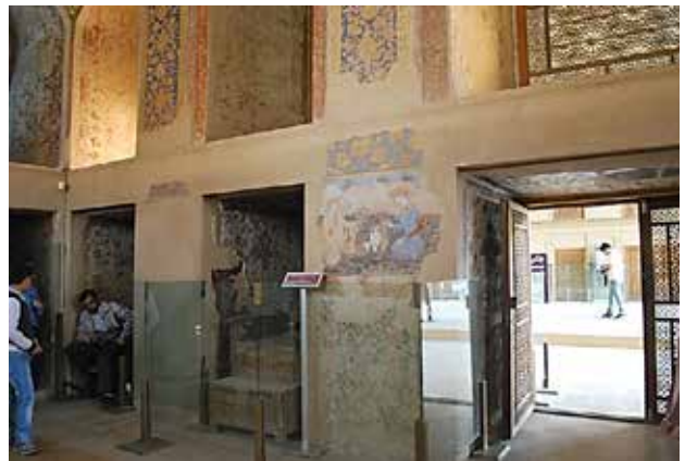
تصویر ۱۵. صفحات شیشه‌ای محافظ دیواره‌های نقاشی‌شده کاخ چهلستون؛ عکس: مرضیه ابراهیمیان، ۱۳۸۹.

منظر شبانه محوطه‌های میراث دارای ارزش هستند و ایجاد امنیت گردشگر در چرخش در محوطه در فضاهای تاریک ضروری است. نورپردازی به شکلی که منبع نور دیده نشود و احجام اصلی بنا روشن و خوانا شوند، همانند خانه‌های عامری‌های کاشان و نورپردازی ایوان‌ها و حیاط (تصویر ۱۷) دلنشین است. منبع نور و سیم‌کشی‌ها بهتر است در کانال‌های تأسیساتی مجزا دور از دسترس بازدیدکنندگان باشند و استفاده از عناصر کالبدی اصیل محوطه برای تأسیسات جدید توصیه نمی‌شود؛ همانند کانال‌های تخت جمشید.