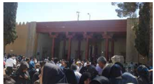
تصویر ۲. موزه تخت جمشید در ایام نوروز.

در صورتی که این فضاها با نظارت مدیران محوطه ایجاد نشوند و به بهره‌برداران سپرده شوند، ممکن است فضایی التقاطی و ناهمخوان با بافت اطراف را پدید می‌آورند. فروشگاه‌های صنایع دستی عامل تقویت‌کننده محصولات محلی و کارآفرینی اهالی بومی هستند و حضورشان باعث تنوع عملکرد در محوطه میراث است (همانند فروشگاه‌های