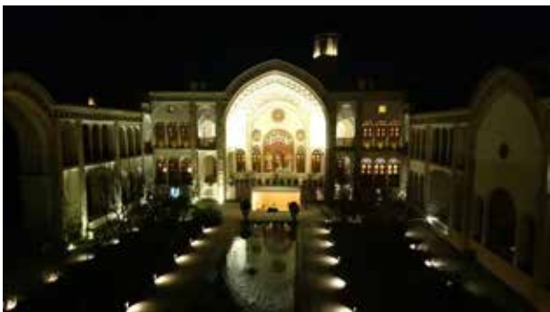
تصویر ۱۷. نورپردازی شب حیاط بیرونی خانه‌های عامری‌ها شامل ایوان، بادگیر و حیاط. عکس: الهام اندرودی، ۱۳۹۸.

پارکینگ یکی از مشکلات مهم محوطه‌های میراث خصوصاً در بافت‌های شهری و روستایی است. تمهید پارکینگ مناسب و تشویق گردشگران به پیاده‌روی در بافت به جای دسترسی مستقیم تا در ورودی محوطه سبب کاستن از آسیب بصری پارکینگ است؛ به طور مثال پارکینگ‌های کنار ورودی خانه‌های تاریخی کاشان (خانه‌های عامری‌ها) (تصویر ۲۰).