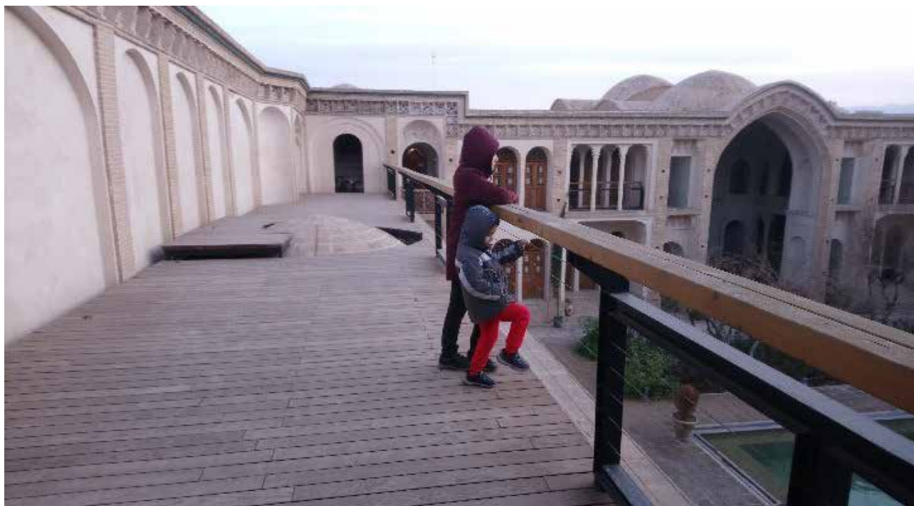
تصویر ۱۸. کف موقت بر روی پشت بام جبهه پنچ دری حیاط اندرونی خاتۀ عامری‌ها. زده حفاظتی امنیت کودکان را موقع استفاده تأمین می‌کند.