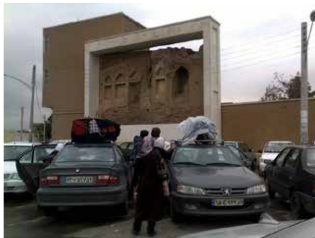
تصویر ۲۰. پارکینگ در خیابان همجوار خانه عامری‌ها. عکس: مونا ابراهیمی، ۱۳۹۶.

اما در طول یک دهه انجام پیمایش در این پژوهش از ۱۳۸۸ تا ۱۳۹۸، میلان و عناصر معماری رشد چشمگیری در کیفیت مصالح و نوع طراحی کرده‌اند و طراحان با بهره‌گیری از متغیرهای مناسب‌تر موجود در بازار در کف‌سازی و نورپردازی، راه‌حل‌های بهتری را ارائه کرده. همچنین رشد جریان بهره‌برداری از بناهای واجد شرایط در محوطه برای کاربری‌های جدید همانند هتل به رونق گردشگری فرهنگی کمک شایانی کرده است. همچنین حساسیت‌های مدیریت و نگهداری از محوطه‌ها نسبت به طراحی عناصر و جزئیات نیز افزایش چشمگیری داشته است. در نهایت یافته‌های پژوهش نشان می‌دهد که مدیریت خدمات در محوطه‌ها نیازمند اولویت‌دادن به حفاظت بر درآمد است و مدیریت محوطه میراث نقش کلیدی در برقراری توازن میان نیازهای اقتصادی، طرح معمارانه، زیرساخت‌های گردشگری مورد نیاز، تعمیر و نگهداری در درازمدت و حفاظت از بنا دارد.