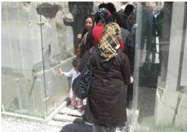
تصویر ۱۶. صفحات شیشه‌ای محافظ نقش برجسته‌های تخت جمشید. عکس: پریسا گنج آبادی، ۱۳۹۰.

تأسیسات گرمایش و سرمایش تأسیسات و تجهیزات همانند کولر و کانال کولر، اسپلیت یونیت، لوله‌کشی و سیم‌کشی و الحاقات مورد نیاز لازمه طراحی و نگهداری در درازمدت هستند و به خواست مدیر محوطه به حفظ اصالت و یکپارچگی بصری و نظارت دراز مدت بستگی دارند. این بند در اغلب محوطه‌های برداشت شده نیازمند بازنگری است.