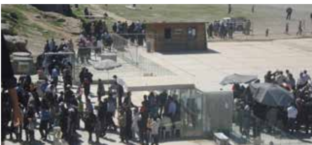
تصویر ۱۰. ورودی تخت جمشید. عکس: پریسا گنج‌آبادی، ۱۳۹۰.