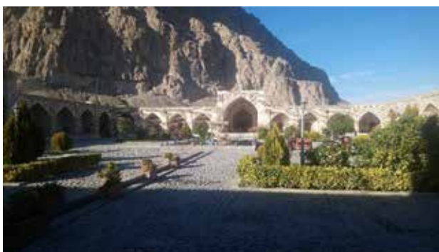
تصویر ۳. کاروانسرای بیستون که به هتل تبدیل شده است.