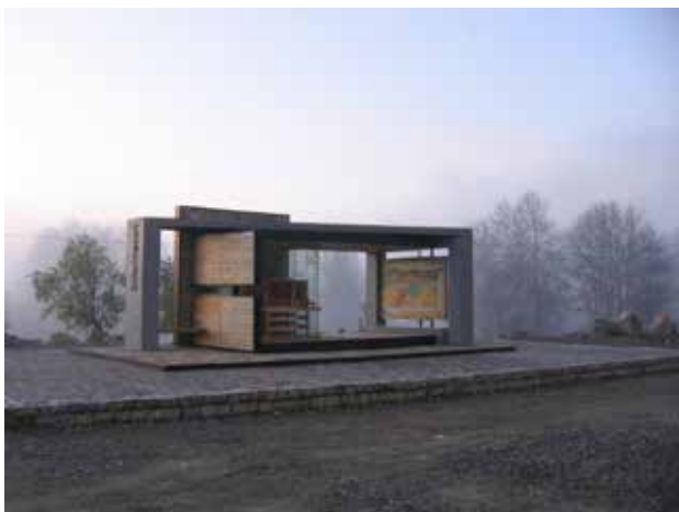
تصویر ۵. کیوسک اطلاع‌رسانی بیستون. عکس: مونا ابراهیمی، ۱۳۸۸.