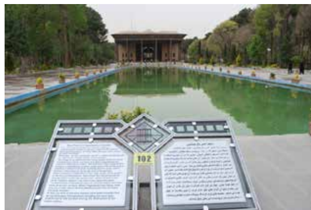
تصویر ۱۳. تابلوهای راهنمای محوطه کاخ چهلستون. عکس: مرضیه ابراهیمیان، ۱۳۸۹.

ضروری است. همانند حفاظ شیشه‌ای چهلستون و نقش‌برجسته‌های تخت جمشید (تصاویر ۱۵ و ۱۶). در ایام اوج گردشگری دسترسی به بخش‌های مهم می‌تواند محدود شود؛ همانند حصارکشی به دور دروازه ملل تخت جمشید در ایام نوروز و عدم اجازه گذر از میان دروازه به دلیل احتمال ازدحام و فشار جمعیت. • نورپردازی داخلی و خارجی