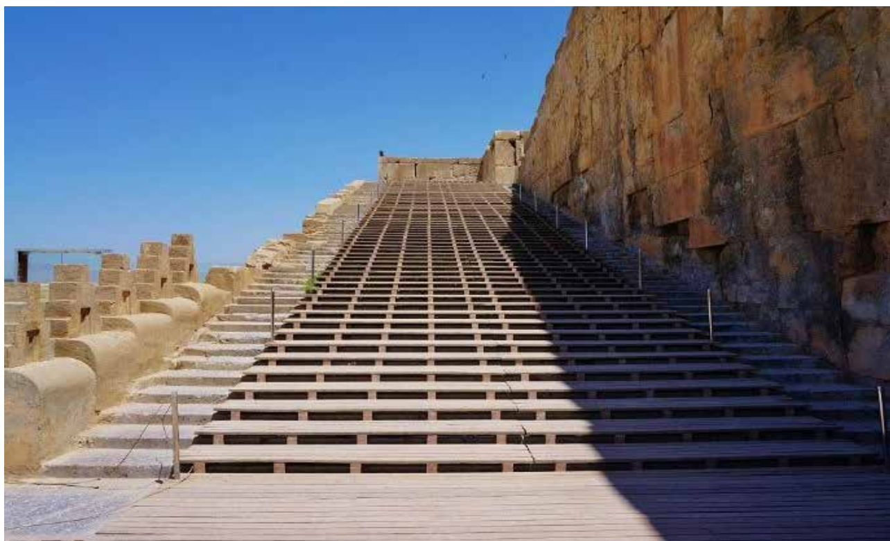
تصویر ۱۹. کف موقت پلکان تخت جمشید جلو فرسودگی پلکان اصلی را می‌گیرد.