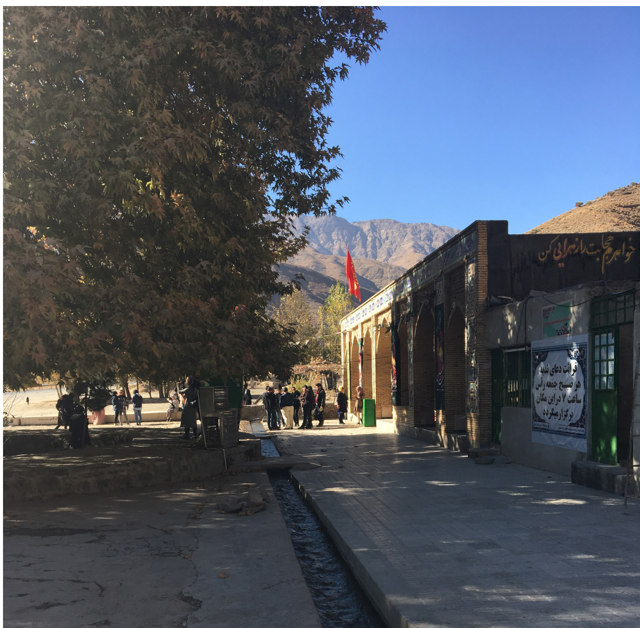
تصویر ۸. منظر آیینی به عنوان نقطه عطف کالبدی و معنایی در فضای بکر و طبیعی. جاده کرمان به روستای سیرج، عکس: حمیده ابرقویی فرد، ۱۳۹۶.

آنان با اسطوره‌ها و باورهای دین جدید، تداوم آن را در طول زمان تضمین کرده‌اند. در طول زمان ساختارهای ذهنی ایرانیان از یک فضای مطلوب، در قالب الگوی کالبدی طبیعت‌گرای این مناظر شکل گرفته و تبلور عقاید و باورهای مشترک جامعه در قالب آیینها به مناظر آیینی، نقش فعال اجتماعی بخشیده است. همچنین بروز عقاید مشترک افراد جامعه به شیوه‌ای جمعی در کنار ویژگی‌های طبیعت‌گرایانه، زمینه‌ساز تداوم و استمرار مناظر آیینی و اثرگذاری آنها بر منظر شهر ایرانی و حیات اجتماعی ساکنین آن است.