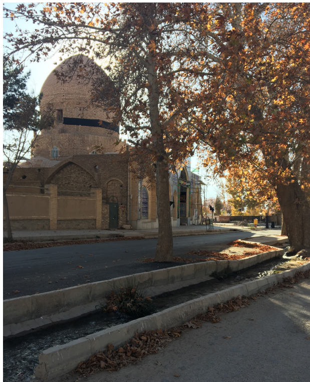
تصویر ۷. شکل‌گیری مرکز نقل معنایی و اجتماعی روستا در قالب منظر آیینی در قسمت ورودی آن متأثر از عوارض زمین. روستای سه‌کنج کرمان.

شیوه دیگر اثرگذاری مناظر آیینی بر منظر شهر کرمان، به شکل برگزاری آیین‌های عزاداری در بازار و مجموعه گنجعلی‌خان قابل شناسایی است. ویژگی‌هایی نظیر تکرارپذیری در مکان و زمان مشخص و ماهیت نمادین و اجتماعی سبب ارتباط و تعامل آیین‌ها با سه مؤلفه اصلی شهر یعنی کالبد، معنا و فعالیت می‌شود (علی‌الحسابی و پای‌کن، ۱۳۹۴: ۷۷). آیین‌های عزاداری ماه محرم با تکرار هرساله