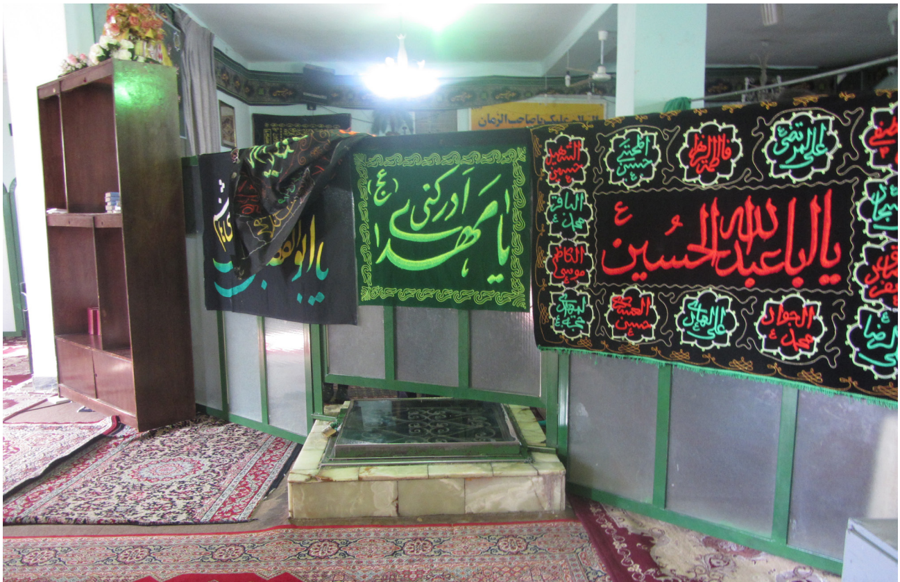
تصویر ۲. طبيعت‌گرایی منظر آيينی در قالب حفظ عنصر آب (چاه) در میان شبستان، مسجد صاحب‌الزمان جوپار کرمان.