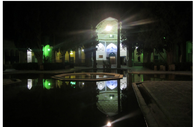
تصویر ۴. کیفیت فضایی ناشی از هم‌نشینی عناصر سه‌گانه منظر آیینی به عنوان بستر شکل‌گیری سنت زیارت-تفریح. بقعه شاه نعمت‌الله ولی کرمان.

مکان‌یابی مناظر آیینی که جوهره مکانی دلخواه را در ساختارهای ذهنی ایرانیان تشکیل می‌دهند، در حوزه روستا متأثر از عوارض زمین و محدودیت‌های آن بوده و گاه سبب می‌شود که این مناظر جدا از منظر روستا شکل بگیرند. در روستای سه‌کنج به دلیل قرارگیری روستا در شیب و