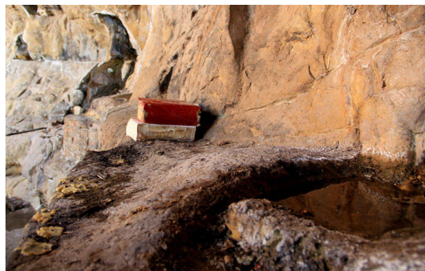
تصویر ۳. تداوم طبیعت‌گرایی منظر آیینی مهرابه روستای کهنوج پس از تغییر عملکرد آن به یک نیایشگاه اسلامی.

منظر آیینی بقعه شاه نعمت‌الله ولی در شهر ماهان نمونه‌ای از مناظر آیینی است که در آن ابعاد اجتماعی آیین‌ها در کنار طبیعت‌گرایی فضای بقعه، کیفیت مناسب محیطی را برای شکل‌گیری سنت زیارت-تفرج فراهم آورده است (تصویر ۴). امروزه تصمیم‌های مدیریتی در شهر ماهان در تضاد با نقش اجتماعی بقعه بوده و منظر آیینی بقعه شاه نعمت‌الله ولی، عملکرد تفرجی گذشته خود را ندارد و بعد اجتماعی آیین‌ها -که یکی از دلایل اثرگذاری و تداوم مناظر آیینی محسوب می‌شود- مورد غفلت قرار گرفته است. حیاط بقعه دیگر مانند گذشته به‌عنوان ظرفی برای یکی‌شدن افراد با یکدیگر در قالب باورهای مشترک عمل نمی‌کند و تفرج در نواحی دیگر شهر و به صورت منفک از زیارت انجام می‌پذیرد و سنت زیارت-تفرج که تا پیش از این فرهنگی برخاسته از تمایلات اجتماعی ساکنان بوده در تضاد با سیاست‌های حاکم بر جامعه به ضدارزش تبدیل شده است.