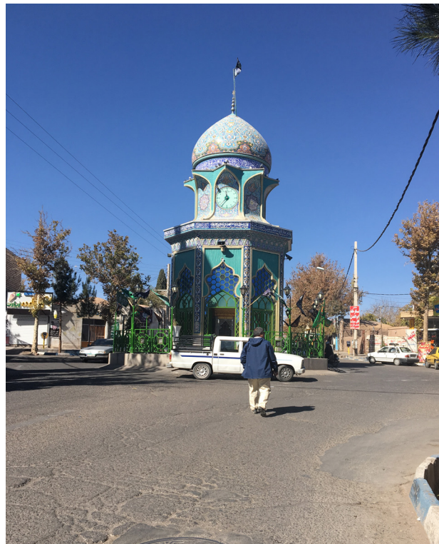
تصویر ۸. شکل‌گیری مرکز اجتماعی و عملکردی شهر در محل منظر آیینی امامزاده شیرخدا. راین کرمان. عکس: حمیده ابرقویی فرد، ۱۳۹۶.