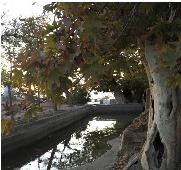
تصویر ۵. شکل‌گیری مرکز کالبدی و معنایی روستا در مجاورت منظر آیینی. روستای تیکدر کرمان.

منظر آیینی روستای تیکدر واقع در استان کرمان حکم