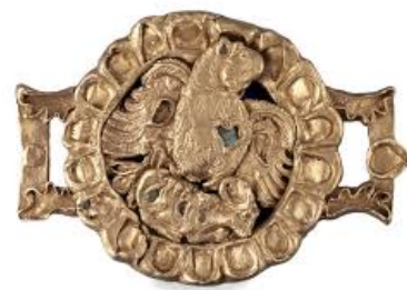
تصویر ۱۴. قطعه‌ای از یک کمر بند اشکانی با نقش عقابی که گاوی را با خود می‌برد؛ موزه متروپولیتن.

۹. در فلات ایران شامل ایران کنونی و منطقه قفقاز به خصوص ارمنستان زمینه اصلی آیین مهر که قربانی مقدس گاو است به گونه‌ای تصویرسازی شده است