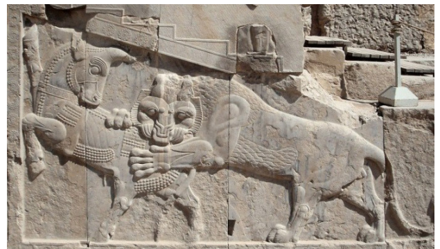
تصویر ۵. نبرد شیر و گاو، تخت جمشید.