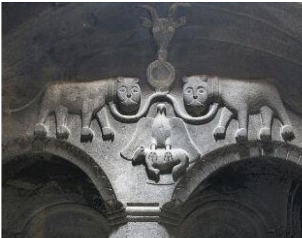
تصویر ۸. تعقاب در حال شکار گاو کلیسای گفارد، ارمنستان.

که میترا به شکل انسان ظاهر می‌شود و گاو را قربانی می‌کند؛ باید در جهان‌بینی شرقیان و غربیان جست، زیرا در جهان یونانی و رومی (غربی) خدایان را در کالبدی انسانی تجسم می‌کردند و حتی بر ایشان صفات انسانی قائل بودند [مانند خدایان المپ ۴۰ ]. اما در جهان‌بینی ایرانی چنین نبود و بیشتر قدرت‌های ایزدی به شکل نمادین تصویر می‌شدند. همان‌گونه که این تفاوت‌های