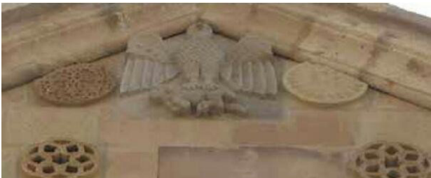
تصویر ۷. عقاب در حال شکار گاو. کلیسای سنت استپانوس.