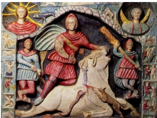
تصویر ۲. نقاشی دیواری از میترا در شهر مارینو- ایتالیا (قرن سوم).

همان‌گونه که گفته شد مهر ایزد حامی جنگجویان و جنگاوران بود و اساساً آیین مهر توسط سپاهی‌مردان ایرانی به سربازان رومی داده شد و ایشان اولین گروندگان غربی به آیین مهر بودند و همان‌گونه که گفته شد در جهان‌بینی ایرانی تجسم میترا نمادگرایانه بوده و از شمایل انسانی برای وی کمتر بهره می‌جستند؛ با نگاه به کتاب راهنمای رژه ارتش ایران این ایزد بزرگ جنگاوران در پرچم‌ها و درفش‌ها و تزیینات روی لباس سپاهیان ایرانی به شکل شاهین منقوش بوده است (تصویر ۱۳).