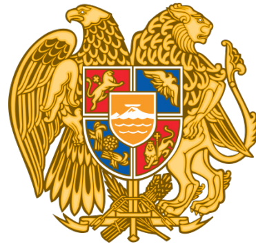
تصویر ۱۲. نشان ملی جمهوری ارمنستان؛ تصویر شاهین و شیر.