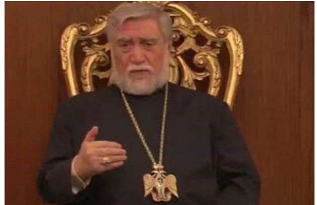
تصویر ۱۱. شاهین شکارگر به شکل گردنبندها بر گردن اسقف‌های ارمنی.