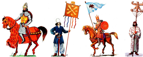
تصویر ۱۳. سربازان ایران با درویش شاهین از راست به چپ: سرباز هخامنشی، سواره اشکانی، پیاده ساسانی، سواره ساسانی.