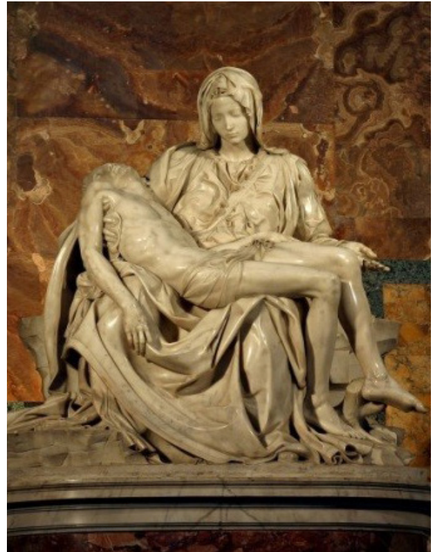
تصویر ۱. راست : مجسمه سنگی پی‌یتا، واتیکان. چپ : پی‌یتای توبادزین (روستایی در لهستان)، موزه ملی ورشو لهستان، حدود ۱۴۵۰ م. رنگ حرارتی روی چوب.

به تبع آن در کلیساهای غربی کاربرد داشته است. از مرور یسنه‌ها ۲۶ چنین برمی‌آید که اهورامزدا ۲۷ (پدر) و سپندارمذ ۲۸ (مادر) جفتی بوده‌اند که فرزندی را پدید آورده‌اند که صورت مینوی‌اش ارته ۲۹ یا آشه (اردیبهشت) و صورت زمینی‌اش آذر بوده است؛ ازین‌رو است که آذر بارها و بارها با لقب پسر اهورامزدا مورد اشاره واقع شده است. ۳۰ این خانواده مقدس با صورتی آسمانی از سه طبقه اجتماعی همسان هستند؛ پدر خردمند آسمانی (اهورامزدا) با مغان، ایزدبانوی باروری و رویش (سپندارمذ) با کشاورزان و فرزند ایشان که پسری جوان و جنگ‌آور است با ارتشتاران. هنگامی که دین زردشتی با ادیان پیشین در هم ادغام شد این مثلث به گونه‌ای دیگر که اهورامزدا (پدر)، آناهیتا (مادر) و مهر (پسر) جلوه‌گر شد. همین خانواده مقدس که در دوران هخامنشی پیوند با سنت‌های پیشازردشتی دارد و در کتیبه اردشیر دوم چون مثلثی مقدس مورد اشاره قرار گرفت. «به یاری اهورامزدا، آناهیتا و میترا (ناهید و مهر)، فرمان دادم که این آپادانا ساخته شود» (زرین‌کوب، ۱۳۸۴: ۱۹۵).