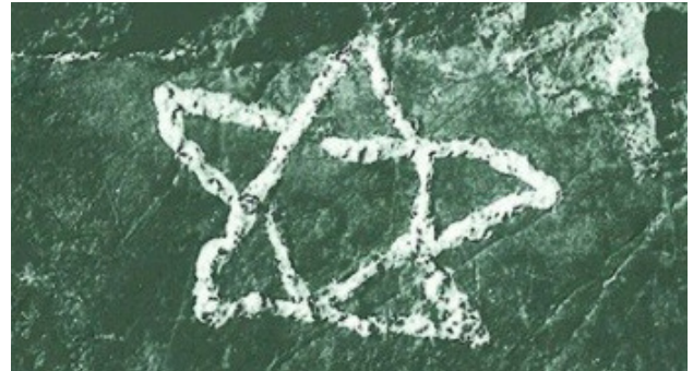
تصویر ۴. ستاره مهرپرستی. مأخذ: کامبخش‌فرد، ۱۳۷۴.