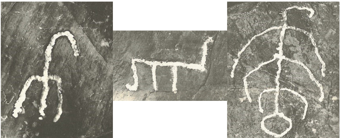
تصویر ۱۰. علایم و نقوش حجاری شده بر سنگ‌های لاشه‌ای معبد آناهید کنگاور به ترتیب از چپ به راست، تصویر عقاب، تصویر یک گاو و تصویر یک عقاب که گویا جسمی را شکار کرده و به سمت بالا می‌برد، عکس: کامبخش فرد، ۱۳۷۴.

می‌توان در تزیینات داخل کلیساهای شرق و غرب دید؛ برای نمونه اثری به نام پی‌تا که در کلیساهای غربی به وفور دیده می‌شود اما در کلیساهای شرقی اثری از آن نیست و علت آن باز می‌گردد به تأثیر باور و تجسم خداوند در کالبد انسانی در مهرپرستی غربی (میتراهی گاوکش شمایل انسانی دارد) که حاصل این اثربخشی می‌شود تجسم مسیح خون‌آلود در آغوش مادر و علت نبود چنین تصویری