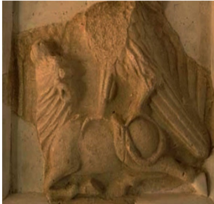
تصویر ۹. شکار گاو به دست شاهین، قلعه ضحاک در آذربایجان شرقی، مأخذ: http://faza-falamaki.com - 24.March.2018.