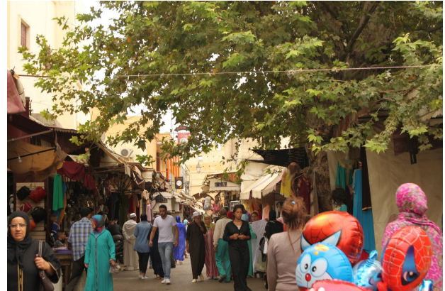
تصویر ۱۴. برخورد منفعلانه با درخت در فاس جدید، عکس: ریحانه جتتی، ۱۳۹۵.