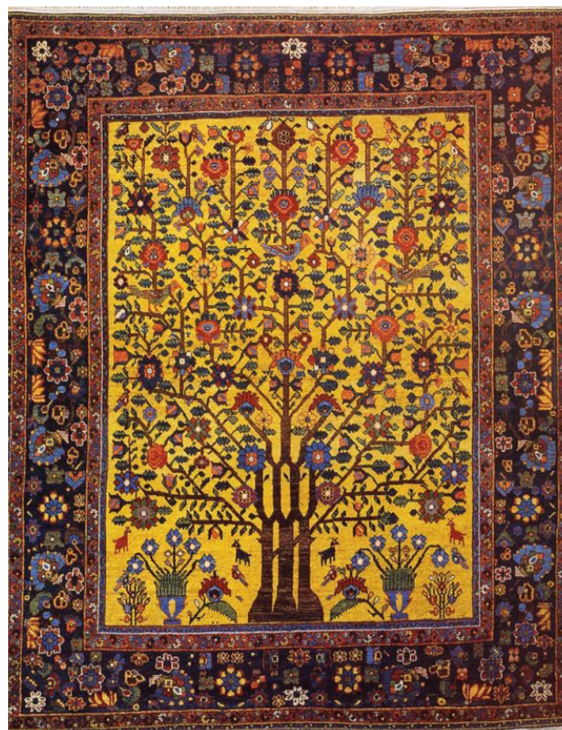
تصویر ۴. در هنر فرش طرح‌های درختی از جمله مهم‌ترین و متنوع‌ترین شاخه‌های طراحی فرش است که در اشکال مختلف از جمله طرح محرابی درختی، طراحی شده است.