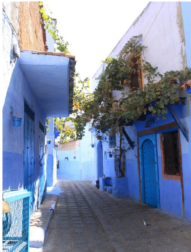
تصویر ۱۳. شاخه‌های رونده مو بروز بومی درخت در شهر شفشاون، عکس: ریحانه حجتی، ۱۳۹۵.