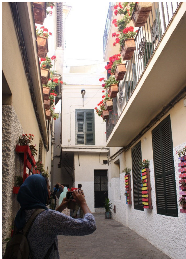
تصویر ۱۰: مدینه شهر اصیله به عنوان یکی از شهرهای ساحلی مراکش در فضاهای باز نیز شاهد حضور درختانی در وسعت فراتر از گلدان‌های کوچک نیست، عکس: ریحانه حجتی، ۱۳۹۵.

کلی به سه دسته تقسیم کرد: ۱ • شهرهایی که در نوار ساحلی قرار دارند (رباط، اصیله، صویره و تانژه) • شهرهایی که در نواحی کوهپایه‌ای قرار دارند (تطوان و شفشان) • شهرهایی که در دشت‌ها و نواحی دورتر از کوه و دریا قرار دارند (فاس، مکناس و مراکش). در شهرهای رباط و تانژه حضور فضای سبز در بافت شهری، بیشتر محدود به درختان رونده و گلدان‌های تزئینی است. گل‌های کاغذی که بعضاً از لبه دیوار حیاط خانه‌ای بیرون زده و گلدان‌های رنگی، نماینده حضور عمومی گیاهان در سطح شهر هستند. درخت به عنوان یک عنصر تعریف‌کننده و مؤلفه فضا‌ساز شهری در بافت حضوری ندارد. نبود تک درخت و فرم‌های دیگر آن، در کالبد شهری، نشان از بی توجهی به این عنصر سبز در این دسته شهرها دارد، تا جایی که به خاطر این مؤلفه‌های سبز نیز فضاهایی گشوده درون بافت دیده نمی‌شود. بنابراین نحوه حضور درخت در این دست شهرها حضوری حداقلی است که ناشی از عدم توجه