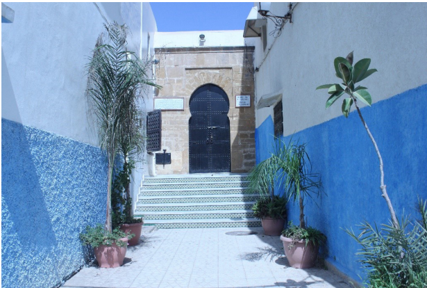
تصویر ۹. گلدان‌های تزئینی در مدینه شهر رباط بارزترین و عمومی‌ترین نحوه حضور درخت در سطح شهر هستند.

در شهرهای تطوان و شفشان در گونه دوم، گل‌های کاغذی جای خود را به بوته‌های رونده می‌دهند. سبزی‌نگی درون