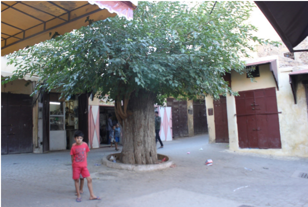
تصویر ۱۵. یکی از نقاط عطف محلات شهر مکناس که در فضایی محصور با کاربری‌های محلی و درختی در میان، تعریف شده است. عکس: ریحانه جتتی، ۱۳۹۵.