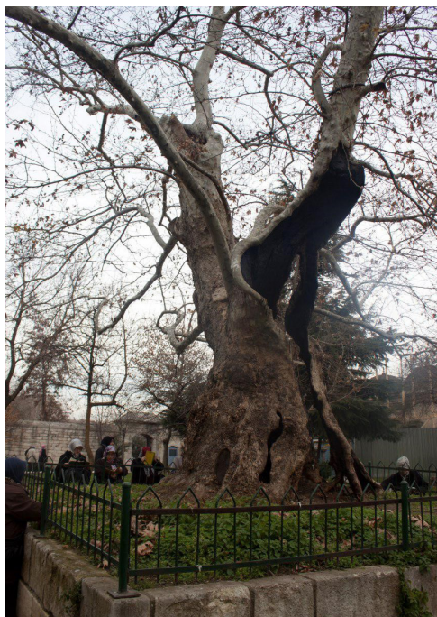
تصویر ۷. درختی در یکی از مساجد استانبول که مردم برای برآورده شدن حاجاتشان به آن توسل می‌جویند، عکس: فرنوش مخلص، ۱۳۹۳.