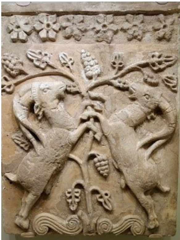
تصویر ۳. نقش درخت در سنگ‌نگاره‌های ساسانی، قرن ششم پیش از میلاد.

جلوه‌های حضور بومی درخت در شهرهای مراکش شهرهای مورد بازدید در کشور مراکش را می‌توان به صورت