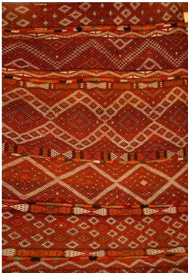
تصویر ۱۸. نمونه‌ای از الگوهای فرش‌های مراکشی،