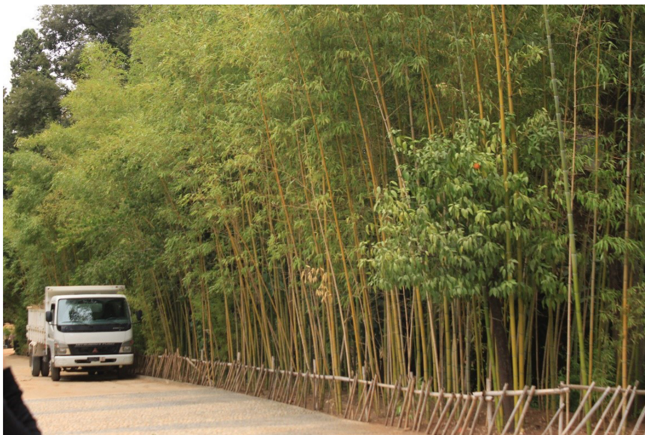
تصویر ۱۷. استفاده از گیاه بامبو در حاشیه کرت باغ جنان‌السبیل نمونه‌ای از نداشتن رویکرد مشخص نسبت به نوع گیاه است و اقدامی وارداتی محسوب می‌شود.

مراکش نیز دنبال کرد، چنانچه این کلمه در مراکش به نخلستان‌ها و باغ‌های زیتون اطلاق می‌شود (زانگری، ۱۳۹۲). این موضوع یعنی نداشتن سابقه تاریخی و فرهنگی در باغ‌سازی، همچنین منجر به ابداع یا خلق یک شیوه باغ‌سازی و سبک ویژه نیز نشده است. باغ مهمی که در شهری تاریخی مانند فاس مورد بازدید قرار گرفت با نام "جنان‌السبیل" و قدمت آن که تنها به سه قرن پیش برمی‌گردد نشان می‌دهد پیشینه باغ‌سازی در این شهر چندان قدیمی و تاریخی نیست. باغ‌های محدود دیگر در سایر شهرها نیز حکایت از تاریخ نه‌چندان دور ساخت آنها دارد. مطالعه و حتی مشاهده مختصر این باغ‌ها همچنین نشان‌دهنده این است که شیوه باغ‌سازی در غالب موارد مختلط و التقاطی است. باغ‌های کشور مراکش را می‌توان متأثر از باغ‌سازی فرانسوی، ایرانی-اسلامی و اندلسی دانست. باغ‌هایی که گاه حتی در استفاده از گونه‌های طبیعی نیز رویکردی اصیل نداشته و شیوه‌ای مشخص را در استفاده از گیاه آرایه نمی‌دهند. هرچند برخی باغ‌های مورد بازدید اصولاً به عنوان باغ‌هایی که در