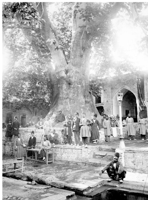
تصویر ۶. یکی از مظاهر فرارگیری اماکن مقدس در کنار درختان ویژه، در فرهنگ ایران، درخت چنار امامزاده صالح بوده است، مأخذ: www.entekhab.ir