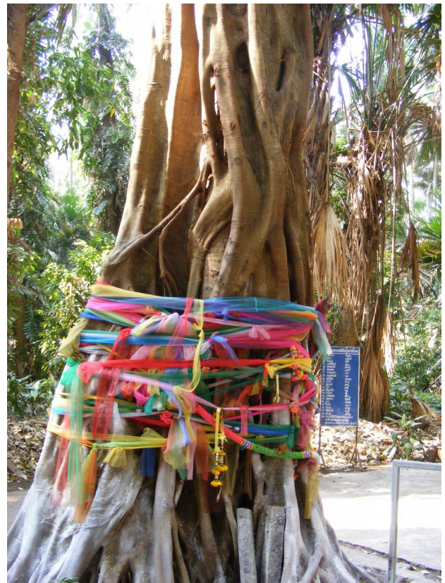
تصویر ۸. سنت دخیل بستن به درختان در آفریقا مانند بسیاری از نقاط دنیا نشان از تقدس این عنصر طبیعی در فرهنگ برخی ملل دارد.