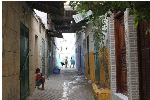
تصویر ۱۱. گلدان‌های رنگی تزئینی، نماد حضور سبزی‌نگی در تانزه، عکس: ریحانه حجتی، ۱۳۹۵.

بافت این شهرها نیز محدود به حضور همین درخت‌های رونده می‌شود. درختان مو در این شهرها نیز هرچند به عنوان سقف کوچه‌ها و معابر تنگ عمل می‌کنند، اما نمی‌توان حضور آنها را در ایجاد و تعریف فضا، هدافند و هدایت‌شده دانست چرا که همین اندازه حضور از سبزی‌نگی‌ها را در ورودی خانه‌ها یا کناره معابر به صورت ره‌اشده می‌توان یافت. غیر از مو، درخت دیگری در سطح فضاهای شهری دیده نمی‌شود و فقر حضور این عنصر سبز در این گونه نیز دیده می‌شود (تصاویر ۱۲ و ۱۳).