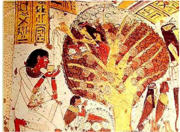
تصویر ۱. درخت بلوط به عنوان درخت زندگی نزد مصریان باستان تقدیس می‌شده است.