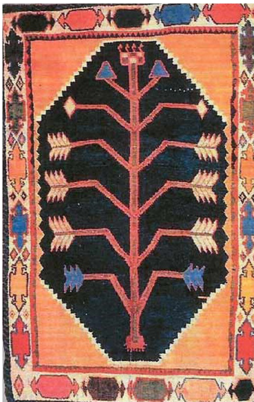
تصویر ۵. نقش درخت زندگی بر قالی در منطقه آناتولی، قرن نوزدهم، مأخذ: http://www.tcoetribalrugs.com