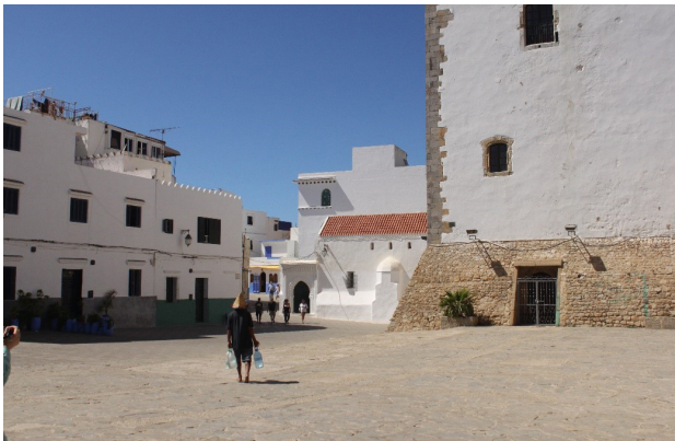
تصویر ۱۲. نمونه‌ای از درختان رونده در کنار ورودی ساختمان‌های تطوان به عنوان حضور بومی گیاه در سطح شهر، عکس: ریحانه حجتی، ۱۳۹۵.

اذهان شهروندان نشان می‌دهد (تصویر ۱۴). مکناس گونه‌ای متفاوت از نظر حضور درخت در شهرهای مراکش است. این شهر، تنها شهری است که محلات و بافت شهری آن، واشدگاههایی به عنوان نقاط عطف محله دارند که حضور درخت در آنها اثرگذار و تقویت‌کننده فضاست. در