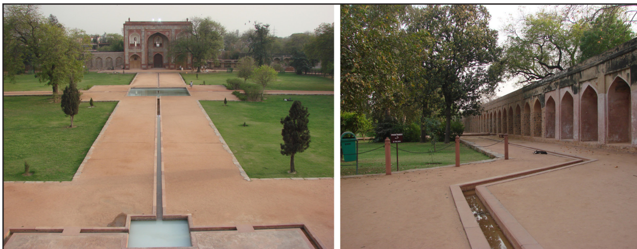
تصویر ۹. محورهای اصلی و فرعی آب به صورت باریک و کاملاً تزئینی در سطح باغ کشیده شده است و به نقاط تقاطع مسیرها در حوض‌های کوچک و کم‌عمق می‌ریزند. باغ‌مزار همایون، آگرا، هند.