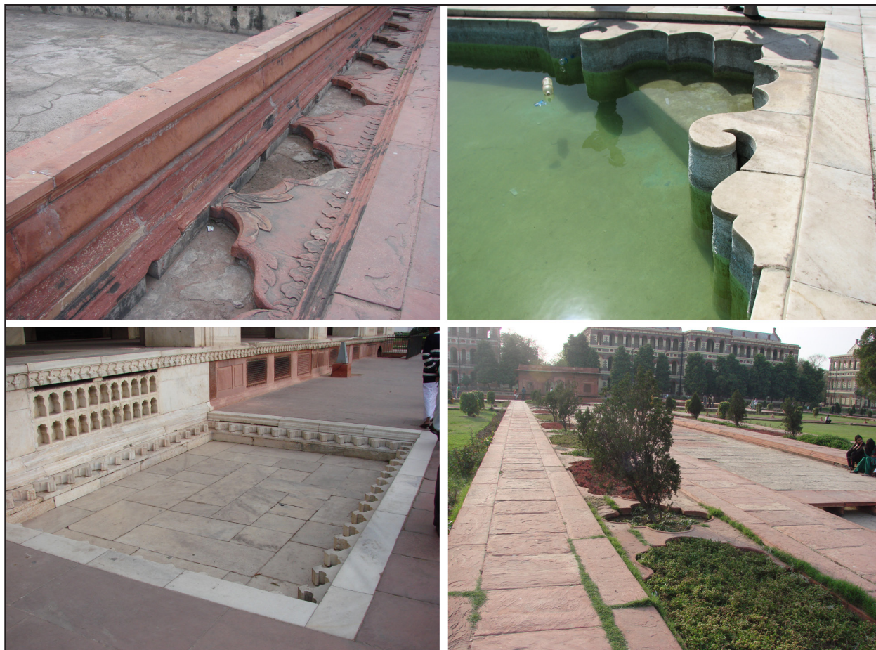
تصویر ۶ انواع لبه کاری‌های سنگی و حجاری‌ها در کناره باغچه‌ها و حوض‌ها، حضور تزئینات معماری بسیار در محوطه‌سازی باغ‌های هندی چون باغ‌مقبره‌های همایون و تاج‌محل را نشان می‌دهد. عکس: محمد جمشیدیان، ۱۳۹۱.

ردشدن از روی آب با پله‌هایی باریک و رسیدن به سکوهایی در وسط یک حوض بزرگ آب، استفاده از انواع بازی‌ها و مظاهر آب و تقاطع دادن مسیرهای آب، همه گونه‌ای از نگرش به آب را شامل می‌شود که برگرفته از ذوق تزئین‌گرایی هندی است. گویا انواع قابلیت‌های آب مانند انعکاس، حرکت و زلالی در خدمت این نگرش قرار گرفته است. در نمونه‌ای خاص در مهتاب‌باغ، حوض آب وسیعی که پشت کوشک تخریب شده و در راستای محور اصلی تاج‌محل در آن سوی رودخانه قرار دارد، آب را کاملاً برای انعکاس حجم عظیم تصویر تاج‌محل دیده است (تصویر ۱۰).