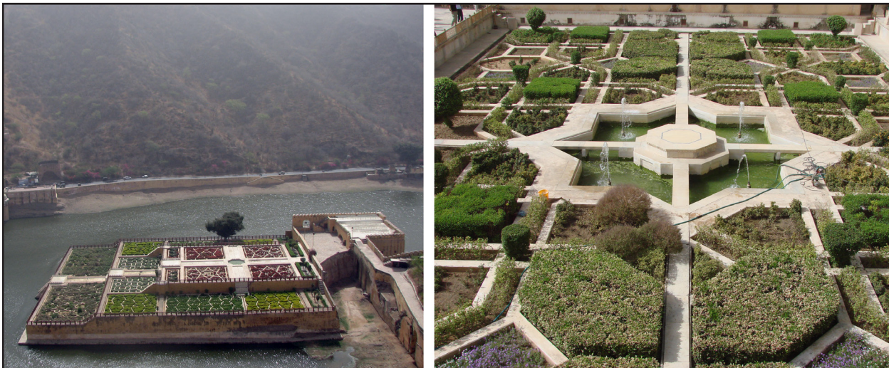
تصویر ۵. تقسیمات ریزشده در پلان باغچه‌های باغ‌های آبی جیپور و باغ سلطنتی آن نمونه‌های بارز تأثیر نگاه تزئین‌گرایی به پوشش گیاهی چهارباغ ایرانی است. امبرفورت، جیپور، هند. عکس: محمد جمشیدیان، ۱۳۹۱.

از هم جدا شده که گویا یک اثر نگارگری در ترسیم این مرزها در تمام طول باغ جریان دارد (تصویر ۶).