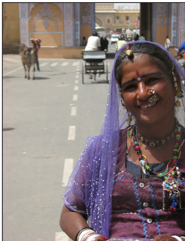
تصویر ۱. انواع زیورآلات هندی که در اقشار مختلف جامعه استفاده می‌شود؛ از دوره‌گردان تا افراد طبقات مرفه، جیپور، عکس: محمد جمشیدیان، ۱۳۹۱.