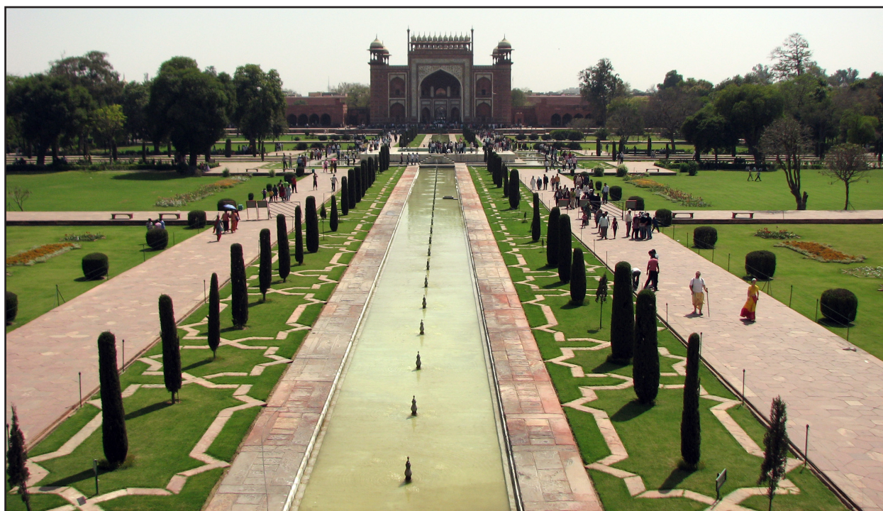
تصویر ۸. درختان در محور اصلی باغ هندی علاوه بر نقش محورسازی، به صورت پراکنده در مراکز محوره‌های فرعی و در محل‌های تقاطع قرار گرفته‌اند. باغ‌مزار تاج‌محل. آگرا، هند. عکس: محمد جمشیدیان، ۱۳۹۱.