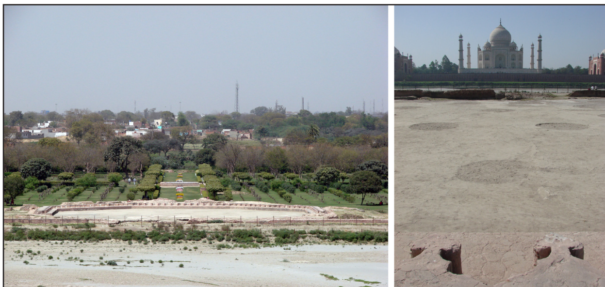
تصویر ۱۰. حوض عظیمی که در مهتاب‌باغ، پشت کوشک اصلی ساخته شده است علاوه بر کنگره‌های سرتاسری که نماینده ذوق هندی در باغسازی هند است، در ابعاد بزرگ‌تر هم نقشی خاص دارد؛ در واقع تصویر عمارت تاج محل را در خود انعکاس می‌دهد. آگرا، هند.