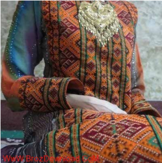
تصویر ۲. نمونه ای از پوشاک زنانه بلوچ.

طی آن «نگاره‌های مختلف بر روی پارچه‌های بدون نقش از طریق دوختن و یا کشیدن قسمتی از نخ‌های تار و پود به وجود می‌آید. رودوزی‌های سنتی باید علاوه بر جنبه زیبایی، کاربردی نیز باشند» (یاوری، ۱۳۸۹: ۱۱۱). رودوزی‌های سنتی کلاً به ۶ دسته تقسیم می‌شوند. «بلوچی دوزی و یا سوزن دوزی بلوچ در این تقسیم‌بندی شش‌گانه جزو انواع پرکار قرار می‌گیرد که در آن‌ها زمینه اصلی مشخص نبوده، دوخت و الوان موجب پیدایش زمینه تازه‌ای پر از نقش و نگار می‌شود» (یاوری، ۱۳۹۰: ۲۳). پرکار بودن و یا کم‌کار بودن سوزن‌دوزی و ظرافت نخ و هماهنگی رنگ‌ها نقش مهمی در ارزش آن دارد.