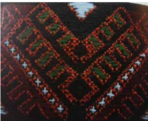
تصویر ۴ ب. نمونه نقش حیوانی سوزن‌دوزی بلوچ موسوم به دم طاووس.