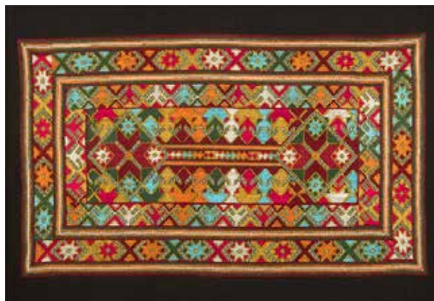
تصویر ۴. نمونه نقوش سوزن دوزی بلوچ ملهم از طبیعت موسوم به اشک عروس.