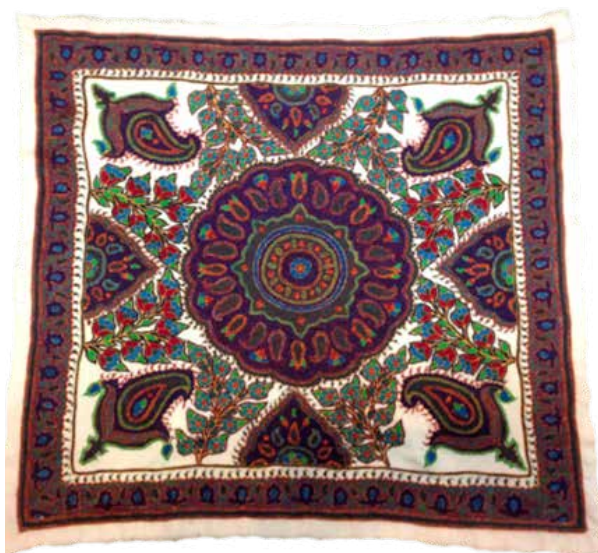
تصویر ۷. نمونه ای از پته دوزی کرمان.