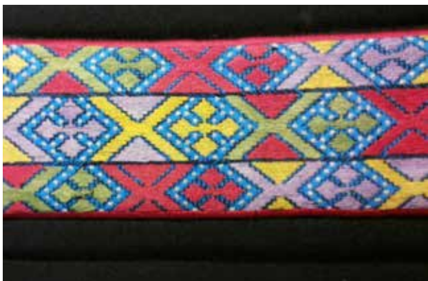
تصویر ۵. نمونه ای از نقوش قرینه سوزن دوزی بلوچ. عکس: گلناز کشاورز، ۱۳۹۵.