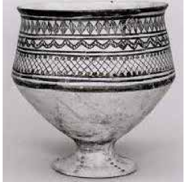
تصویر ۱. نمونه ای از سفال فلات مرکزی ایران با نقوش هندسی مشابه نقوش سوزن دوزی بلوچ، هزاره چهارم قبل از میلاد.

رنگ‌های سنتی این هنر به شش عدد محدود می‌شود که مهم‌ترین آن‌ها رنگ‌های جگری تیره و سنگرف روشن یا نارنجی، سیاه، سفید، سبز و آبی است (رنج‌دوست، ۱۳۸۷: ۲۴۴) (تصویر ۳). نقوش طبیعی سوزن‌دوزی بلوچ گستره موضوعی متنوعی را در برمی‌گیرد که آن‌ها را می‌توان در سه گروه کلی نقوش گیاهی، حیوانی و ملهم از طبیعت جای داد (تصویر ۴ الف، ب، پ). در این بین کاربرد نقوش گیاهی در قالب‌های هندسی بیشتر از دیگر انواع می‌باشد. قرینه‌سازی عنصری اساسی در این هنر است (تصویر ۵). نقوش سوزن‌دوزی بلوچ تجریدی و شکسته است و رو به سوی ساده‌گرایی دارد. اساس زیبایی‌شناسی این هنر را می‌توان در هندسی بودنش دانست. نقش و نگارهای سوزن‌دوزی بلوچ بن‌مایه ذهنی داشته و در حین کار قابلیت تغییر دارد. «حدود ۵۰ تا