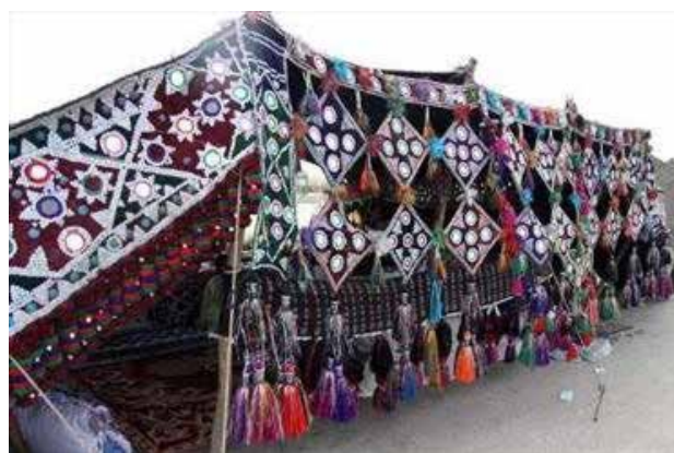
تصویر ۶. نمونه ای از سیاه چادر بلوچی.