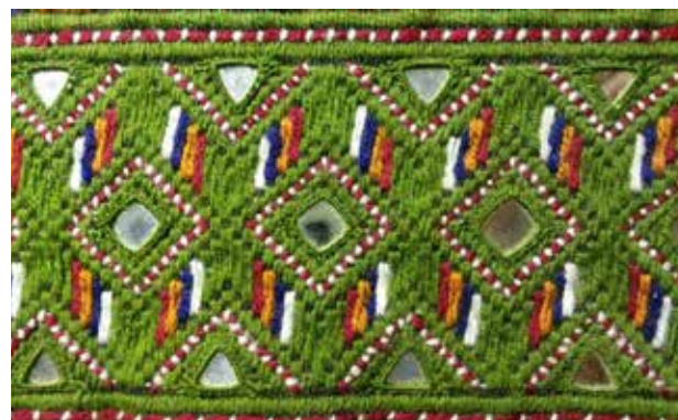
تصویر ۸. نمونه نقوش تجریدی سوزن دوزی بلوچ به همراه آینه کاری. عکس: گلناز کشاورز، ۱۳۹۵.