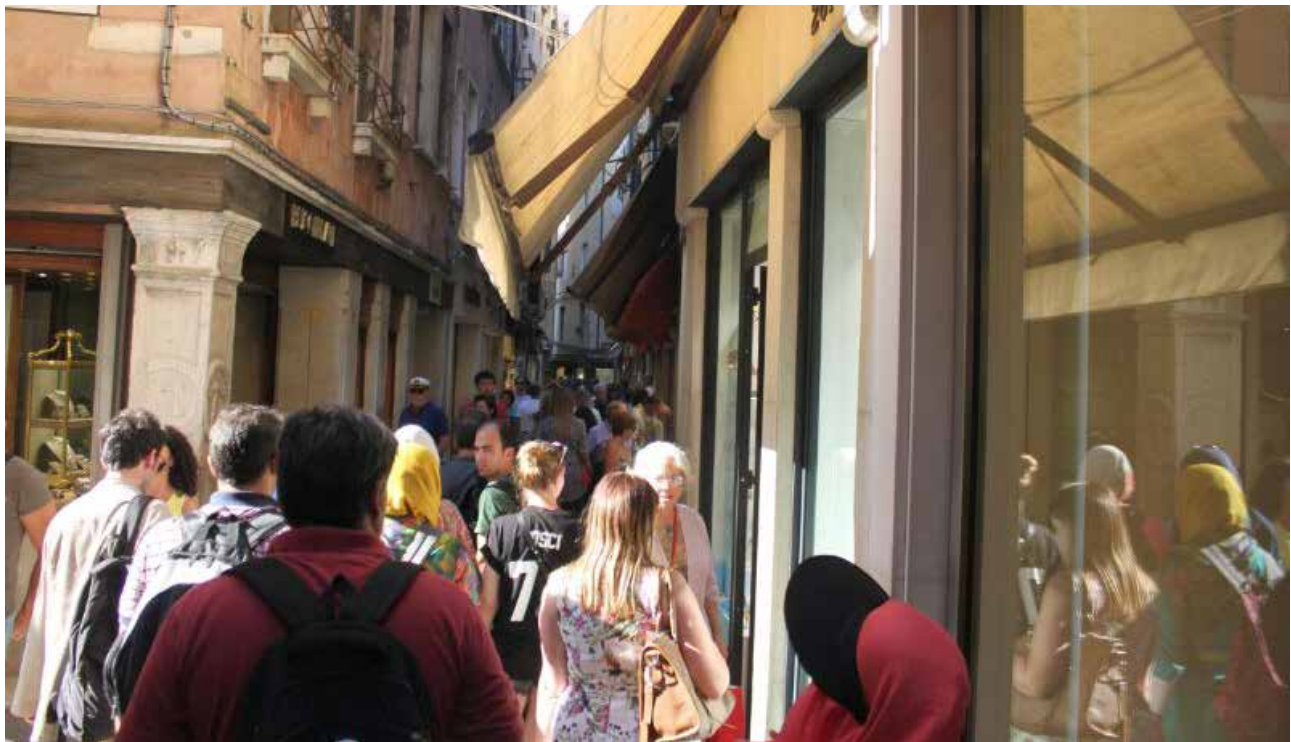
تصویر ۱. تجربه حضور در فضاهای شهری، سیه‌نا، ایتالیا. عکس: فاطمه خزاعی، ۱۳۹۴

در برخی موارد نیز تصورات و انتظارات از فضا کمتر از تجربه حضور در فضا و تجربه آن بود. چنان‌که یکی از مصاحبه‌شوندگان در مورد شانزلیزه اینطور توضیح می‌دهد: