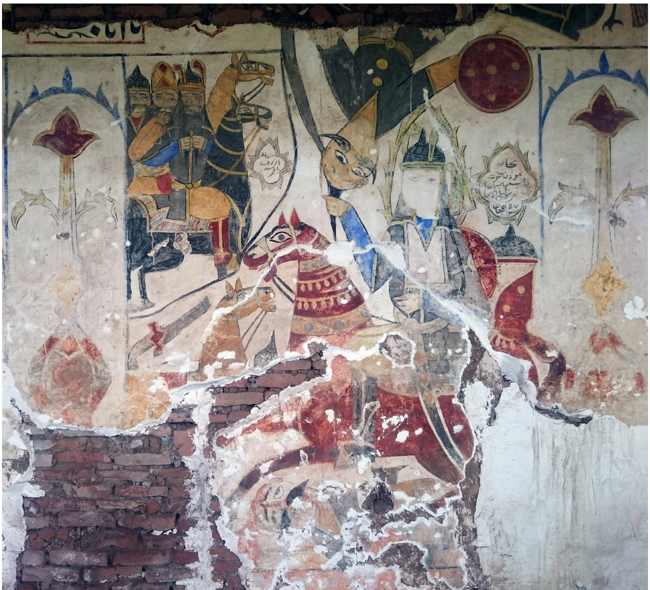
تصویر ۹. نقاشی دیوار جنوبی، قاسم (ع) در حال بلند کردن فرزند ارزق.

است. اسب‌های حاضر در میدان نبرد متأثر از خشونت حاکم بر صحنه با چشمان وحشت‌زده و دهانی باز نقاشی شده‌اند. مجلس نقاشی سمت چپ دیوار جنوبی، داستان به میدان رفتن حضرت علی اکبر (ع) با هیئت قراردادی مختص مشهدی آقاجان، سوار بر اسبش عقاب و لحظه وداع علی اکبر (ع) را با خانواده نشان می‌دهد. او پیراهنی لاجوردی بر تن و ردایی تیره روی آن پوشیده، دو بازوبند پهلوانی بر دست و کمر بند چرمی بر کمر دارد. صورتش چون دیگر اولیاء و مقدسین دیده نمی‌شود. هاله مقدسی دور سرش نقاشی شده است. او با ابزار و یراق جنگی، شمشیر بر کمر و سپر اخراپی رنگ بر پشتش گویی در آخرین لحظه به چیزی اشاره می‌کند. در اینجا در درون ترنجی نام مجلس نوشته شده است «به میدان رفتن حضرت علی اکبر (ع)». نقاش در