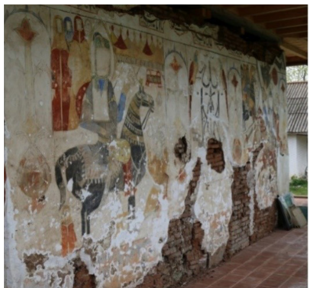
تصویر ۷. نقاشی دیوار جنوبی بقعه.