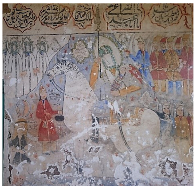
تصویر ۱۳. نقاشی سمت راست دیوار غربی بقعه، به میدان رفتن حضرت سیدالشهداء با علی‌اصغر (ع).