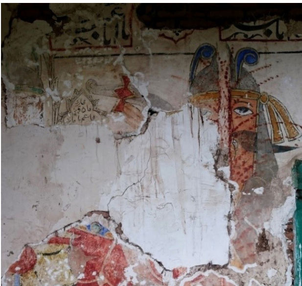
تصویر ۱۲. بخشی از نقاشی‌های دیوار غربی، نبرد حضرت ابوالفضل (ع) با مارد بن صدیف.