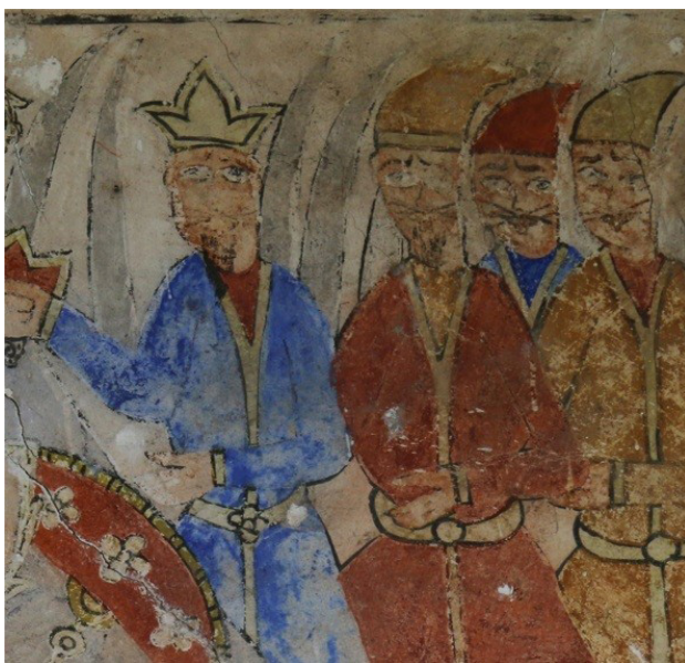
تصویر ۱۵. بخشی از نقاشی دیوار غربی بقعه، زعفر جنی و بارانش.

آن حضرت به‌گونه‌ای است که گویی مغموم بر نیزه تکیه داده است. بر بازوان امام بازوبند پهلوانی، بر پشت سپری به رنگ قرمز اخراپی و بر کمر شمشیر بلندی آویخته، دیده می‌شود (تصویر ۱۳). شمشیر ملهم از شمشیرهای عصر زندیه و قاجار است. علی‌اصغر (ع) با رویی گشاده و هاله‌ی قدسی دور سرش تصویر شده است. چهره آرام و آراسته او بر معصومیتش افزوده است. در جلوی اسب امام دو نفر دیده می‌شوند. شخص اول درویش کابلی است که با قبایی به رنگ قرمز، کلاه درویش، کشکول و تبرزین دیده می‌شود. او در حال تقدیم کشکول پر آب خویش به امام است. پشت سر او و کمی پایین‌تر تصویر مردی نامه به دست دیده می‌شود. براساس نوشته‌ی کنار تصویر، او همان مرد عربی است که از طرف دختر بیمار امام که در مدینه مانده و همراه کاروان نیست برای امام نامه‌ای آورده و تقدیم می‌کند. کوه بلندی به رنگ بنفش کم‌رنگ پشت سر امام حسین (ع) همچون خطی فضای نقاشی را به دو قسمت تقسیم کرده است. نحوه‌ی طراحی و رنگ‌آمیزی آن یادآور آثار نگارگر شهیر مکتب تبریز دوم، سلطان محمد است. در دو طرف این کوه لشکر اجنه به سروری «زَعْفَر جَنّی» با شمشیرهای آماده به مبارزه در سمت راست و در روبرویشان «پیغمبران سَلَف» با لباسی بلند و سفید و چهره‌ای پوشیده و هاله‌ی دور سر تصویر شده‌اند (تصاویر ۱۴ و ۱۵). اینان پیامبران الهی از آدم تا خاتم هستند که با شنیدن ندای امام حسین (ع) در ظهر عاشورا به یاری او شتافتند ولی امام یاری ایشان را نمی‌پذیرد. زعفر جنی در تصویر تاجی بر سر دارد و لشکریان اجنه کلاه مخروطی شکلی بر سر دارند. در سمت راست تصویر، پایین لشکر اجنه،