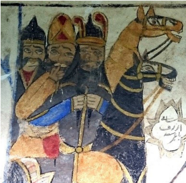
تصویر ۱۶. بخشی از نقاشی دیوار جنوبی بقعه.

ثابت نمودی از هیئت اشخاص نیست، بلکه بیشتر نمود خیر و شر است. افراد پلید و ظالم با چهره‌های غیرعادی و منفور و افراد خیر و نیک‌خو با چهره‌های مظلوم، ظریف و رنگ‌های ملایم، اجرا شده‌اند. در این شیوه، ترکیب‌بندی و رنگ‌ها آرمانی است. نقاشان این سبک، براساس خیالی بودن تصاویر، نشان دادن خیر و شر و مضامین اخلاقی، بزرگی و کوچکی تصاویر را به نقش اشخاص اختصاص داده و نکات مهم‌تر را، درشت‌تر و در مرکز بوم و افراد و نقش آفرینان کوچک‌تر را در حاشیه قرار می‌دادند. به این ترتیب بیننده کاملاً در جریان داستان قرار می‌گیرد (شایسته‌فر، ۱۳۸۹، ۵۰ و ۵۱).