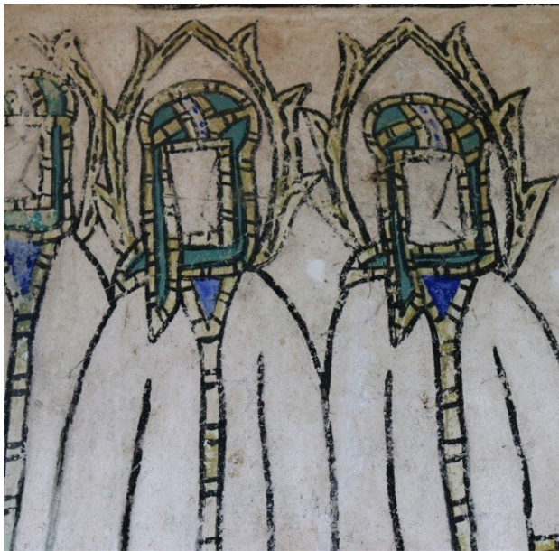
تصویر ۱۴. بخشی از نقاشی دیوار غربی بقعه، پیامبران.

ملائکه به رهبری «ملک منصور» نیز آماده‌اند تا به دستور امام وارد کارزار شوند. سپاه منصور ملک جملگی تاج بر سر و شمشیر بر دست دارند. امام حسین (ع) و ذوالجناح بخش بزرگی از تصویر را به خود اختصاص داده‌اند و تمرکز روی آنهاست. ترسیم امام حسین (ع) در وسط میدان دید نقاشی درحالی که بزرگ‌تر از باقی شخصیت‌های داستان است باعث شده بر اهمیت شخصیت ایشان تأکید بیشتری شود. مشهدی آقاجان عناصر و روایات متعدد را به‌گونه‌ای تنظیم کرده که چشم ناظر را به سوی شخصیت اصلی و محوری هدایت کند.