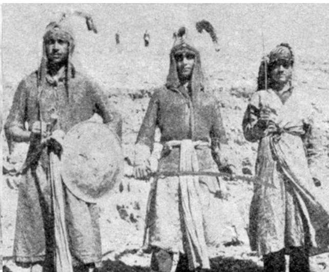
تصویر ۱۷. دو نمونه از شیوه لباس پوشیدن تعزیه‌خوانان در گذشته.

ممکن است در ابتدا شلوغ و پی‌نظم به‌نظر برسد ولی برای بیننده آگاه به داستان‌ها کاملاً آشنا است. مجالس متفاوت نقاشی روی یک دیوار مشترک با جدول‌کشی‌هایی مشابه آنچه سابقاً در نگارگری ایرانی دیده شده از هم جدا شده‌اند. ازاره دیوارها و نزدیک سقف مطابق سنت بقاع گیلان، با کتیبه‌های مذهبی همچون «إِنَّا فَتَحْنَا لَكَ فَتْحًا مُبِينًا» ۲ (قرآن کریم، سوره فتح، آیه ۱)، «یا ابا عبدالله حسین»، «یا محمد»، «یا علی» و اشعاری از ترجیع‌بند معروف محتشم کاشانی مانند «از آب هم مضایقه کردند کوفیان» در درون ترنج‌ها تزیین یافته است که کارکردی مشابه قاب دارند (تصویر ۱۸).