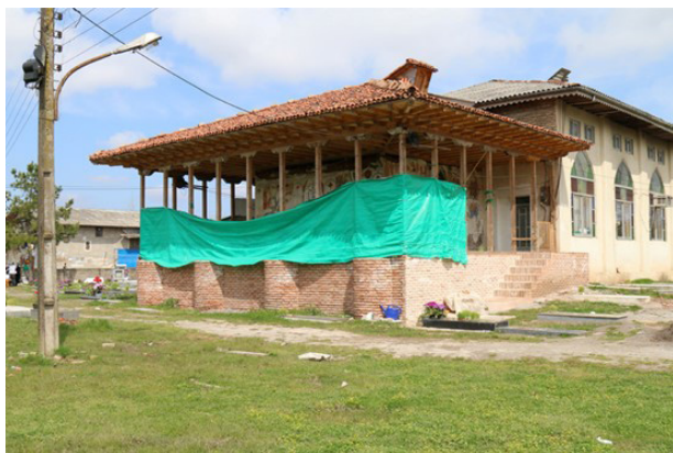
تصویر ۲. بنای بقعه آقا سیدعلی.

(۱۳۸۱، ۵۵۰). یا ویژگی تکراری و متمایزی در متن که به نظر پژوهشگر، نشان‌دهنده درک و تجربه خاصی، در رابطه با سؤالات تحقیق است (King & Horrocks, 2010, 150). روش تحلیل مضمون‌شناسانه توصیفی که در این پژوهش به کار گرفته شده، روشی است در جهت شناخت، تحلیل و گزارش الگوهای موجود در داده‌های کیفی که این داده‌های متنی پراکنده و متنوع مضمونی را به داده‌هایی تفصیلی بدل کرده است (Holloway & Todres, 2003; Braun & Clarke, 2006, 80). این روش، فرایندی برای دیدن متن، درک مناسب از اطلاعات ظاهراً بی‌ارتباط، تحلیل اطلاعات کیفی، مشاهده نظام‌مند و تبدیل داده‌های کیفی به کمی است (Boyatzis, 1998, 4). همچنین اصطلاح ساختار، به نمود سه بعدی اشکال در فضای پرسپکتیوی اطلاق شده و ساختار بصری، الگوی کلی روابط و کارکردهای عناصر متشکله در اثر است. این ساختار صوری یا بصری نیز انتظام از نیروهای بصری و نه چینش اتفاقی آنها حاصل می‌شود (پاکباز، ۱۳۸۱، ۲۹۳). هنرمند در تکوین اثر هنری، در پی جذاب‌ترین و رساترین طریقه ارائه یک ایده در اثر می‌پردازد به نحوی که به وحدتی اندام‌وار دست یابد. مضامین این نقاشی‌ها اغلب با استناد بر داستان‌هایی از دو کتاب «روضه‌الشهدا» و «طوفان‌البکاء» بررسی شده است که نقش به‌سزایی در ترویج روایات عامیانه از حادثه کربلا دارند. همچنین تمامی عکس‌های استفاده شده در این مقاله متعلق به آرشیو شخصی نگارنده است و در بازدیدهایی متعدد از نقاشی‌های این بقعه عکاسی شده است.