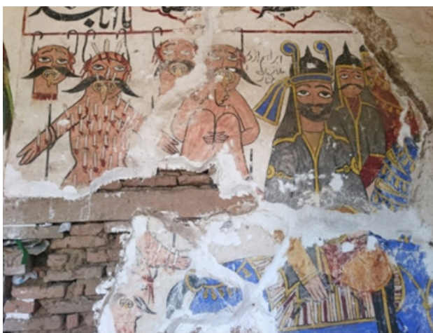
تصویر ۴. نقش مختار و یارانش بر دیوار شرقی بقعه.