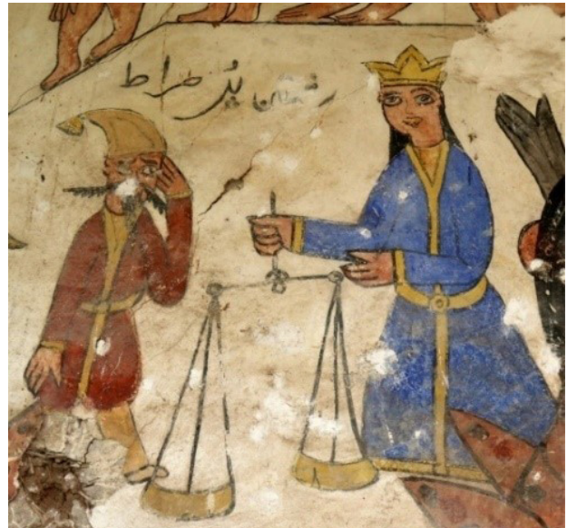
تصویر ۶. جزئیات نقاشی سمت چپ دیوار شرقی، فرشته عدل در روز داوری.

در این دیوار دو مجلس اصلی قابل مشاهده است. مجلس اول مربوط به محاربه حضرت قاسم (ع) با پسران ازرق شامی و مجلس دوم به میدان رفتن حضرت علی‌اکبر (ع) را نشان می‌دهد. این دیوار به لحاظ انتخاب موضوع و نحوه ترکیب‌بندی ارزش بصری بالایی دارد و توجه بیننده را به خود جلب می‌کند.