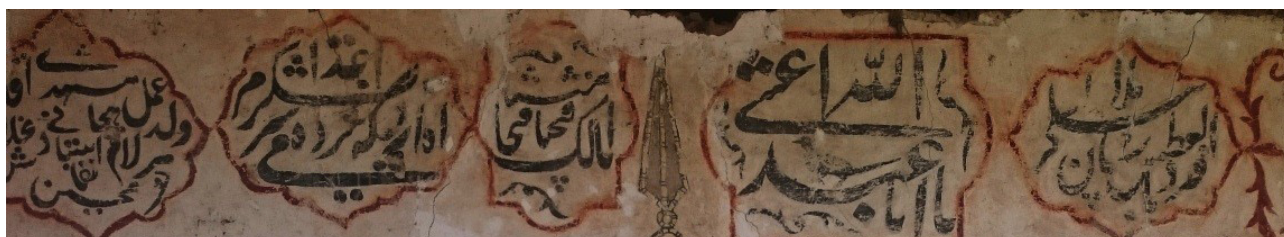
تصویر ۱۸. بخشی از کتیبه‌های مذهبی منقوش.

هر دسته از مضامین کلی مجالس فرعی را دربردارد و در هر دیوار نقاش موضوعات مختلف را در کنار یکدیگر و در گستره طولی دیوار با شگردهای خاصی به یکدیگر پیوند می‌دهد که