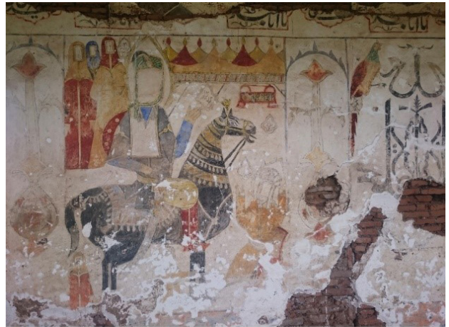
تصویر ۱۰. نقاشی سمت چپ دیوار جنوبی، به میدان رفتن حضرت علی‌اکبر (ع).

درون چند ترنج در اطراف علی‌اکبر (ع) به معرفی شخصیت‌هایی از داستان مانند ام‌لیلا (ع) و زینب (ع) می‌پردازد. در پس‌زمینه خیمه‌های یاران امام حسین (ع) برافراشته شده است. گهواره علی‌اصغر (ع) در پایین این خیمه‌ها دیده می‌شود. در پایین و روبروی علی‌اکبر (ع)، امام حسین (ع) در حالی که برای فرزند دل‌بند خود دست به دعا برداشته دیده می‌شود (تصویر ۱۰). اسب علی‌اکبر (ع) (عقاب) چون اسب شاهان آذین‌بندی شده است. چنانکه در متون متعددی آمده «سیما و هیئت آن حضرت بسیار شبیه به پیامبر بود» (رحمدل، ۱۳۸۶، ۴۶۰). کاشفی در روضه‌الشهداء می‌نویسد که «وقتی به میدان جنگ رسید، ساحت معرکه از شعاع رخسار وی منور شد. لشکر عمر سعد در جمال وی متحیر مانده، از وی پرسیدند که این کیست که تو ما را به حرب او آورده‌ای؟» (کاشفی، ۱۳۹۱، ۴۵۰).