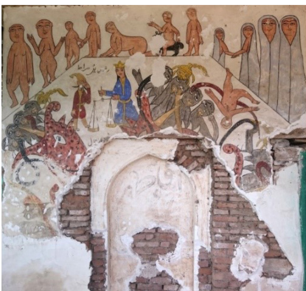
تصویر ۵. نقاشی سمت چپ دیوار شرقی بقعه.

حاضر دیوارهای داخلی نقشی ندارد ولی سه ضلع بیرونی ایوان بقعه سراسر نقاشی است که علی‌رغم آسیب‌های فراوانی که دیده، هنوز مجالس نقاشی آن قابل تشخیص است.