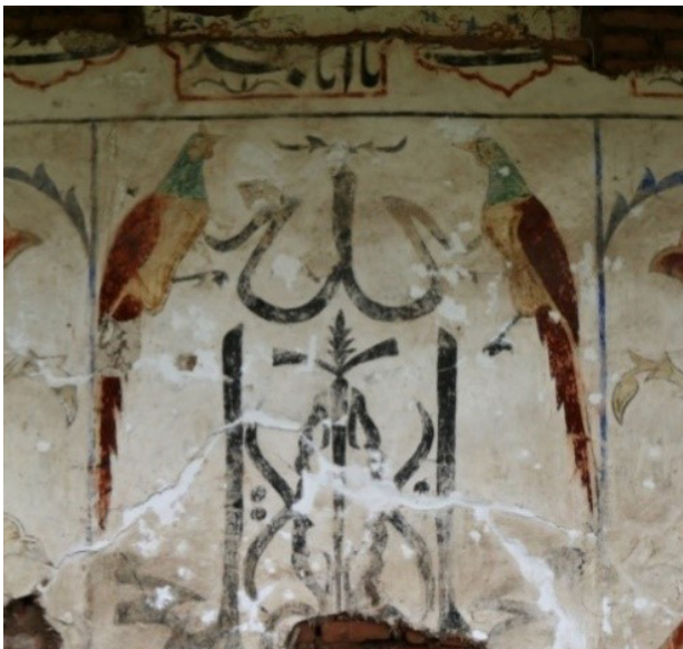
تصویر ۸. بخش از نقاشی دیوار جنوبی بقعه.