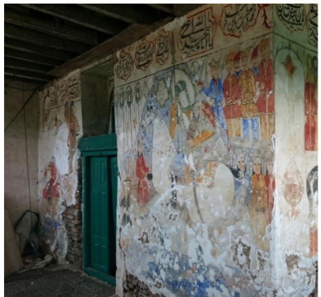
تصویر ۱۱. نقاشی‌های دیوار غربی بقعه.