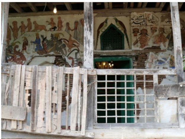
تصویر ۳. نقاشی‌های دیوار شرقی بقعه.