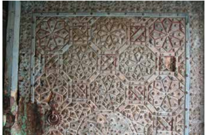
تصویر ۶. در ورودی منبت کاری شده. عکس: گلناز کشاورز، ۱۳۸۹.