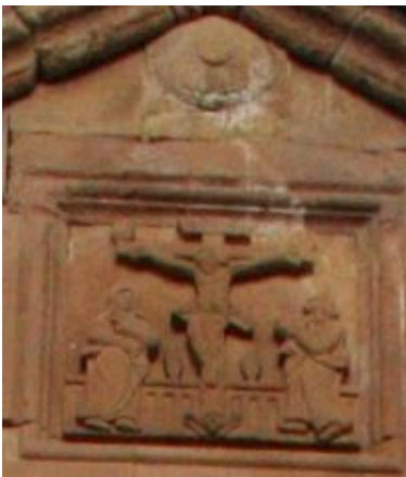
تصویر ۹. تصویر به صلیب کشیدن مسیح. عکس: گلناز کشاورز، ۱۳۸۹.