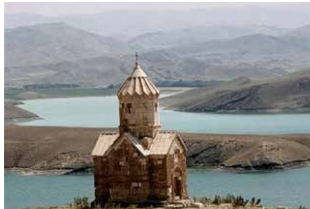
تصویر ۲. نمایی از کلیسای زور زور (باران)

نام سنت استپانوس از کلمه یونانی Stephanos به معنی «تاج» و نمادی از حد کمال شهادت در آئین مسیحیت شناخته می‌شود. سنت‌استپانوس را فرستاده مستقیم سنت‌پیتر و سنت‌متیو از حواریون مسیح دانسته‌اند. در هنرهای تصویری سنت‌استپانوس را به‌وسیله سه سنگ بر روی شانه‌ها و سر و نیز شاخه نخل،