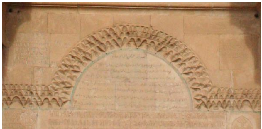
تصویر ۸. تصویر کتیبه فارسی سر در ورودی. عکس: گلناز کشاورز، ۱۳۸۹.