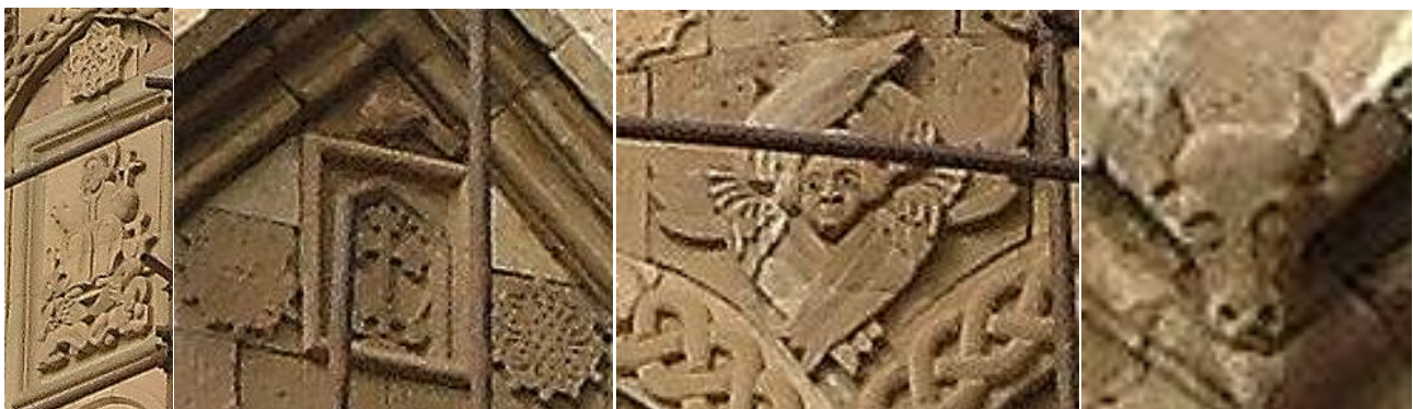
تصویر ۵. ب. تصویر سر گاو. بخشی از تصویر الف / تصویر ۵. پ. فرشته چهاربال. بخشی از تصویر الف / تصویر ۵. ت. تصویر صلیب و نقش‌های شمسه. بخشی از تصویر الف / تصویر ۵. ث. تصویر یکی از حواریون. بخشی از تصویر الف. عکس: گلناز کشاورز، ۱۳۸۹.