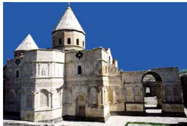
تصویر ۱. نمای از قره کلیسا.

به دلیل نزدیکی استان‌های آذربایجان غربی و شرقی به مرزهای آذربایجان، ارمنستان و نخجوان، ارمنه بسیاری در این منطقه از کشورمان زندگی کرده و عبادتگاه‌های بسیاری نیز برپا ساخته‌اند. سه کلیسای بسیار قدیمی ایران در این دو استان به نام‌های قره کلیسا ۱ (تصویر ۱)، سنت‌استپانوس (کلیسای خرابه) یا دره شام ۲ (تصویر ۲) و نیز کلیسای زور زور (باران) ۳ (تصویر ۳) قرار دارند. سنت‌استپانوس که مورد مطالعه این پژوهش است، در شانزده کیلومتری غرب جلفا در استان آذربایجان شرقی، شهرستان مرند و به فاصله سه کیلومتری کرانه‌ی جنوبی ارس در روستای متروکه‌ای بنام «دره شام» ۴ قرار دارد. نام کلیسا الهام‌گرفته از نام «استپانوس» شهید اول راه مسیحیت است و به علت استقرار آن در روستای دره شام به این نام نیز خوانده می‌شود. ۵ رود ارس و منطقه جغرافیایی این کلیسا، دارای وجه تسمیه و سوابق تاریخی قابل توجهی برای این پژوهش است. ارس به عقیده بعضی مستشرقین همان رود دائی‌تیای اوستا است. آن را در قدیم اراسک و یونانیان اراسک می‌نامند (دهخدا، ۱۳۳۴: ۱۵۴۴). در اوستا آمده که در کنار رود دائیتی به زرتشت امر شد تا مردم را به خداشناسی دعوت کند. ۶