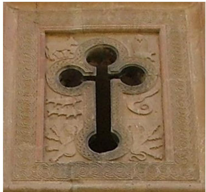
تصویر ۱۲. تصویر پنجره صلیبی و نقش پنج نماد مهری در اطراف آن. عکس: گلناز کشاورز، ۱۳۸۹.