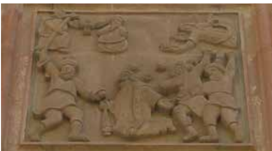
تصویر ۱۱. صحنه شهادت استپانوس.