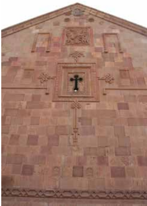
تصویر ۱۳. نمای کلی از دیوار شرقی کلیسا.

در زیر این قسمت قاب نورگیری به شکل صلیب وجود دارد. مهم‌ترین ویژگی این نورگیر، وجود تصویر و نمادهایی به شکل حیوانات در اطراف صلیب است (تصویر ۱۲). دو طرف بالای صلیب کلاغی سمت راست و گاوی در طرف چپ مشاهده می‌شود. پائین سمت راست، یک مار و در طرف چپ تصویر دو ماهی وجود دارد. در قسمت آخر نیز دو شیر نر به شکل قرینه در طرفین پایه صلیب کار شده‌اند.