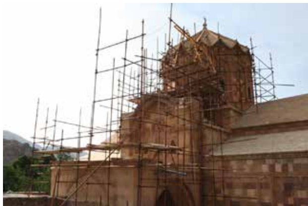
تصویر ۳. نمایی از کلیسای سنت استپانوس.

حصار و بارویی بلند با هفت برج نگهبانی و پنج پشت‌بند استوانه‌ای سنگی شبیه دژهای مستحکم دوره ساسانی و قرون اولیه اسلام دور تا دور محوطه کلیسا را دربر گرفته است. بنا از سه بخش مشخص تشکیل شده: برج ناقوس، نمازخانه، و اجاق دانیال. برج ناقوس روی ایوان در طبقه‌ی متصل به دیوار جنوبی قرار داشته