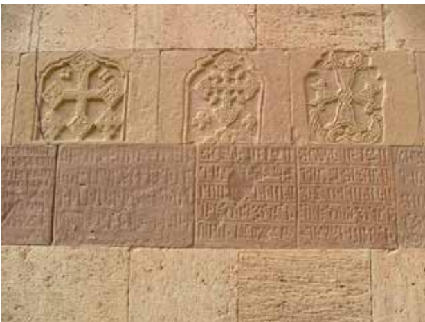
تصویر ۱۵. نمونه‌ای از سنگ‌نوشته‌های ارمنی بر دیواره کلیسا.