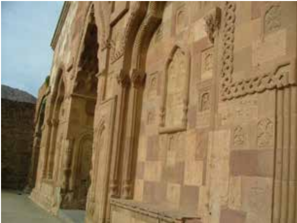
تصویر ۷. نمونه‌ای از حجاری‌های کلیسا.

مقرنس کاری بسیار زیبایی مشاهده می‌گردد. در جنوب نمازخانه بر نمای بیرونی نمادها و کنده‌کاری‌هایی بر روی سنگ دیده می‌شود که بسیار حائز اهمیت است. از بالا در ابتدا تصویر عقابی که دو طرف آن گل‌هایی مشابه خورشید قابل‌رؤیت است. عقاب در حال حمل کردن چهارپایی با چنگال‌های خود است