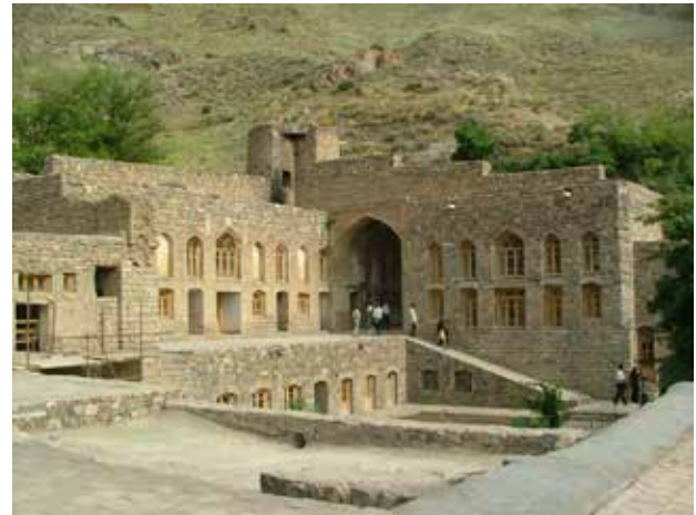
تصویر ۱۴. نمایی از دیر سنگی در کنار بنای کلیسا. عکس: گلناز کشاورز، ۱۳۸۹.