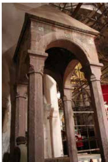
تصویر ۱۷. یک نمونه از نمازگاه‌های سنگی کلیسا. عکس: گلناز کشاورز، ۱۳۸۹.

در سفرنامه تاورنیه، سیاح مشهور فرانسوی در دوره‌ی صفویه و عکس‌های موجود در آرشیو کاخ گلستان که توسط علی‌خان والی، حکمران شمالی آذربایجان در دوره ناصرالدین‌شاه قاجار گرفته شده، به وجود استخوان‌های حواریون و قدیسین از جمله