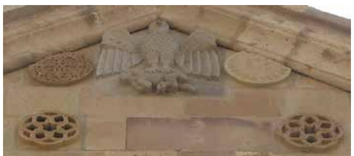
تصویر ۱۰. تصویر عقاب در حال حمل بره. عکس: گلناز کشاورز، ۱۳۸۹.