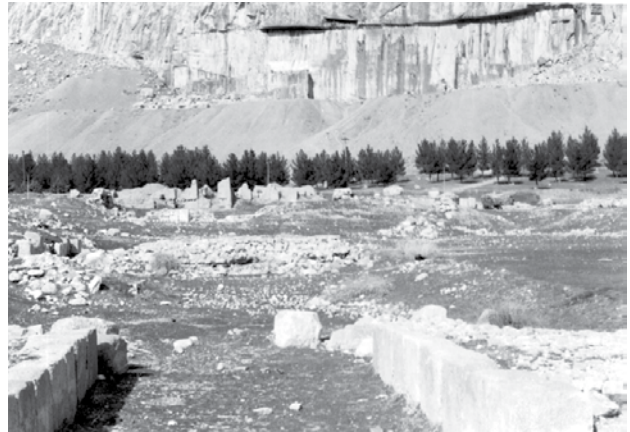
تصویر ۱۳. صفا فرهادتراش، بیستون، بزرگترین دستکزه ایران پیش از اسلام، ساخت و شکل دهی بنا، استفاده از الگوی باغ سازی ایرانی یعنی ترکیب عنصر فضای سبز، آب و آفرینش یک حجم معماری است، عکس : سید امیر منصوری، آرشیو پژوهشکده نظر، ۱۳۹۲.