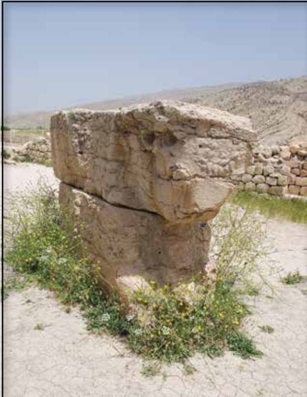
تصویر ۱۵. معبد اناهیتا، بیشاپور، عکس : ایدا آل هاشمی، ۱۳۸۸: ۶۱