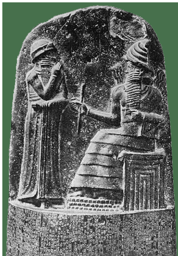
تصویر ۱۳. ایزد خورشید شمش، بین‌النهرین.

مهر پس از پایان رسالت خویش که آگاهی و تبلیغ دین خویش است سوار بر اریه چهار اسبه به آسمان می‌رود و روز واپسین برای شفاعت پیروان به این جهان باز می‌گردد. همان گونه که مسیح (ع) پس از شام آخر با یاران خویش، عروج کرد و روز قیامت جهت شفاعت یاران باز می‌گردد. در یونان و ایتالیا کیش مهر گاه با عرفان گنوسی شرقی آمیخته است.