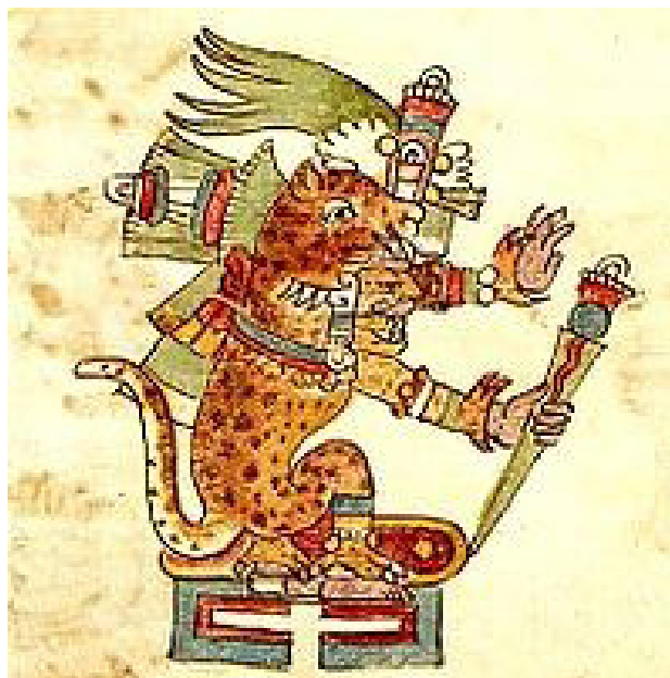
تصویر ۱. تزکاتلیپوکا خدای مکزیک در قالب پلنگ در ارتباط با مراسم شمنیک.

متون هندو، خورشید را مبدأ وجود همه چیز می‌داند، آغاز و انتهای هر آنچه ظاهر است و اطعام‌کننده همگان (همان، ۱۱۸). خورشید، (Sing-Bong) در رأس خدایان مونداهای بنگال جای دارد (الیاده، ۱۳۷۲، ۱۳۸). «سوریا» خدای خورشید هندی با چهره‌ای مردانه ظاهر شده و مرکب او ارابه‌ای با هفت اسب است که در مهرابه‌های جنوب هند دیده می‌شود. میترا خدای خورشید آریایی هند در قالب مردی است که با ارابه چهار اسبه به آسمان