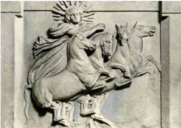
تصویر ۸. میترا سوار بر ارابه چهار اسبه.