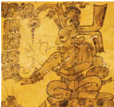
تصویر ۱۲. ج) کینچ آهانو خدای خورشید در اساطیر قوم مایا.