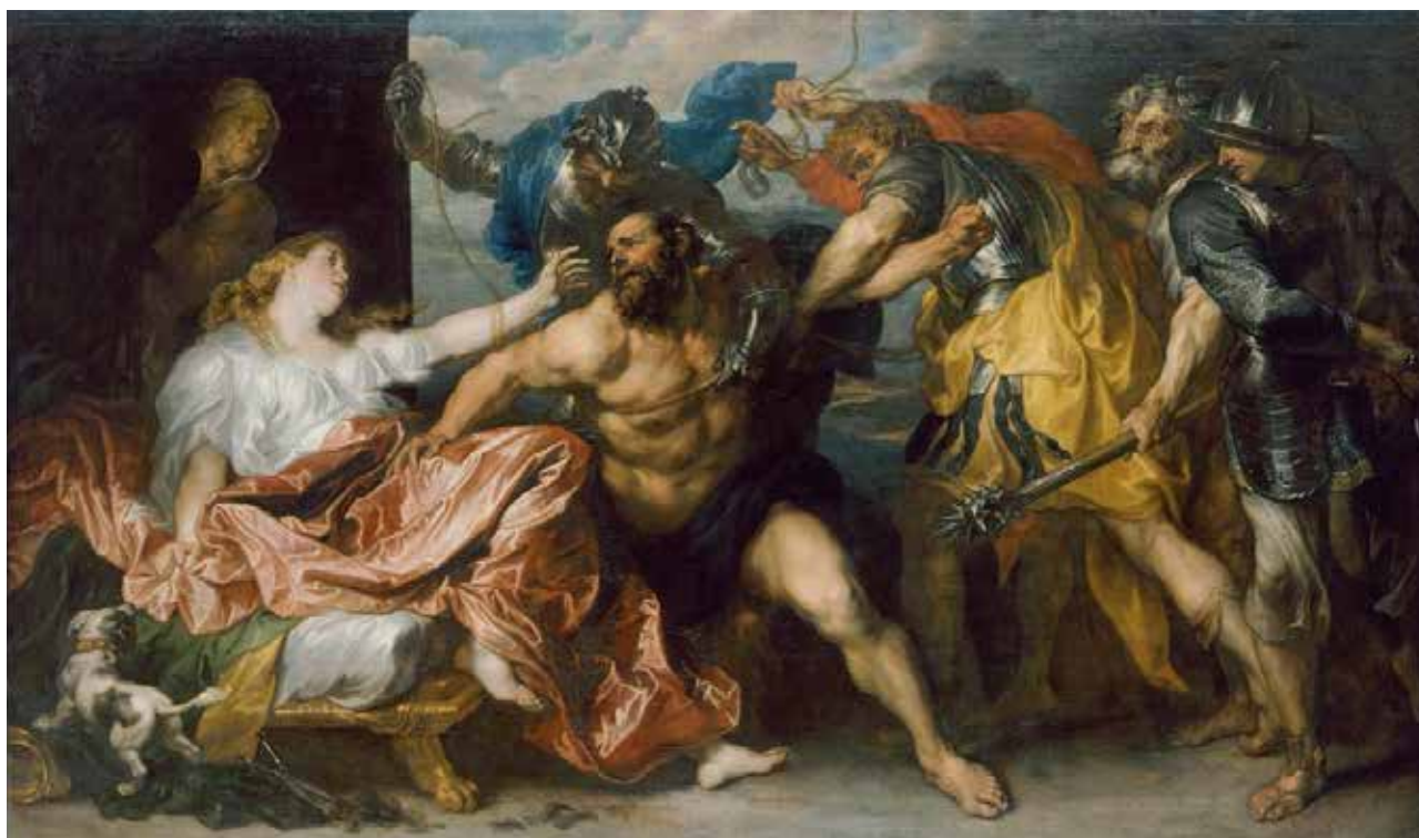
تصویر ۱۶. شمشون و دلیله - آنتونی دیک.