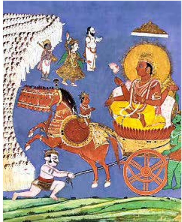
تصویر ۶. سوری یا سوار بر ارابه.

در هرم خدایان «زتک» خدای بزرگ خدای خورشید مظهر