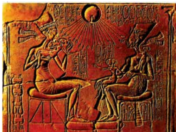
تصویر ۵. آمنحوتپ چهارم و خدای آتون با قرص خورشید.

«آپولون» خدای خورشید و قطب قله‌های عرفانی که از دودمان هیپربورها بود، پیکانی چون شعاع خورشید داشت (تصویر ۱۱). «هوخیوس» اهل باتوس می گوید: مسیح به مثابه خورشیدی است که عدالت را پرتو می افکند یعنی همچون خورشید معنوی و قلب جهان. «فیلتوتئوس سینیایی» می گوید: مسیح خورشید حقیقت است. خاخام اعظم فرقه‌ای از یهودیان قرص زرین بر سینه خود