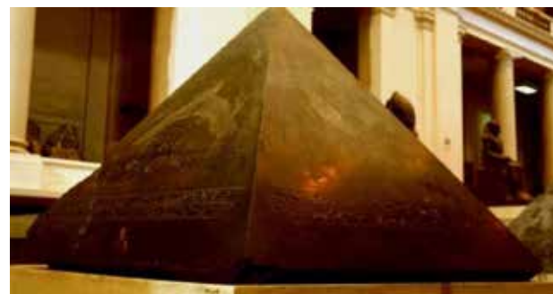
تصویر ۲. سنگ مقدس بن بن، نوک هرم فرعون در معبد قفنوس.

سنگ به شمار می‌رفتند (هارت، ۱۳۷۴)؛ (تصویر ۲). مصریان باستان بیش از هر مذهب دیگر کیش خورشیدپرستی داشتند. طغیان منظم رود نیل اهمیت اساسی در زندگی مردم داشته است. پرتو درخشنده آفتاب، حاصل‌خیزی لایه‌های رسوبی نیل، و بازگشت مداوم فصل‌های گرم، بادهای صحرا که با خود مرگ غلات را همراه می‌آورد، بر مصری‌ها تأثیر بسیار داشت. از این رو آنها خورشید را نیروی اصل طبیعت یا خدا می‌پنداشتند و آن را «رع» می‌نامیدند (گروه نویسندگان، ۱۳۹۹).