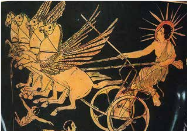
تصویر ۹. هلیوس سوار بر ارابه چهار اسبه.

عنصر خورشید با بسیاری از گل‌ها و حیوانات از جمله گل داوودی، لوتوس، آفتابگردان، عقاب، گوزن، شیر و ... همچنین با فلز طلا که در علم کیمیاگری خورشید فلزات است مقایسه شده است. در باور چینی خورشید یانگ - مذکر و در مقابل بین ماه و مؤنث است.