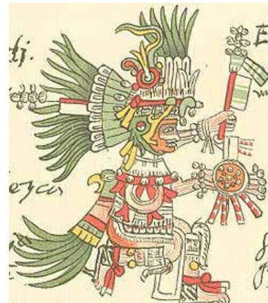
تصویر ۱۲. الف) خدای خورشید از تک-خورشید عقاب (یا مرغ مگس خوار) - اویتسیلوپوچتلی، طرحی در مستندات تلریانو-رمنسیس.

و غرب عالم شاهد هستیم. به نظر می‌رسد دلیل برتری مهر - میترا اسطوره خورشید آریایی، در ایران ایزد ایزدان، دارای تمامی صفات خیر و نماد نور و فروغ خورشید بوده است، از این رو با سایر خورشید خداه‌ها و خدایان پرستی دیگر اقوام متفاوت است. مهر ایرانی یار و یاور جنگجویان راستین است که از وطن دفاع می‌کند، خدای عهد و پیمان و مظهر نور ایزدی است.