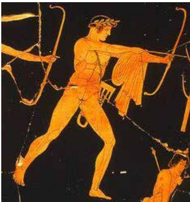
تصویر ۱۱. آپولون همراه با پیکان. مأخذ: https://www.pinterest.com .

خورشید خانوم به چشم می خورد در حالی که میترا ایزد مذکر است و نام او بر دختران گذاشته می شود. این موارد تاکنون بررسی دقیق نشده است که مجال دیگری می طلبد. ماه در ایران همواره مؤنث و منسوب به ایزدبانو آناهیتا الهه باروری است و طبق برخی روایات دوشیزه آناهیتا مادر مهر است.