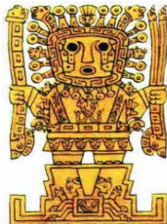
تصویر ۱۲. ب) ویراکوچا خدای خورشید اینکاها با آذرخش در دست و تاج خورشید بر سر و اشک‌های بارانی.