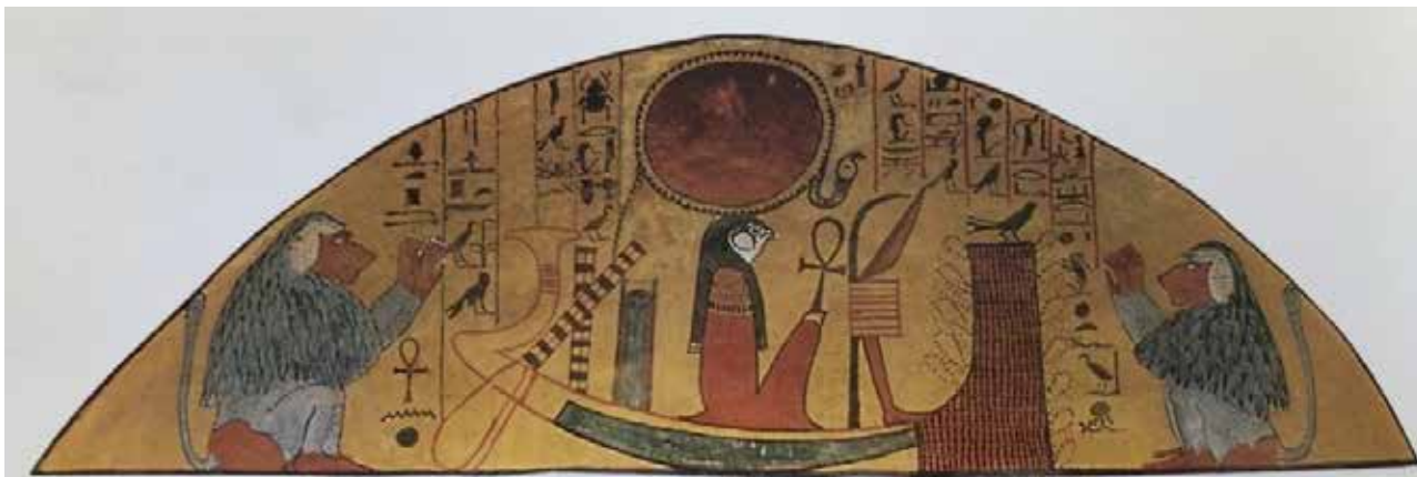
تصویر ۳. رع خدای خورشید در زورق با دو بوزینه- جشن طلوع خورشید.