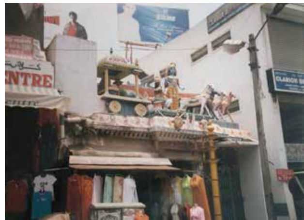
تصویر ۷. ورودی معبد در جنوب هند، میترا با ارابه ۴ اسب.

حمل می‌کند که نماد خورشید الهی است. خورشید نماد جهانی شاهنشاه و قلب مملکت است. مادر خاقان «وو» از سلسله هان خواب دید که خورشید وارد سینه‌اش شد و پسرش وو را به دنیا آورد. پس خورشید نماد باروری و شاهنشاهی است.