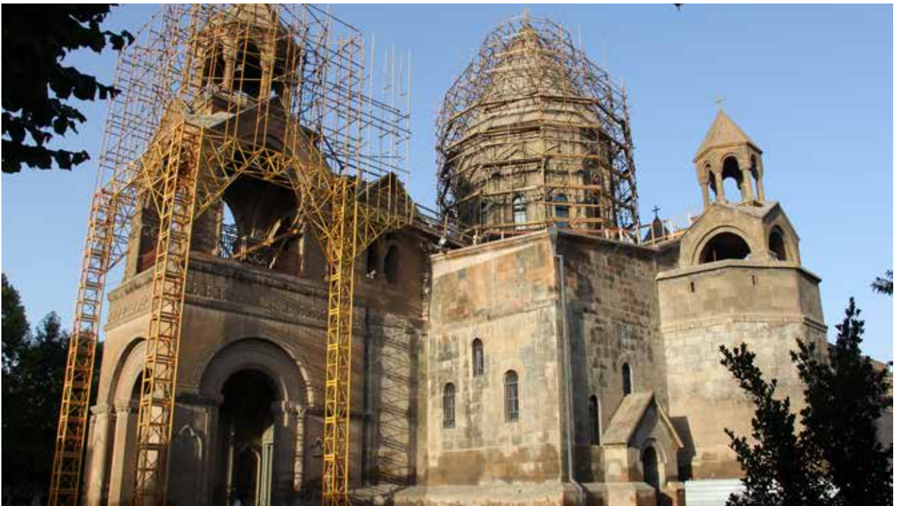
تصویر ۵. مجموعه کلیسای اچمیادزین که اصل بنا متعلق به قرن ۴ میلادی است و در قرن ۱۷ میلادی هم‌زمان با دوره صفویه در ایران، با انتقال مقر اسقف در این مکان بازسازی شده است. اچمیادزین، ارمنستان.