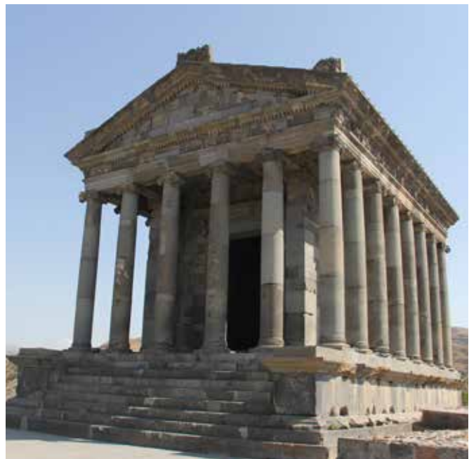
تصویر ۸. معبد خورشید پرستی گارنی متعلق به دوران قبل از مسیحیت. دارای پلانی تک شبستانی و مهرابی در جبهه شرقی و ورودی در جبهه غربی. گارنی، ارمنستان.