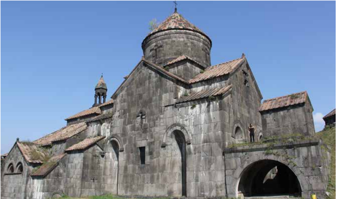
تصویر ۴. صومعه حقیات متعلق به دوره شکوفایی صومعه‌ها. پلانی چلیپایی با گنبدی در مرکز آن، فضاهای خدماتی در اطراف شبستان و مصالح سنگی. صومعه حقی پات، ارمنستان.