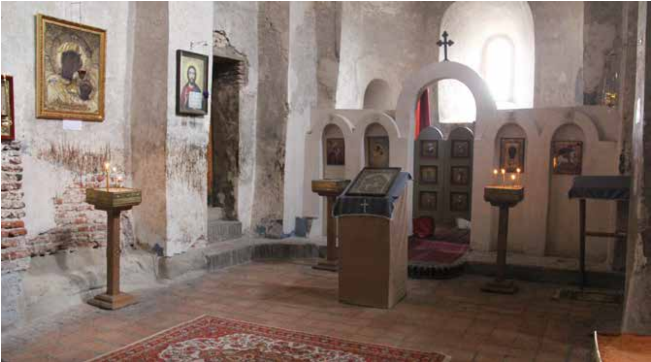
تصویر ۳. فضای داخلی کلیسای اپلیستیخه متعلق به قرن ۴ میلادی. کلیسای تک‌شبستانه و محوری در جبهه شرقی. کلیسای اپلیستیخه، گرجستان.