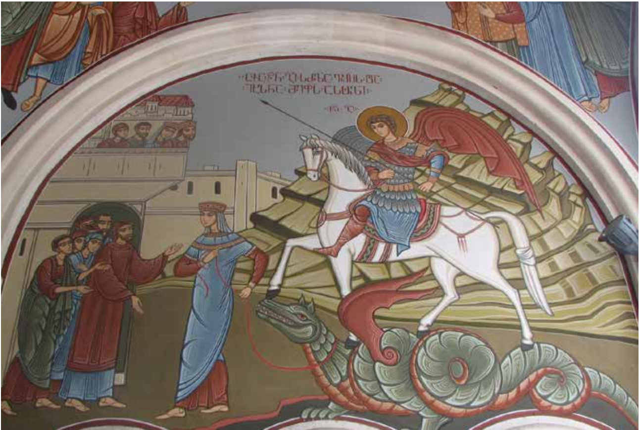
تصویر ۶. نقاشی‌های نمادین و روایتی در بدنه شبستان و گنبد محراب. کلیسای مادر خدا، تفلیس، گرجستان. عکس: پدیده عادلوند، آرشیو مرکز پژوهشی نظر، ۱۳۹۲.