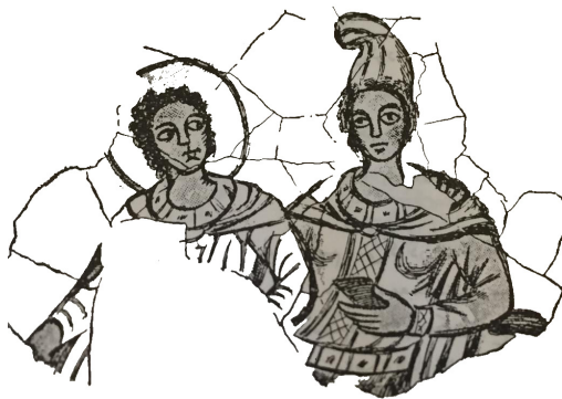
تصویر ۳. میترا با کلاه فریجی و جام دوستکامی - سل خدای خورشید با هالهٔ نور.

در جهت شرق معابد مهری معمولاً نقش برجسته‌ای با موضوع گاوکشی مقدس دیده می‌شود که طرفین مهر دو نفر (مهربان) ایستاده یکی ایزد پیام‌آور (سروش) و دیگری (رشن) ایزد عدالت که در قیامت بالای کوه البرز گناهان انسان‌ها را اندازه می‌گیرند. علامت ماه مهر ترازوی عدالت است. میترا پس از ابلاغ پیام عدالت و رهبری مردم به آسمان عروج کرده و