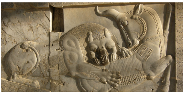
تصویر ۴. غلبهٔ نمادین شیر بر گاو. میترا گاو را قربانی کرده در نبردی غیر خصمانه پایان زمستان و آغاز بهار را نوید می‌دهد.