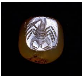
مهر ساسانی با نقش عقرب، قرن ۵ میلادی.