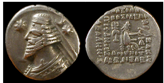
سکه اشکانی، ارد دوم.