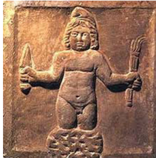
تصویر ۲. زایش میترا از سنگ با مشعل و خنجر.

روز قیامت همچون مسیح (ع) برای شفاعت پیروان به زمین بازمی‌گردند. میترا به شکل انسانی در نقوش ایرانی ظاهر نشده بلکه در قالب شیر، عقاب یا نشانه‌های دیگری مانند چلیپا، ستاره خورشید و ... جلوه نموده است مانند سنگ‌نگاره نبرد شیر و گاو در تخت جمشید (تصویر ۴).