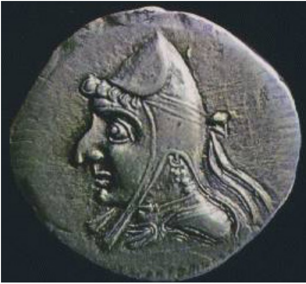
سکه اشکانی.