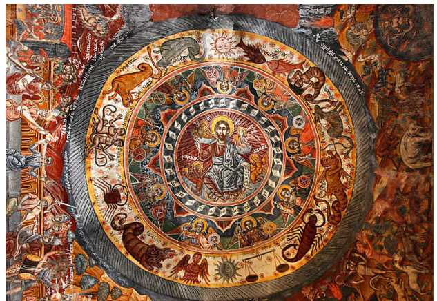
نقش صور فلکی در کلیسا.

نتیجه‌گیری کیش مهر در میان آریاییان هند و ایران رایج بود و در دوران اشکانی و ساسانی به امپراطوری روم رفت. نشانه‌های آیین مهر در ایران و جهان با تفاوت‌هایی برخاسته از فرهنگ شرقی و غربی در نقاط مختلف جهان تاکنون برجاست. ردپای میترای در دوران اساطیری و تاریخی ایران سپس در دوران اسلامی تاکنون دیده می‌شود. آیین و فرهنگ مهر در جهان باستان پراکنده شده چنانکه