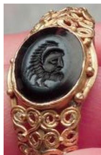
عقرب در نگین انگشتر.