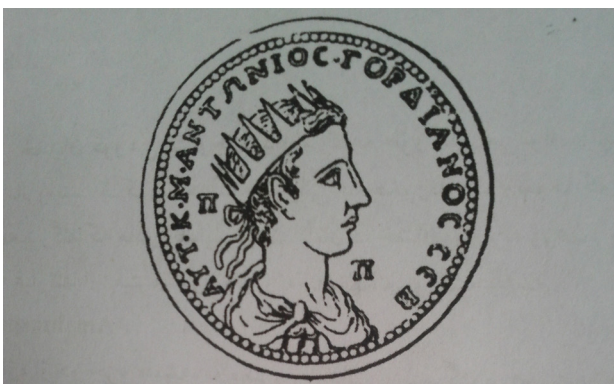
سکه رومی، میترا با تاج خورشید. مأخذ : ورمازرن، ۱۳۸۳.