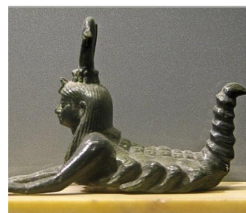
تلفیق زن و عقرب در مجسمه مصری.