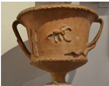
عقرب نشان مقدس به روی جام.

صحنه گاوکشی مقدس دیده می‌شود. تصویر عقرب در حفاری لرستان پیدا شده است. در مصر باستان خدای عقرب ایزد بانوی مؤنث و مقدس، همسر خدای بزرگ مصر بود. در لرستان الهه عقرب را می‌پرستیدند و در ادیان ایرانی عقرب موجودی پاک و غیر و اهریمنی است. در فرهنگ بابلی‌ها حافظ خدای شمش - خدای خورشید - خدای عقرب بود. عقرب، نماد جنگ است. مار و عقرب بر خلاف نظر برخی از محققان خارجی و داخلی مظاهر اهریمنی نبوده و از نمادهای مهری در مراحل و درجات مختلف محسوب می‌شوند. نماد سرباز که مرحله سوم از مراحل مهری است در آسمان مریخ (خدای جنگ) و در زمینی عقرب است. تصویر عقرب در برخی از ظروف مقدس آئینی مهر که در طی کاوش‌های باستان‌شناسی به دست آمده اغلب با نردبان سه پایه‌ای همراه است که بیانگر مرحله سوم آئینی میترا؛ یعنی «سرباز» است. کوزه‌ای در موزه شهر دارمشتات ۱ که بر روی آن تصویر عقرب با نردبان سه پایه (مقام سوم مهری) دیده می‌شود اشاره کرد (تصویر ۵).