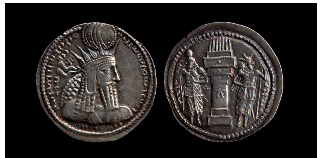
سکه ساسانی، تاج شاه با شعاع‌های نور.