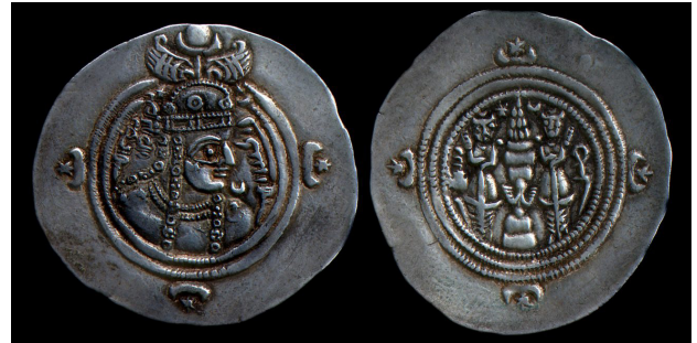
سکه ساسانی با نقش هلال ماه، ستاره یا خورشید.