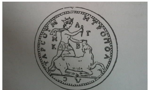
تصویر ۱. نشانه‌های مهرشناسی.