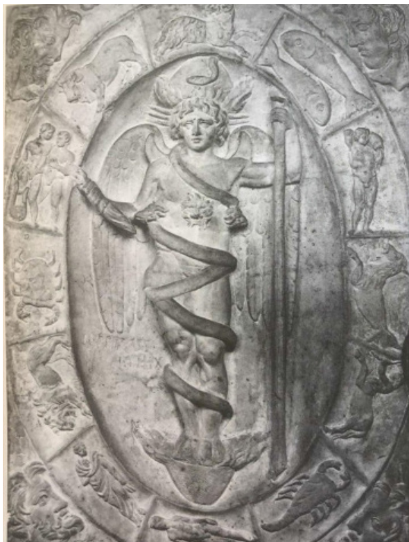
نقش صور فلکی و بروج دوازده‌گانه در مهرابه.

تصویر ۶. نقوش صور فلکی در کلیسا و مهرابه.