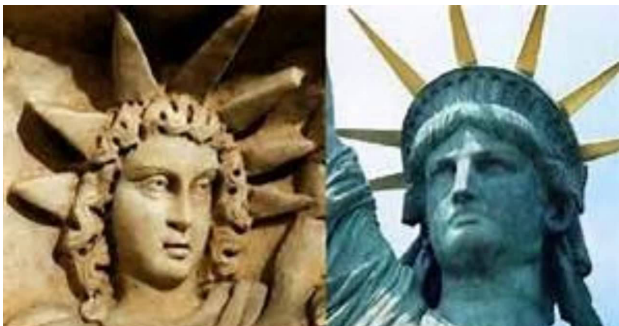
نقش برجسته میترا و مجسمه آزادی.