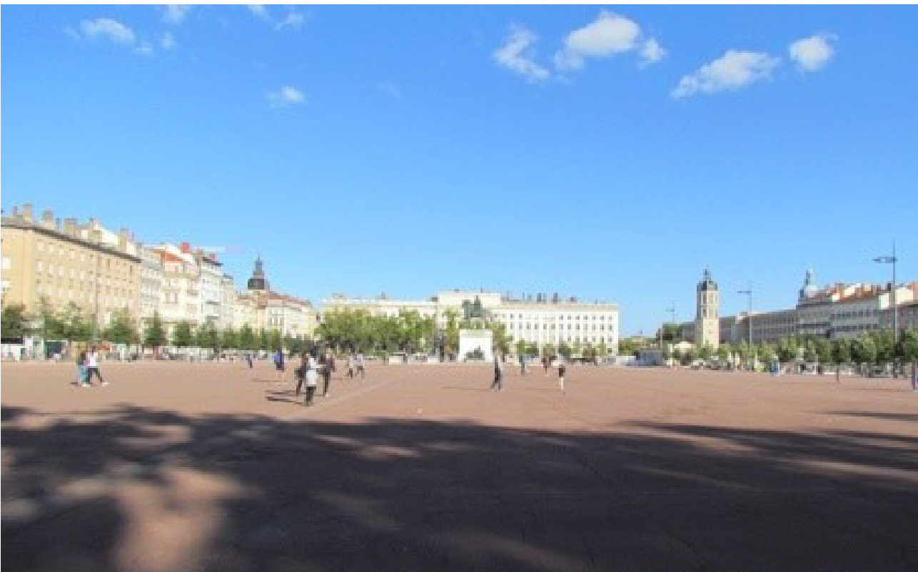
تصویر ۸: میدان Bellecour، اصلی‌ترین فضای جمعی شهر.

مکانی-زمانی خواهد بود که وجود زمینه تاریخی قوی در فضا و به تبع آن تداوم رفتارهای اجتماعی شکل گرفته مهم‌ترین مؤلفه ارزشی آن محسوب می‌شود. نمونه‌های مطالعه شده در این پژوهش، علی‌رغم تنوع و تمایز نهادها و نظام‌های تأثیرگذار بر شکل‌گیری و مدیریت فضای جمعی در تحولات شهری، از استمرار ضرب‌آهنگ هر دو