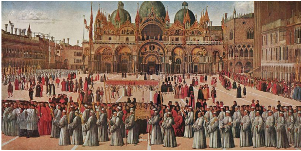
تصویر ۲. سن مارکو، مهمترین فضای جمعی در اذهان شهروندان به واسطه تجربه اتفاقات تاریخی، سیاسی، مذهبی.