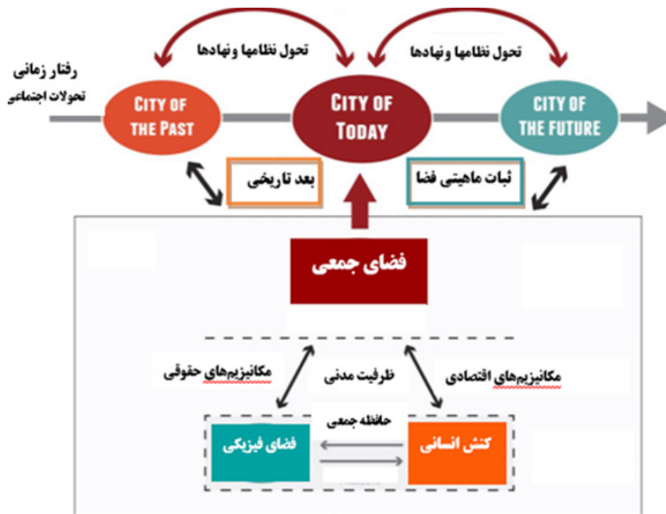
تصویر ۱. چارچوب مفهومی پایداری فضای جمعی در تحولات نظامها و نهادها.

مردم منطقه داشته است. میدان به عنوان ورودی اصلی و دروازه شهر، تنها بندر ورود به ونیز برای تجار و بازرگانانی که از راه دریا به این شهر می آمدند بود. با این وجود تمامی این ساختمانها و فعالیتها، به عنوان بناهای تکمیل کننده هسته اولیه میدان یعنی کلیسای سن مارکو بودند. این کلیسا از گذشته تاکنون همچنان نقش مذهبی خود را به خوبی حفظ کرده است و هم اکنون نیز محل برگزاری بسیاری از مراسم مهم مذهبی است. به این ترتیب در گذر زمان این بخش از ونیز از یک صحن ساده در جلوی کلیسای سن مارکو به اصلی ترین فضای جمعی شهر مبدل گشت و تا امروز نیز اهمیت خود را به عنوان یکی از مشهورترین فضاهای شهری اروپا حفظ کرده است. میدان بستر شکل گیری حوادث تاریخی، سیاسی، اجتماعی بسیاری است که نقش مهمی در انتقال معانی دارند و بدین لحاظ از جایگاه ویژه ای در حافظه جمعی برخوردار است. تداوم فعالیت هایی که گاه از دوره های بسیار قبل مرسوم بوده و امروزه به عنوان یک سنت دیرینه شناخته می شود، منضم به فعالیت های که با رفتارهای اجتماعی و ضرورت های حال شکل گرفته است مانند فروش صنایع دستی و محصولات فرهنگی، برگزاری