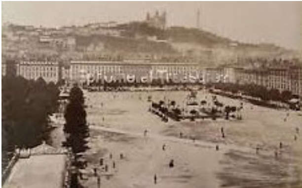
تصویر ۷. میدان Bellecour - C.1880 Albumen Photograph