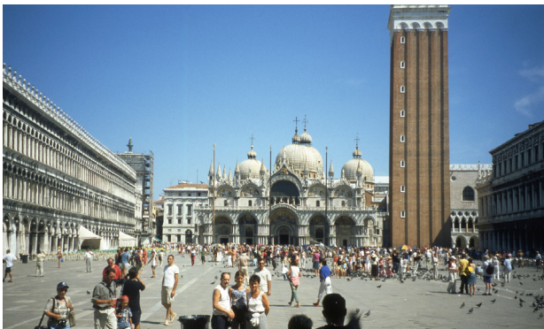
تصویر ۴. سن مارکو به مثابه فضای جمعی معاصر.

گرفته باشد. متأثر از تحولات اجتماعی رنسانس در قرن شانزدهم، پادشاه فرانسه ۱ شورای شهر لیون را مجبور کرد که این عرصه را به یک میدان عمومی تبدیل کنند. لیکن ورثه اسقف با طرح دعوی در دادگاه مانع شدند. سال‌ها بعد