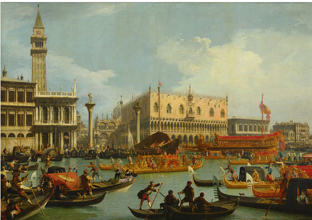
تصویر ۳. سن مارکو دروازه ورود بازرگانان