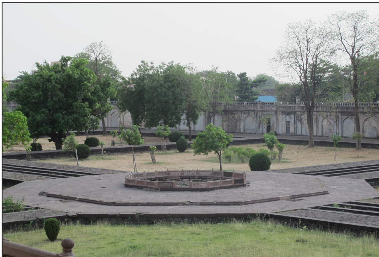
تصویر ۲. صفا وسیع در محل تقاطع محورهای فرعی باغهای هندی. باغ مزار بی بی کا، اورنگ آباد.