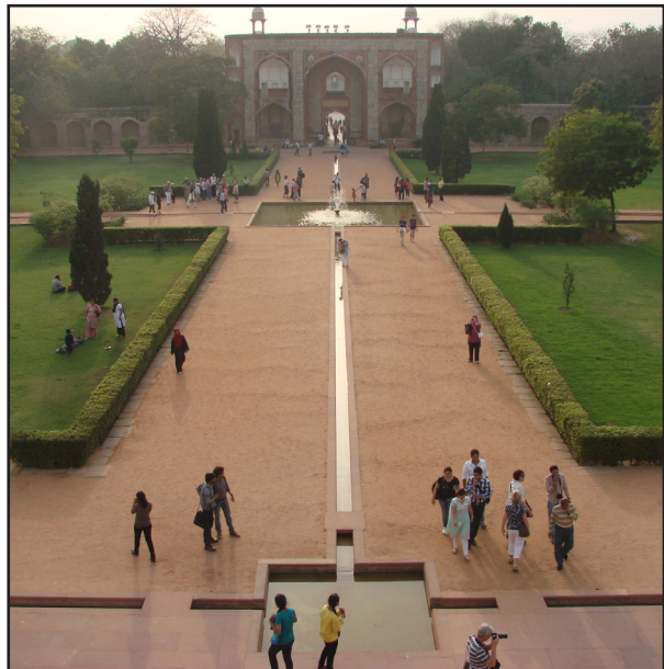
تصویر ۴ الف. حضور ساکن و تزئینی آب در میان محور باغ هندی. باغ‌مزار همایون، دهلی. عکس: مهرداد سلطانی، ۱۳۹۱.

• ناظر با عبور از بنای ورودی با محور اصلی باغ مواجه می‌شود. محور اصلی باغ که حفاصل ورودی و بنای میانی باغ قرار دارد با توجه به عظمت بنای مقابل، عریض‌تر از حد معمول در نظر گرفته شده است. پهنای این محور به حدی است که کل بنا در زاویه دید ناظر قرار گیرد. اما در باغ‌های ایرانی عرض خیابان اصلی این‌گونه نبوده و نسبت به مقیاس کل باغ محوری باریک‌تر است. به طور مثال در باغ شاهزاده ماهان کرمان، هرچند محور خیابان نسبتاً عریض بنا شده، اما بخش کف‌سازی و سطح سخت آن کم است (تصاویر ۳). • حضور آب که نقشی اساسی در طراحی باغ ایرانی دارد، در محور اصلی باغ هندی و دیگر محورهای آن کم‌رنگ بوده،