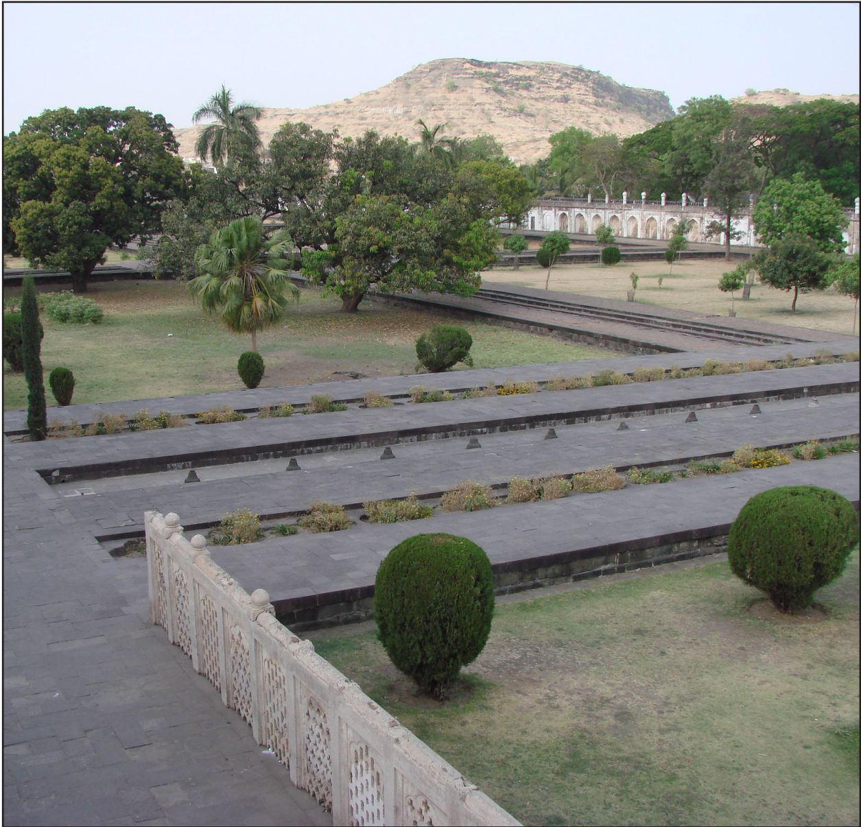
تصویر ۶. منظره تقسیمات هندسی باغ از فراز صفا بلند در باغ هندی. باغ‌مزار بی‌بی‌کا، اورنگ‌آباد. عکس: مهرداد سلطانی، ۱۳۹۱.