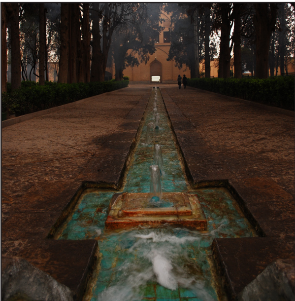
تصویر ۴ ب. تلاطم آب در نهرهای باغ ایرانی به وضوح قابل مشاهده است. باغ فین، کاشان.

• ناظر با عبور از بنای ورودی با محور اصلی باغ مواجه می‌شود. محور اصلی باغ که حفاصل ورودی و بنای میانی باغ قرار دارد با توجه به عظمت بنای مقابل، عریض‌تر از حد معمول در نظر گرفته شده است. پهنای این محور به حدی است که کل بنا در زاویه دید ناظر قرار گیرد. اما در باغ‌های ایرانی عرض خیابان اصلی این‌گونه نبوده و نسبت به مقیاس کل باغ محوری باریک‌تر است. به طور مثال در باغ شاهزاده ماهان کرمان، هرچند محور خیابان نسبتاً عریض بنا شده، اما بخش کف‌سازی و سطح سخت آن کم است (تصاویر ۳). • حضور آب که نقشی اساسی در طراحی باغ ایرانی دارد، در محور اصلی باغ هندی و دیگر محورهای آن کم‌رنگ بوده،