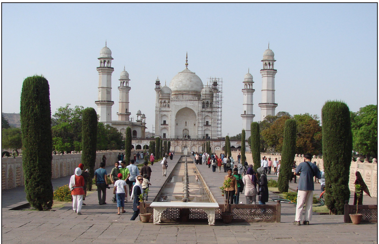
تصویر ۸. دیواره‌های سنگی دو سوی محور اصلی در باغ مزار بی‌بی‌کا آن را شبیه یک کوچه کرده است. باغ‌مزار بی‌بی‌کا، اورنگ‌آباد.