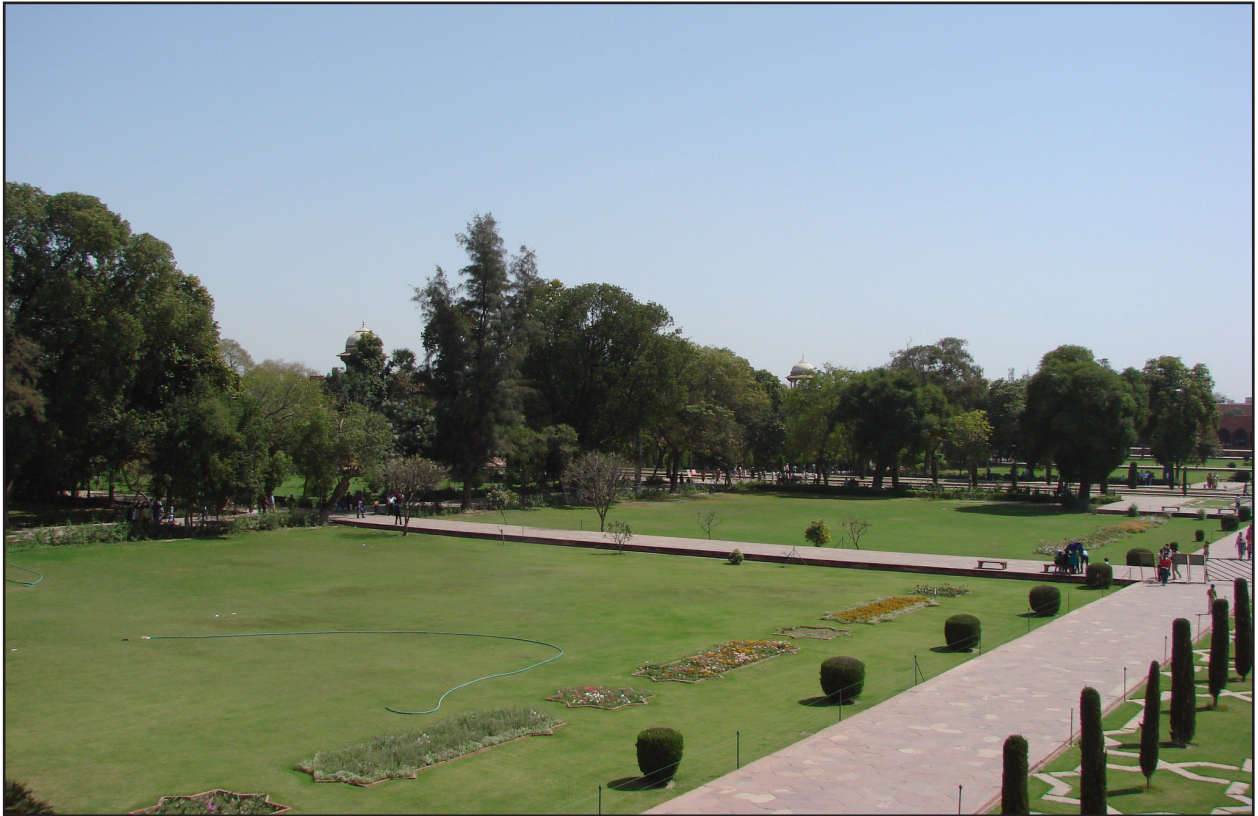
تصویر ۷. اختلاف ارتفاع میان سطوح کف‌سازی و کرت‌های باغ‌های هندی. باغ‌مزار تاج محل، آگرا. عکس: مهرداد سلطانی، ۱۳۹۱.