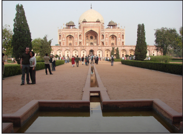
تصویر ۳ الف. عرض محور اصلی باغ هندی در فضای تنگ باغ خودنمایی می‌کند. باغ‌مزار همایون، دهلی.

به گونه‌ای که جوی آب باریک میان محور پیاده‌روی باغ در مقایسه با سطوح سخت پیرامون آن تنها جلوه‌ای تزئینی و مینیاتوری داشته و از صلابت محور عریض و سخت باغ نمی‌کاهد؛ این در حالی است که جوی آب باغ ایرانی خود را با شخصیتی کاملاً متفاوت در محورها نمایش می‌دهد و حضوری پررنگ دارد. این مسئله به وضوح در باغ دولت‌آباد یزد نمود دارد. سکون آب موجود در جوی‌ها، در قیاس با تلاطم آب جاری نهرهای باغ ایرانی عاملی مضاعف در راستای غلبه سطوح سخت کف‌سازی باغ است. در نتیجه کف سنگی بستر و تزئینات لبه‌های جوی است که در باغ هندی بیش از آب خودنمایی می‌کند (تصاویر ۴).