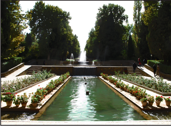
تصویر ۳ ب. با وجود عریض بودن خیابان باغ ایرانی، منظر نرم آن خودنمایی می‌کند. باغ شاهزاده، ماهان کرمان. عکس: سیدامیر منصوری، ۱۳۹۲.