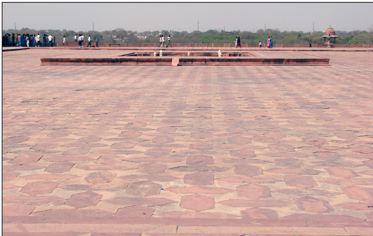
تصویر ۱. صفا بزرگ و سنگی که پیرامون مقبره گسترده شده و به باغ مسلط است. باغ مزار همایون، دهلی. عکس: مهرداد سلطانی، ۱۳۹۱.