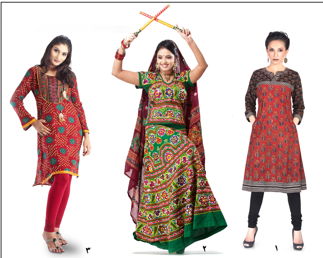
تصویر ۴. نمونه‌ای از لباس زنان هند. ۱. کمیز و شلوار. ۲. قآگرا چلی. ۳. کورتا.

در این شرایط، جامعه هند هشدارهایی را می‌شنود؛ اینکه اگر ساری با زندگی امروز زنان هندی متناسب نشود، نسل جوان این لباس سنتی را فراموش خواهد کرد. برای باور این زنگ خطر، کیمونوی ژاپنی‌ها به عنوان مثال ذکر می‌شود؛ لباسی که امروز به مراسم رسمی همچون آیین‌های عبادی یا عروسی محدود شده است. اگرچه طراحان لباس هند، با این شعار که لباس، بوم خوبی برای نوآوری است، برای نجات ساری از فراموشی به صحنه آمدند تا خلاقیت به خرج دهند و ساری فرصت دیگری