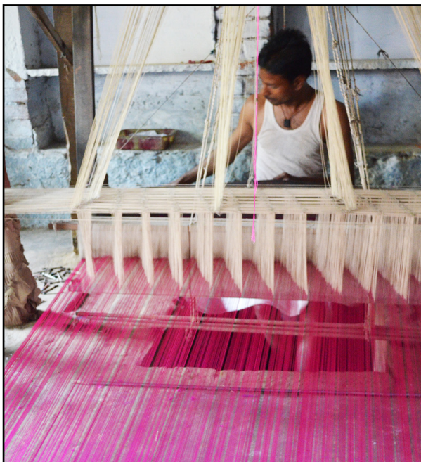
تصویر ۳. کارگاه‌های کوچک پارچه‌بافی همراه با نیروی کار ارزان از جمله عوامل رونق صنعت نساجی در هند است. بنارس، هند. عکس: شهرزاد خادمی، ۱۳۹۱.

ماهیت صنعت نساجی هند نیازمند نیروی انسانی زیاد است؛ به همین خاطر نقش عمده‌ای در اشتغال‌زایی اغلب کشورهای مترقی و نه عقب‌افتاده دارد. هندوستان برای رفع مشکل ناشی از نیروی کار غیر ماهر خود اقداماتی را در نظر گرفته است مانند آرایه پوشش‌های بیمه‌ای برای کارگران، توجه بیشتر به دانش فنی، هویت‌بخشی به کارگران نساجی، اعطای مزایای بیشتر در مقابل اخذ تعهدات کاری بلندمدت‌تر از کارگران و نیز ایجاد حس ثبات و پایداری شغلی برای آنها (تصویر ۳). اما در شرایطی که نیروی کار ارزان یک مزیت برای صنایع نساجی هند به حساب می‌آید،