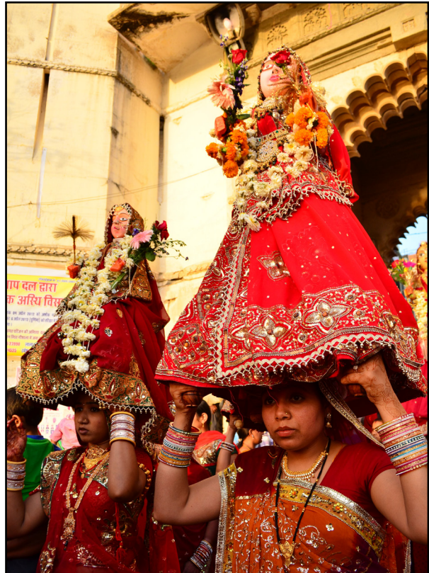
تصویر ۱. لباس زنان و عروسک‌ها در مراسم نمادین عروسی شیوا و پاواراتی، لباس سنتی هندی است. ادیپور، هند. عکس: شهرزاد خادمی، ۱۳۹۱.