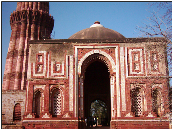
تصویر ۹. دو رنگ قرمز و سفید در مسجد قوه الاسلام. دهلی، هند. عکس : سیدامیر منصور، ۱۳۸۲.

گروه دوم (مساجد متأخر) مربوط به دوره های معاصر بوده که الگوی غالب آن ها دو رنگ است که معمولاً رنگ سفید در کنار رنگ دیگری چون سبز، صورتی و آبی به کار رفته است. تفاوت اصلی این بناها با گروه اول، پوشش رنگ بر مصالح اصلی است. این شیوه به جهت مصالح جدید و سهولت در ساخت و ساز مورد