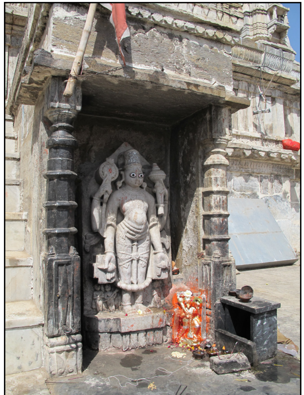
تصویر ۸. تمثال ویشنو در معبد جگدیش. عکس : شروین گودرزیان، ۱۳۹۱.