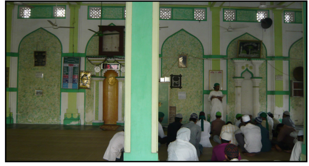
تصویر ۱۲. رنگ سبز و سفید در مسجد احمدآباد، هند.