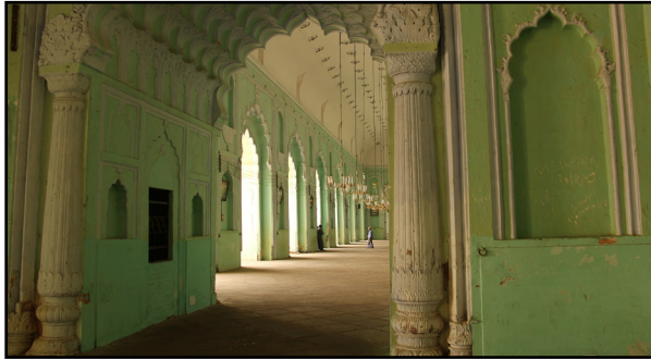
تصویر ۱۳. رنگ سبز، سفید و آبی در حسینیه لاکنو، هند.