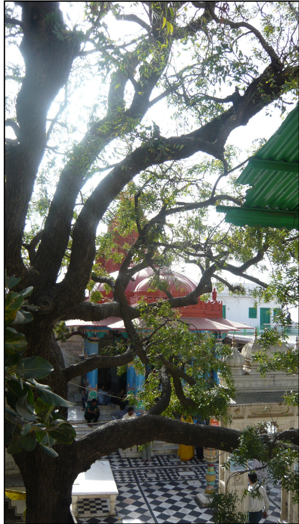
تصویر ۳. حیاط شطرنجی معبد برهما به دو رنگ سیاه و سفید. پوشکار، هند. عکس: شهره جوادی، ۱۳۹۱.

فضای پشت معبد، بنایی مکعب‌شکل قرار دارد که تماماً به رنگ زرد و گرداگرد آن راهرویی به منزلهٔ دالان طواف دیده می‌شود. متأسفانه امکان بازدید از داخل این مکان وجود نداشت (تصویر ۴).