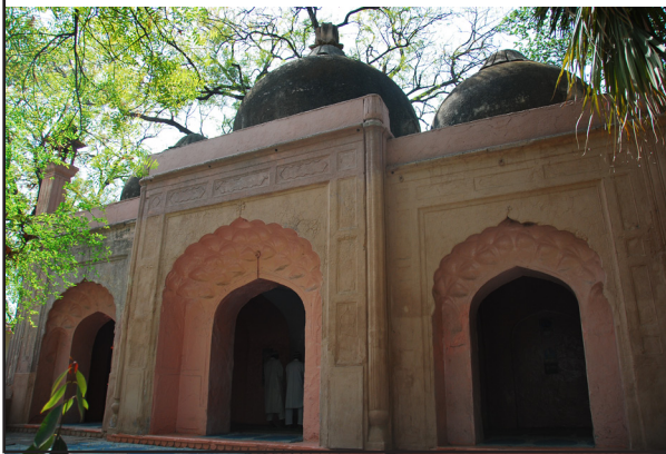
تصویر ۱۱. رنگ صورتی، سفید و سبز در مسجدی در جوار مجموعه قطب منار، دهلی. هند. عکس: زهرا عسکرزاده، ۱۳۹۱.

ایوان، فضایی دلنشین و آرامبخش ایجاد کرده است (تصویر ۱۱). گستردگی روابط با دیگر کشورها در الگوپذیری معماری و تزئینات و از جمله عنصر رنگ تأثیر داشته است. رنگ‌ها گاه برگرفته از معماری کشورهای اسلامی، تأثیر پذیرفته از رنگ‌های معابد هندویی و گاه ترکیبی از این دو است. ترکیب رنگ سبز و سفید مانند مساجد عربی در مسجدی در بافت شهری احمدآباد (تصویر ۱۲) و رنگ‌های سفید، سبز و آبی در حسینیه شهر لاکنو به چشم می‌خورد (تصویر ۱۳).