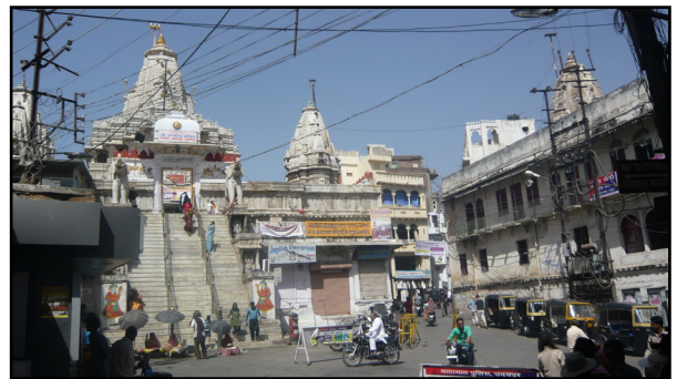
تصویر ۷. نمای معبد جگدیش، ادیپور، هند. عکس : شهره جوادی، ۱۳۹۱.

معبد جگدیش (Jagdish) در شهر ادیپور، متعلق به خدای ویشنو است که در قرن ۱۷ میلادی بنا شده است. در تمامی فضاهای خارجی و داخلی معبد، از دیوارها گرفته تا کف و سقف، رنگ سفید به کار رفته است (تصویر ۷). تنها محراب آن به رنگ سیاه (با تزئینات و پارچه های زرد طلایی) است. در اینجا نیز مانند معبد شیوا دهلی دو رنگ سیاه و سفید به کار رفته است. به نظر می رسد رنگ سفید در نمای خارجی و داخلی معابد گذشته از آنکه سنگی است که به سادگی در اقلیم یافت می شود، به جهت مفهوم آن که خلوص، صلح و آرامش را در پی دارد نیز انتخاب شده باشد و رنگ سیاه محراب شاید به لحاظ دفع نیروهای اهریمنی باشد که خدایان را در فضای سیاه جای داده اند (تصویر ۸).