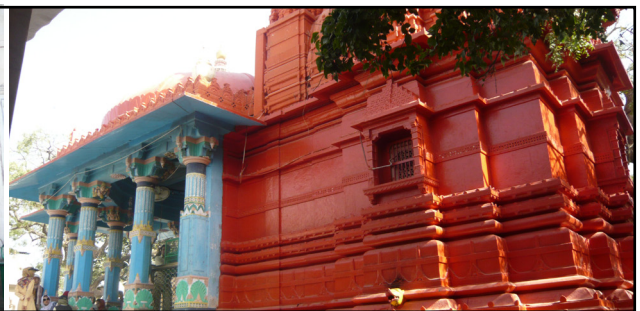
تصویر ۲. معبد برهما و تمثال وی. پوشکار، هند. عکس: شهره جوادی، ۱۳۹۱.