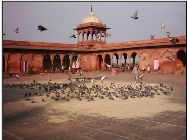
تصویر ۱۰. دو رنگ قرمز و سفید در مسجد جامع دهلی، هند. عکس: سیدامیر منصور، ۱۳۸۲.

توجه قرار گرفته و رنگ‌های پوششی جهت تزئین استفاده شده‌اند. از این جمله می‌توان به مسجد کوچکی در مجموعه قطب منار در جوار مسجد قوه‌الاسلام اشاره کرد که رنگ غالب این بنا صورتی و سفید است. سادگی و بی‌پیرایگی این مکان مقدس در شبستان و ایوان با پوشش رنگی سبز و صورتی و هماهنگ با درختان، گیاهان سبز، خاک باغچه و حوض کوچک مقابل