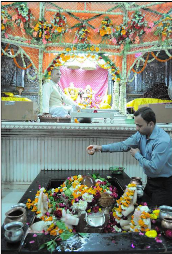
تصویر ۵. محراب معبد شیوا. دهلی، هند. عکس: شهره جوادی، ۱۳۹۱.

میلاادی است که در شهر دهلی خیابان چاندیچوک قرار دارد و تمثال شیوا در آن نگهداری می‌شود. رنگ غالب معماری آن سیاه و سفید بوده چنانکه در تمامی فضاهای داخلی و خارجی معبد، دیوارها و کف به رنگ سفید است. پارچه‌هایی به رنگ نارنجی نیز دیوارهای داخلی را تزئین کرده‌اند (تصویر ۵). محراب به رنگ سیاه که تندیس شیوا را با دو رنگ آبی و زرد در خود جای داده است (تصویر ۶). بنابراین دو رنگ متضاد سیاه و سفید در تمامی معبد دیده می‌شود؛ و سایر رنگ‌های معبد در تزئینات مجسمه‌ها و گل‌های رنگینی است که در محراب قرار دارند.