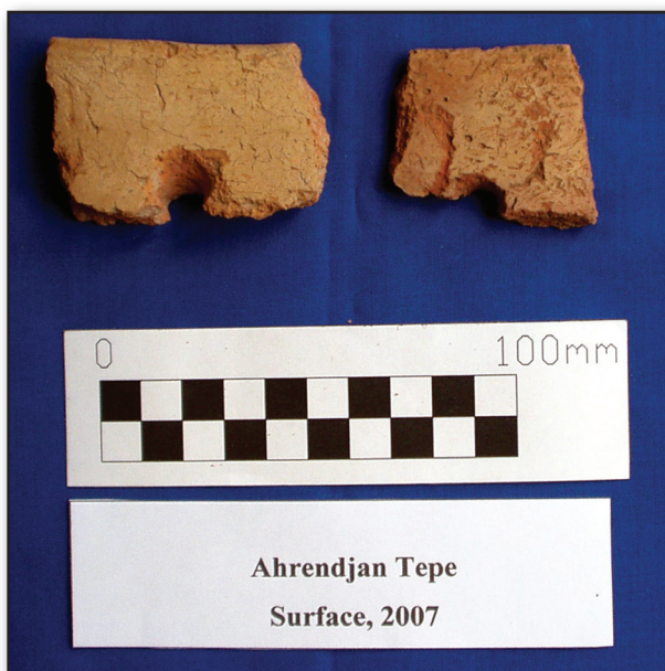
تصویر ۳. نمونه‌هایی از سفال‌های کاه‌آلود اهرنجان - قره تپه. سال ۱۳۸۶.

و حتی یانیق‌تپه نیز گزارش شده است (Burney, 1964; Mel-, Laart, 1975; Voigt, 1983; Talai, 1983; Hole, 1987).