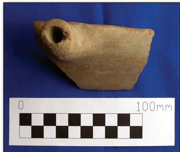
تصویر ۴. نمونه‌ای از سفال‌های لوله‌دار یافته از قره تپه، سال ۱۳۸۶.

۳. سفالینه‌های معروف به سینی پوست‌کنی یکی از شواهد باستان‌شناختی دوره جدید نوسنگی در شمال بین‌النهرین و زاگرس شمالی است (Bernbeck, 1994). اما در مجموعه سفالی اهرنجان - قره تپه هیچ نمونه‌ای از سینی‌های پوست‌کنی مشاهده و گزارش نشده است (آجورلو، ۱۳۸۶؛ Ajorloo, 2008 a&b).