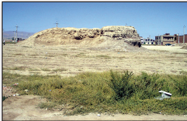
تصویر ۲. نمایی از اهرنجان تپه در سلماس، سال ۱۳۸۶.

قطعات سفالی گونه اهرنجان تپه البته همراه با قطعات سفالی نوع حاجی‌فیروز در لایه‌های فوقانی و مرحله پایانی سکونت عصر نوسنگی در اهرنجان تپه نیز گزارش شده است؛ بنابراین در اهرنجان تپه، قدمت لایه‌های فرهنگی که معرف سنت عصر نوسنگی